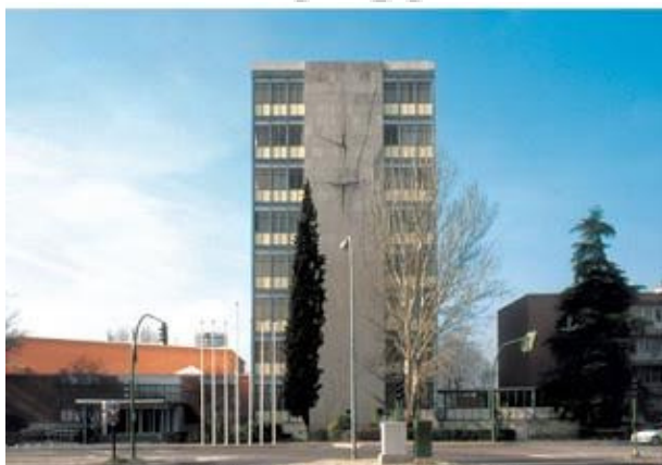
Facultad de Ciencias de la Actividad Física y del Deporte (INEF)