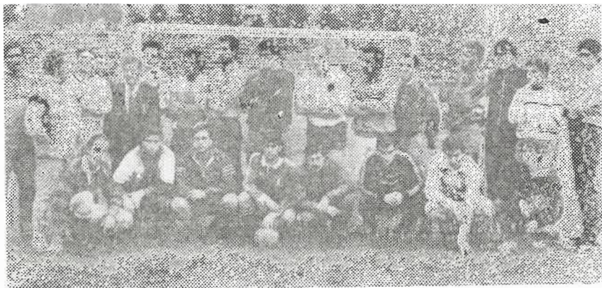
Сборная Испании. 20. IV. 1920 г.