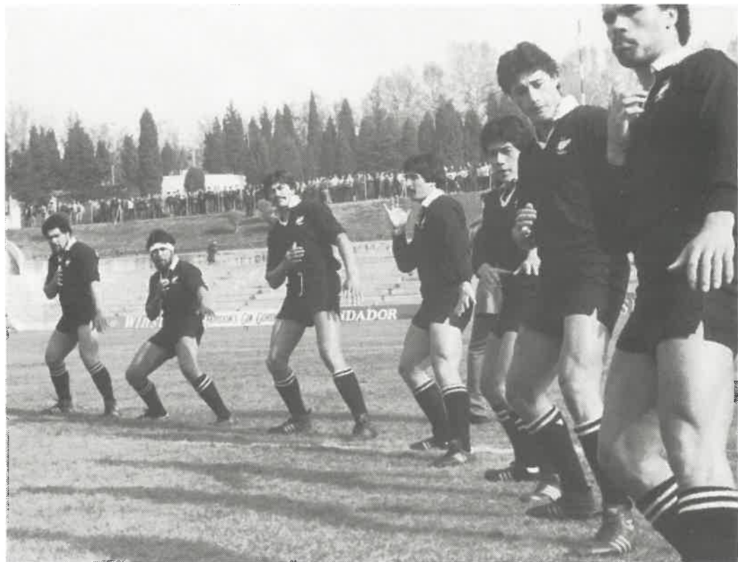
Los Moaries en plena actuación de la danza «HAKA». Madrid. 20-11.82.

Inga iwi inga hapu inga waka tena koutou tena koutou tena koutou katoa.