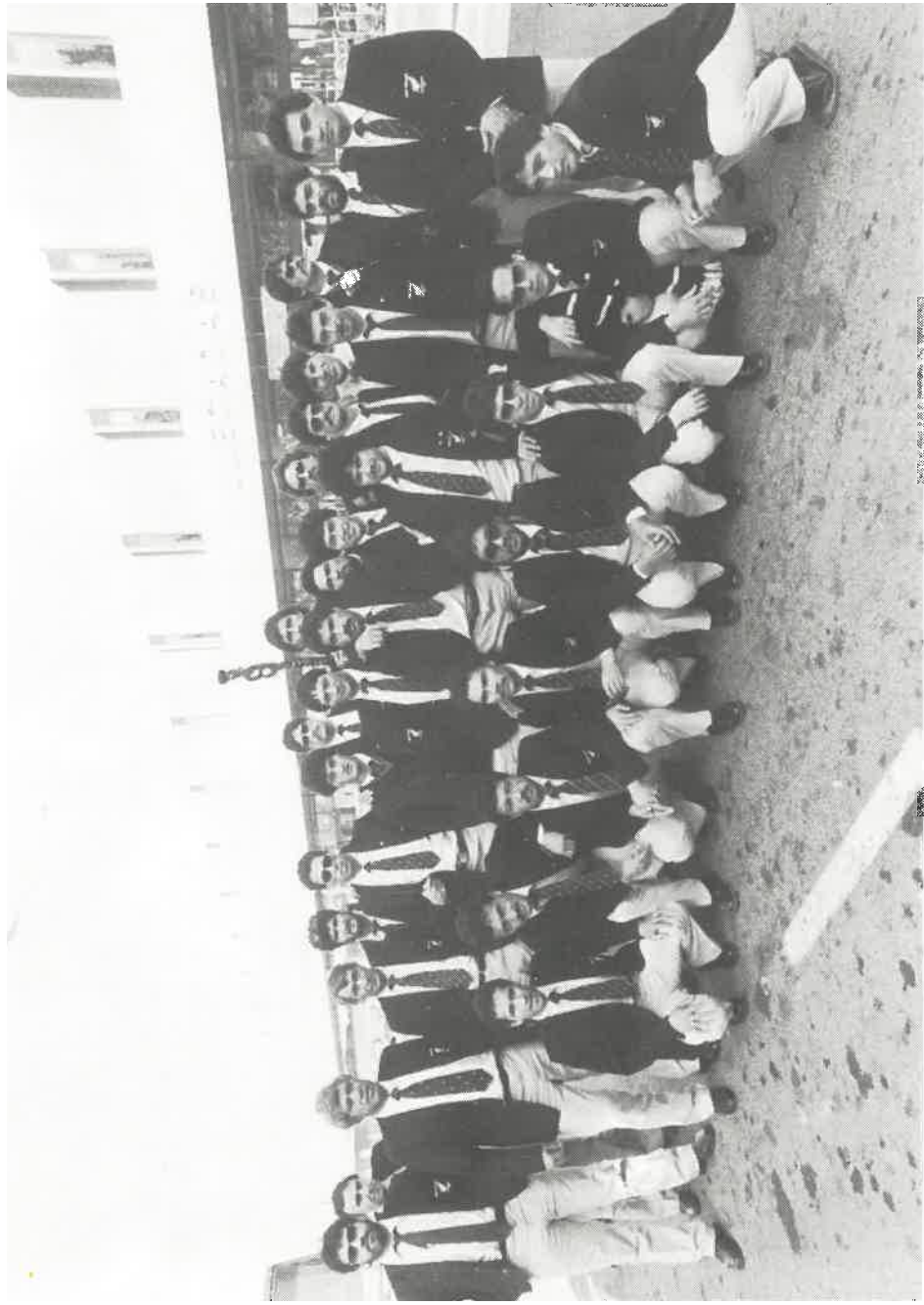
Selección Maorí de gira por España. Noviembre 1982.