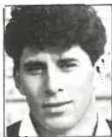
Club Wellington Ala 1,85m - 81kg 20 años