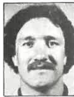
Club King contra Pilier 1,90m - 104kg 21 años