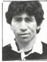
Club N.Auckland Apertura 1,70m - 69kg 27 años