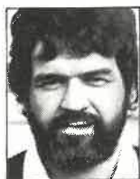
Club Canterbury Pilier 1,87m - 106kg 32 años