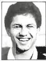
Club Canterbury Ala/centro 1,77m - 82kg 21 años