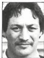
Club Waikato 3a. ala 1,86m - 102kg 27 años