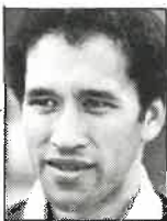
Club Southland 2o. centro 1,75m - 69kg 23 años