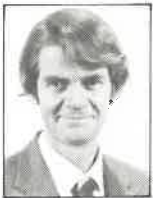
Club Auckland Fisioterapeuta