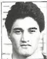
Club Wairarapa 3a. ala/8 1,87m - 92kg 22 años