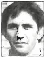
Club Waikato 2a. línea 2m - 100kg 28 años