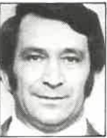
Club N.Auckland Entrenador