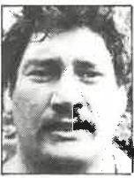
Club Counties 2a. línea 1,95m - 126kg 25 años