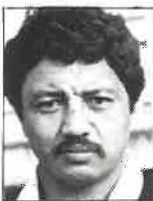
Club Taranaki Talonador 1,77m - 92kg 31 años