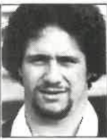
Club Waikato 1o./2o. centro 1,80m - 81kg 21 años