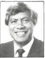
Club Auckland Manager