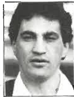
Club Wellington 3a. ala 1,80m - 93kg 28 años