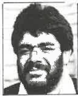
Club Wellington Pilier 1,82m - 109kg 26 años