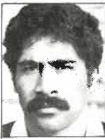
Club Bay of Plenty 3a. ala 1,80m - 85kg 27 años