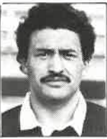
Club Wellington 1o.centro 1,66m - 69kg 26 años