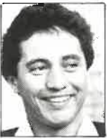
Club Hawke's Bay Medio melé 1,64m - 70kg 24 años