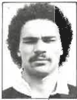
Club N.Auckland Ala 1,80m - 79kg 22 años