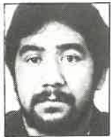
Club Manawatu Talonador 1,77m - 86kg 24 años