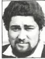
Club Waikato Pilier 1,85m - 101kg 25 años