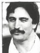
Club Counties Ala 1,77m - 88kg 24 años