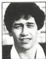
Club Auckland Medio melé 1,77m - 78kg 25 años