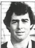
Club Counties Zaguero 1,77m - 80kg 25 años