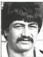
Club Marlborough 2a. línea/8 1,94m - 98kg 29 años