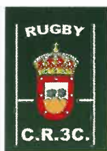
C.R. Tres Cantos