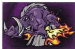
Guadalajara Rugby XV