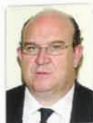
D. Alfonso Mandado Presidente de la Federación Española de Rugby

España acoge la mayor competición rugbística de jóvenes jugadores del mundo.