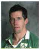
Guy Easterby 36 años Medio Melé Leinster & Irlanda 182 cm. 86 Kg. - CAPS