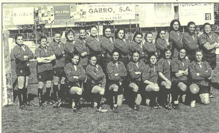
Selección Española femenina ante Francia. Sant Boi de Llobregat. 19/03/05