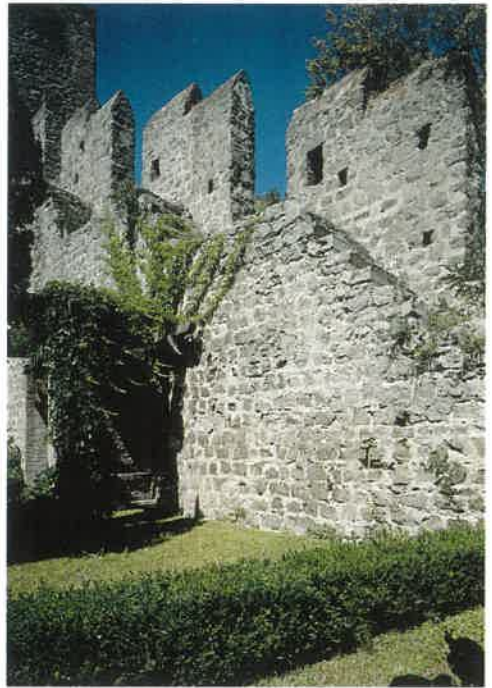
Le mura medievali di Monselice

Dal lago termale di Lospida viene estratta la maggior parte del fango utilizzato nelle vicine stazioni termali.