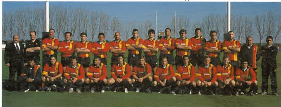
Selección española contra Rumania. Campeonato de Europa. 2ª jornada. Sevilla, 18 de febrero de 2001.