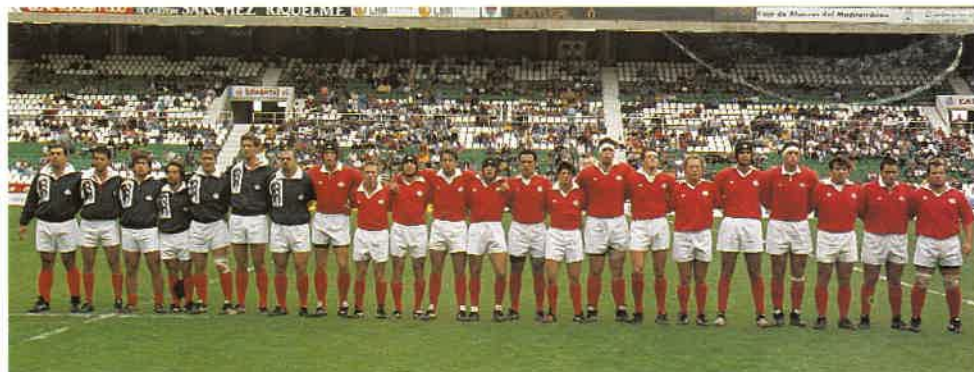
Selección de Portugal ante España. Clasificación Copa del Mundo, Gales 1999 Elche (Alicante), 10 de mayo de 1998.