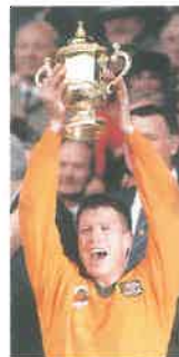
Nick Farr Jones, con la Copa del Mundo en el mundial de Gales 1991