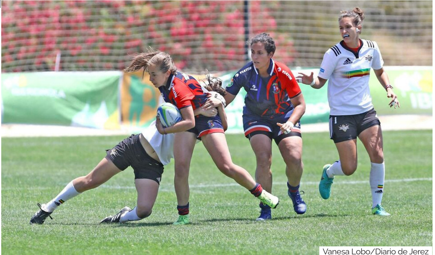
Vanessa Lobo/Diario de Jerez

La primera de las dos series en la Copa de la Reina 7s Iberdrola 2021, programada para el 19 y 20 de junio en el Estadio Universitario de Elviña (A Coruña), ya conoce la composición de sus tres grupos, donde el CR Majadahonda, actual campeón, el CRAT Residencia Rialta y el XV Hortaleza RC parten como cabezas de serie, al haber acabado en el podio en 2019, último año en que se jugó la competición.