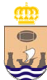
CR La Vila