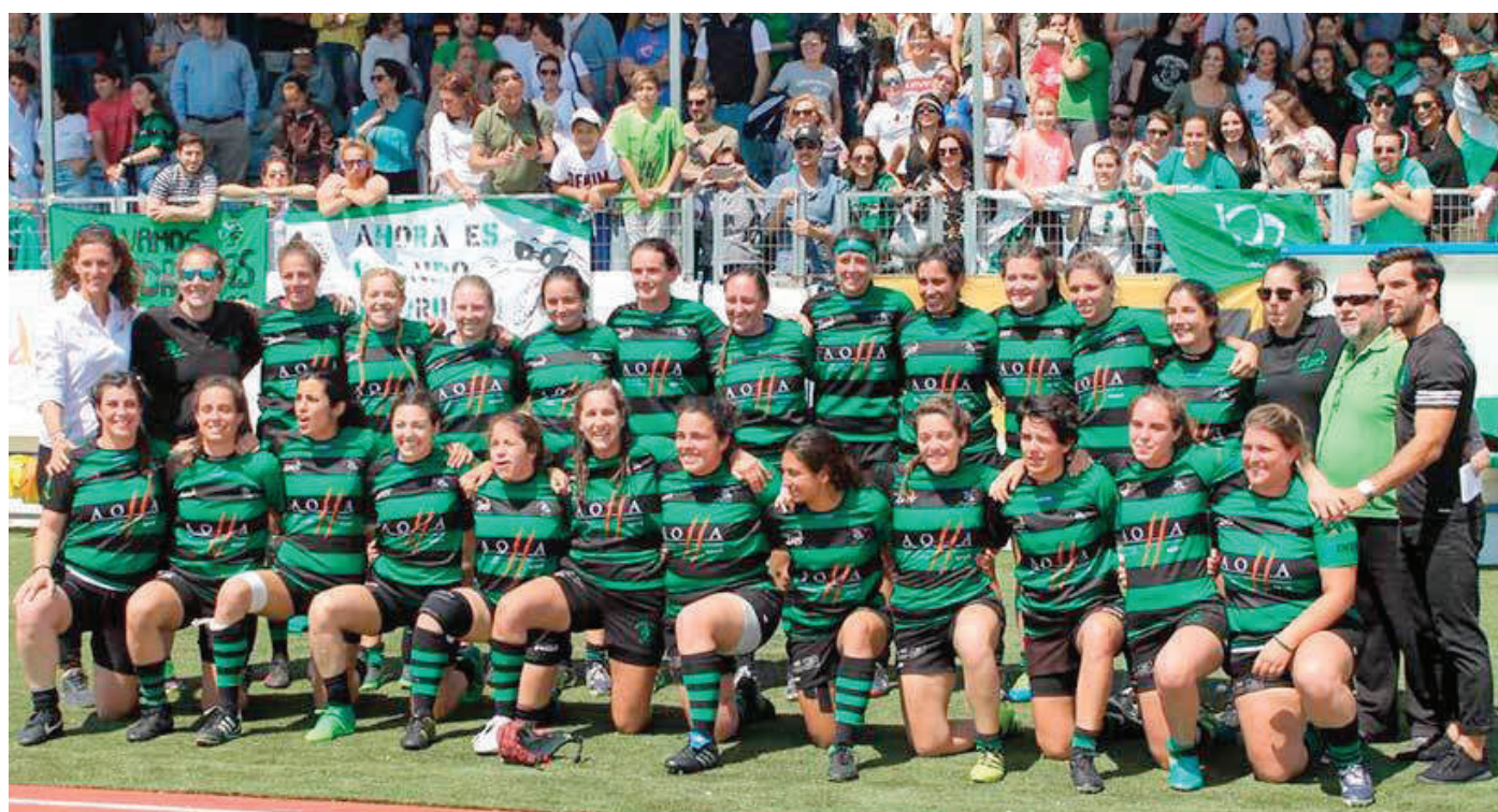
UAS Universitario de Sevilla

El 13 de mayo, el Aparejadores de Burgos logró el ascenso a la Liga Heineken por primera vez en su historia tras una contundente victoria (33-22) ante el Ciencias de Sevilla. A pesar de que los burgaleses llegaron a San Amaro con sólo dos puntos de ventaja, remataron una histórica eliminatoria ante su afición tras disputar su segunda final consecutiva por una plaza en la máxima categoría. El equipo andaluz se jugó la plaza restante frente al penúltimo clasificado de la Liga de División de Honor, el Hernani, que mantuvo la categoría. Por otra parte, el 27 de mayo, el UAS Universitario de Sevilla, más conocido por el sobrenombre de Cocodrilas, ascendió a la máxima categoría del rugby femenino español tras ganar en Badajoz 5-11 a El Salvador. Las sevillanas también son debutantes, en su caso en la Liga Iberdrola.