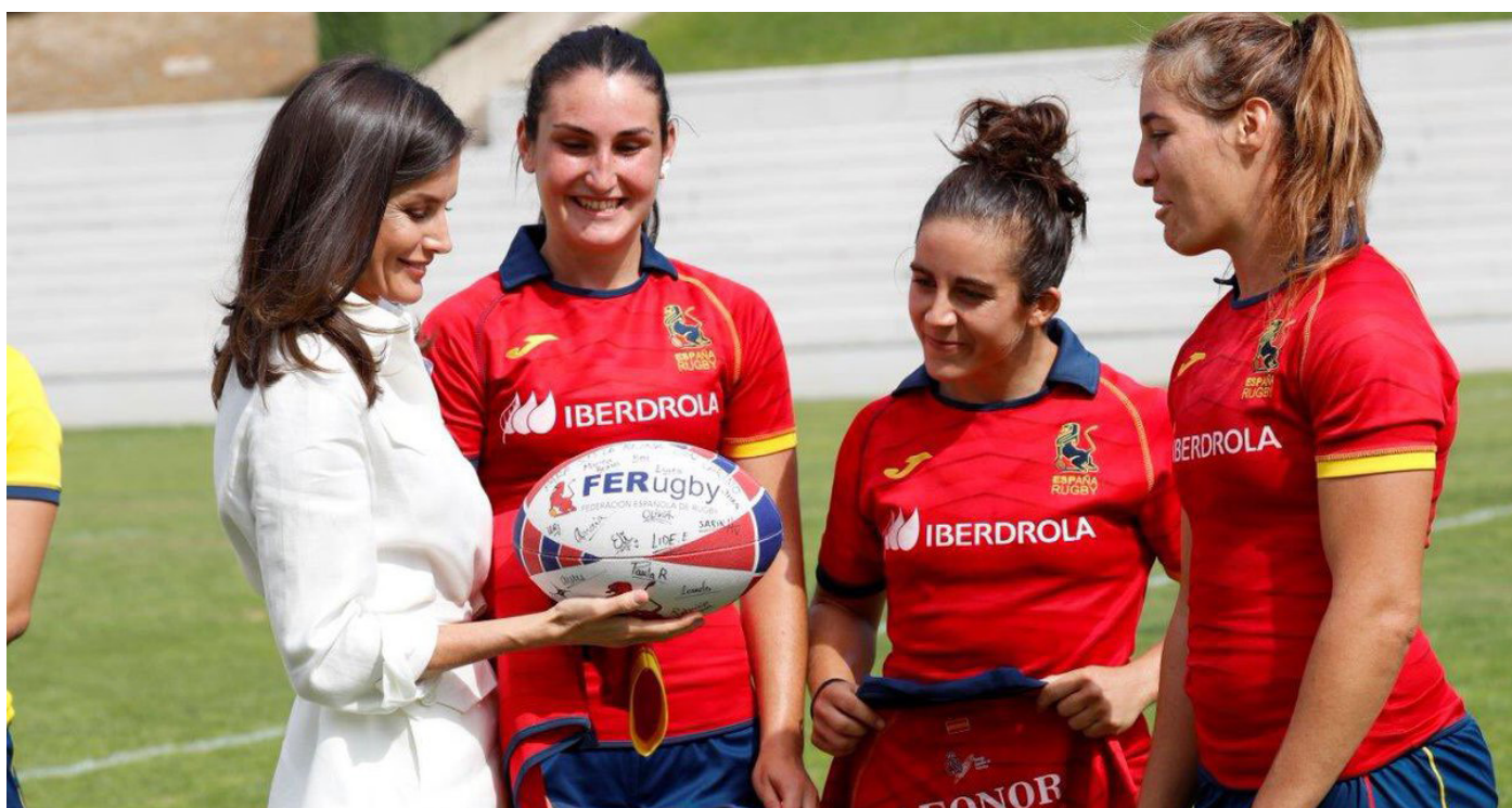
Casa de S.M. El Rey