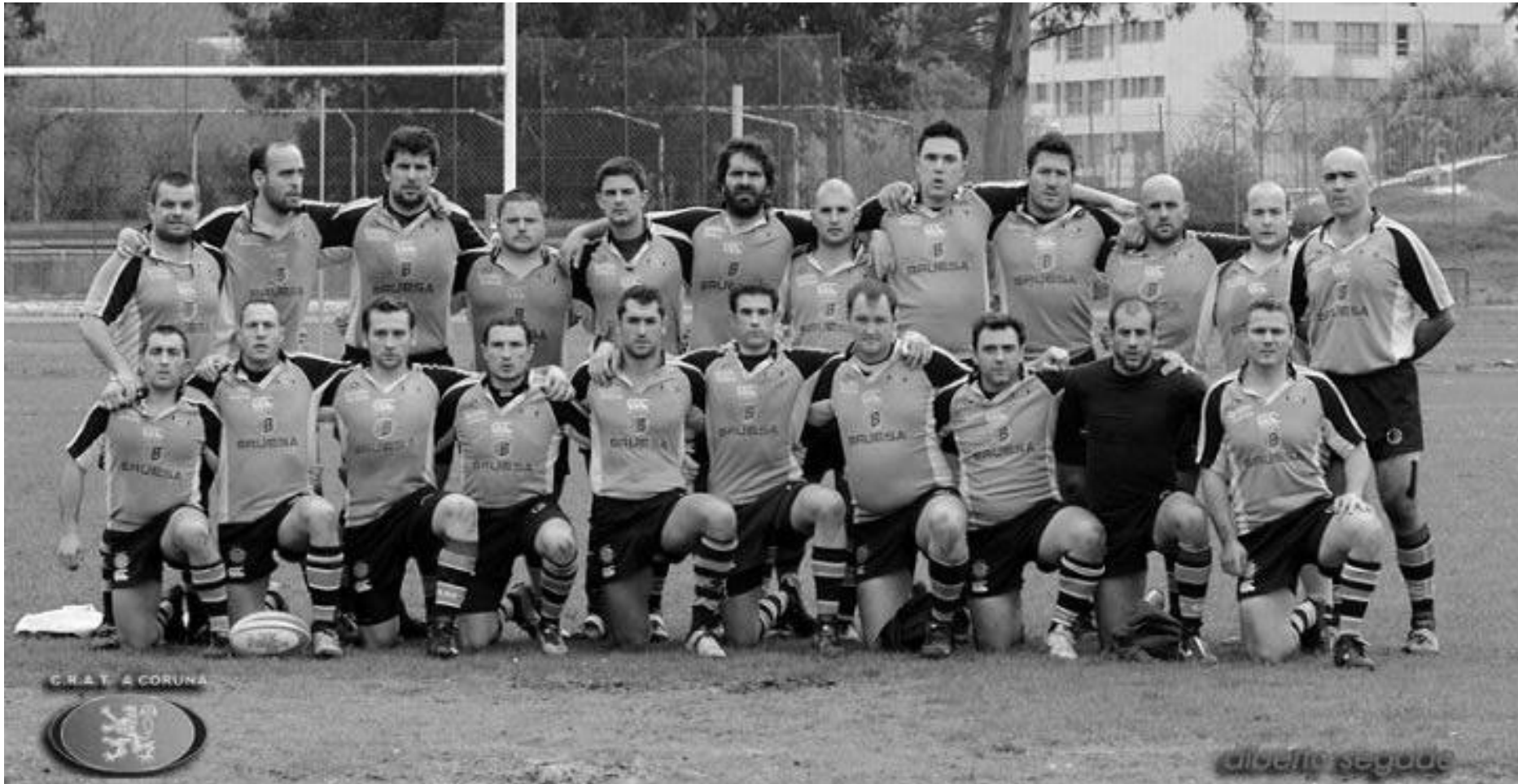
CRAT A Coruña