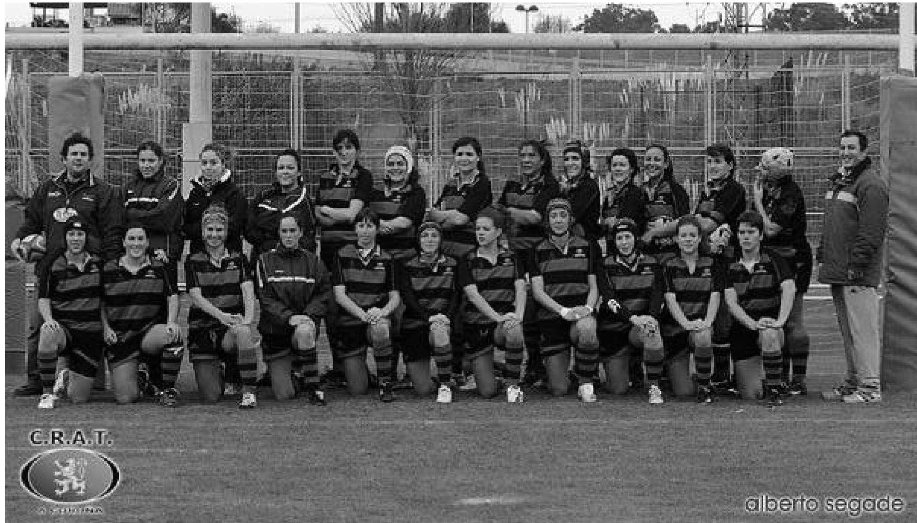
CRAT Universidade da Coruña feminino