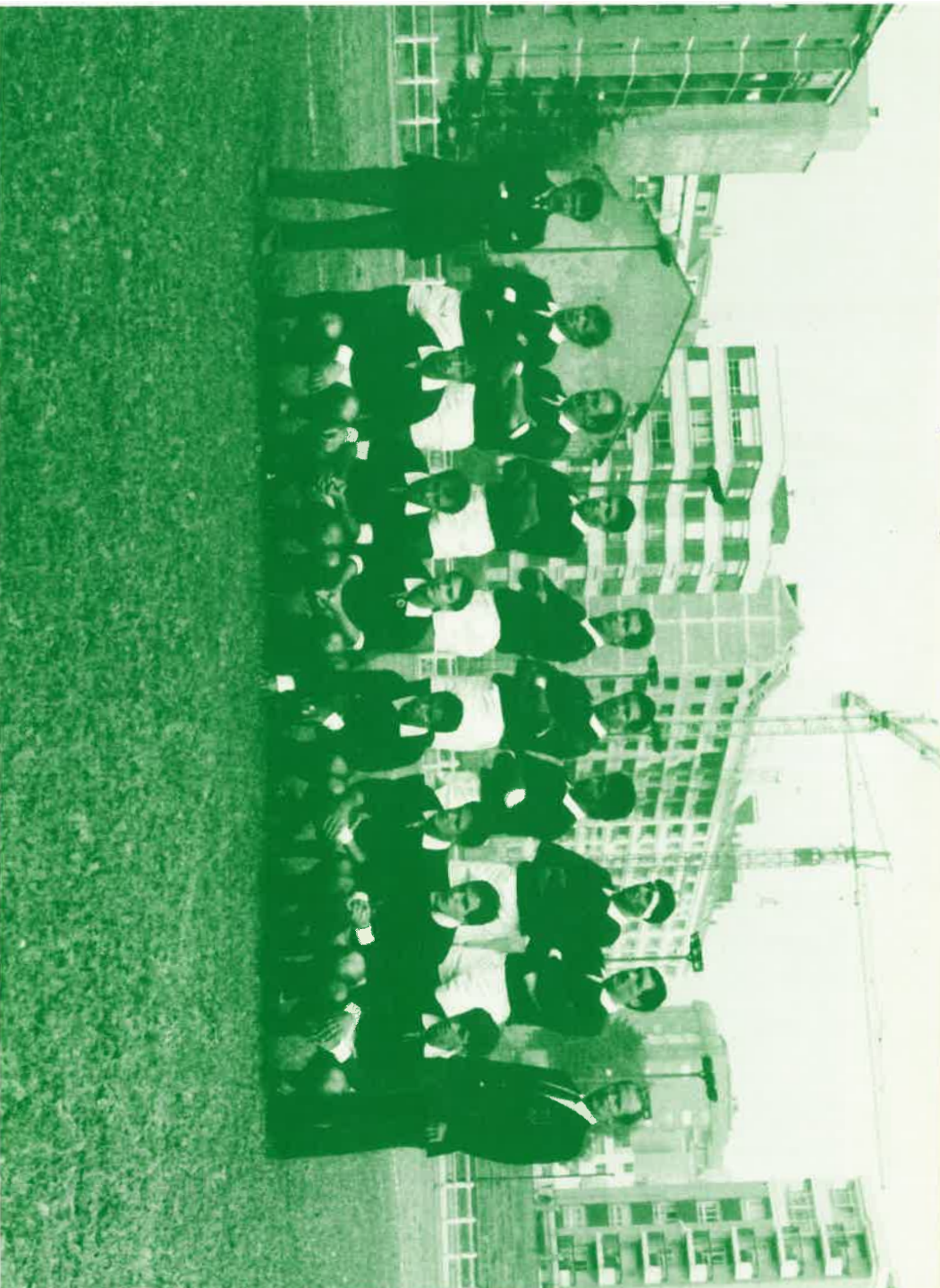
Combinado español contra Zimbabue. Oviedo 18-9-1985.