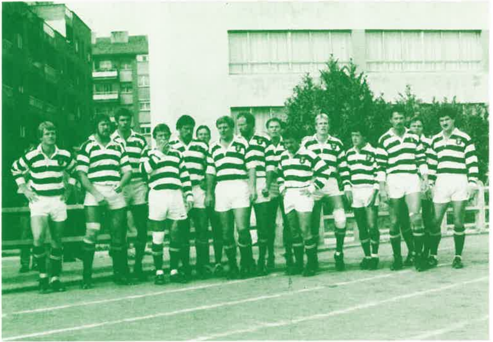
Selección de Zimbabwe. Oviedo 18-9-85.

un Combinado Inter Provincial de Zimbabwe ganó al Junior Springboks.