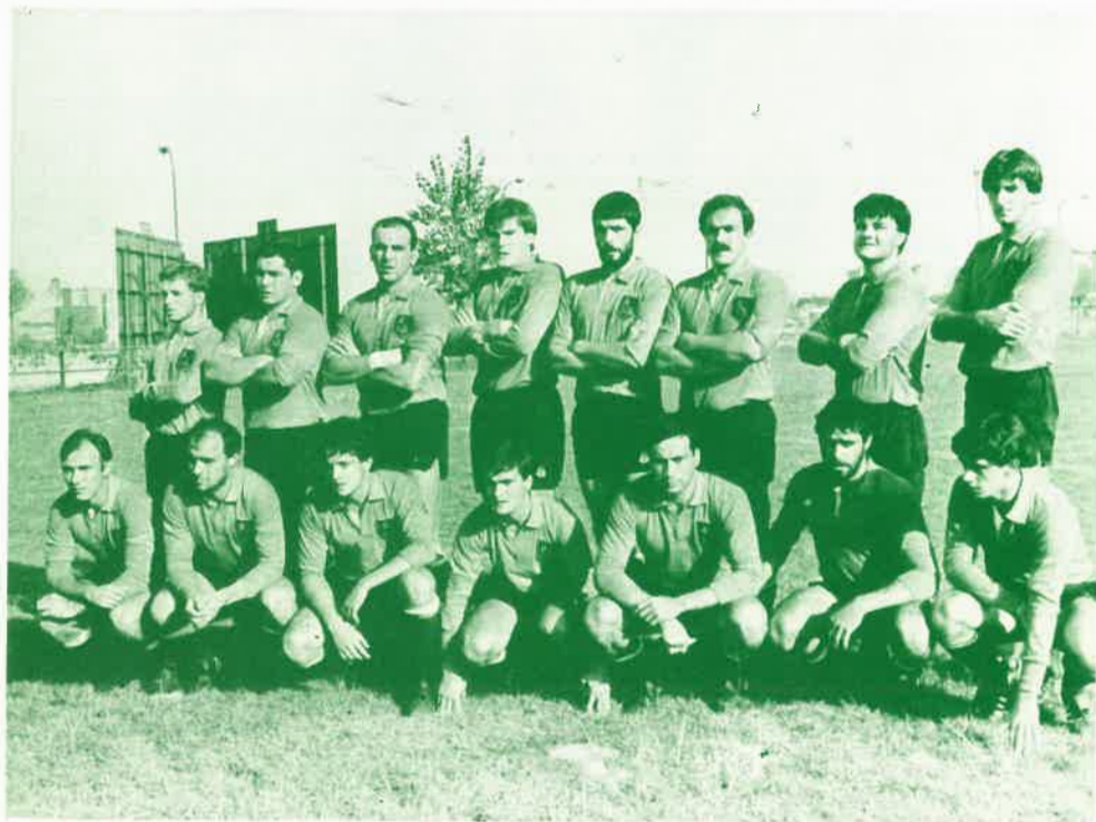
Selección española. España-Zimbabwe 3-9-83.