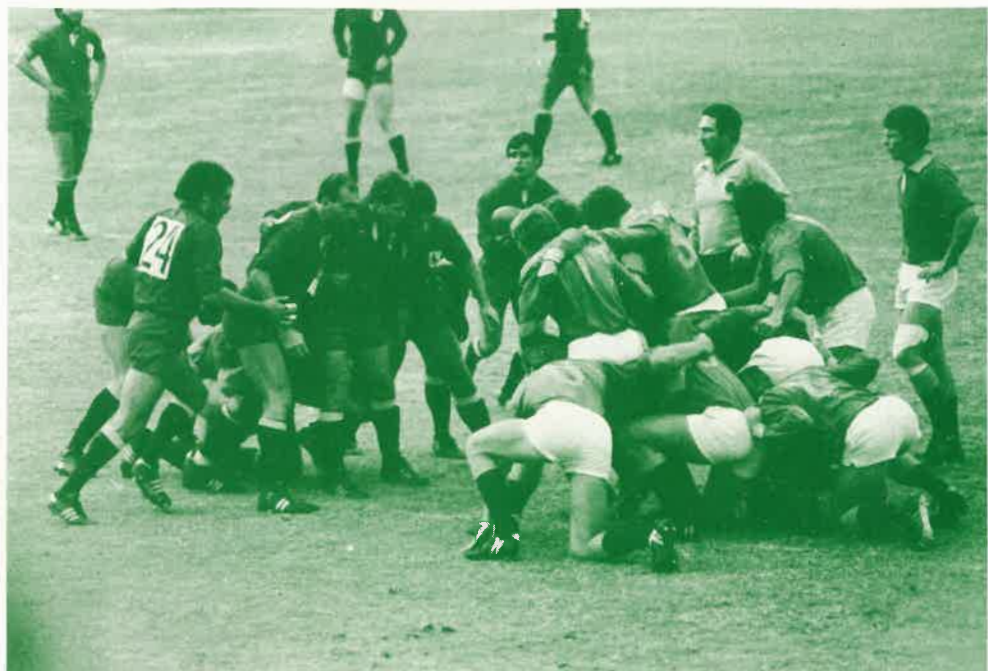
España–Mashonalans. Gira a Zimbabwe 1984.