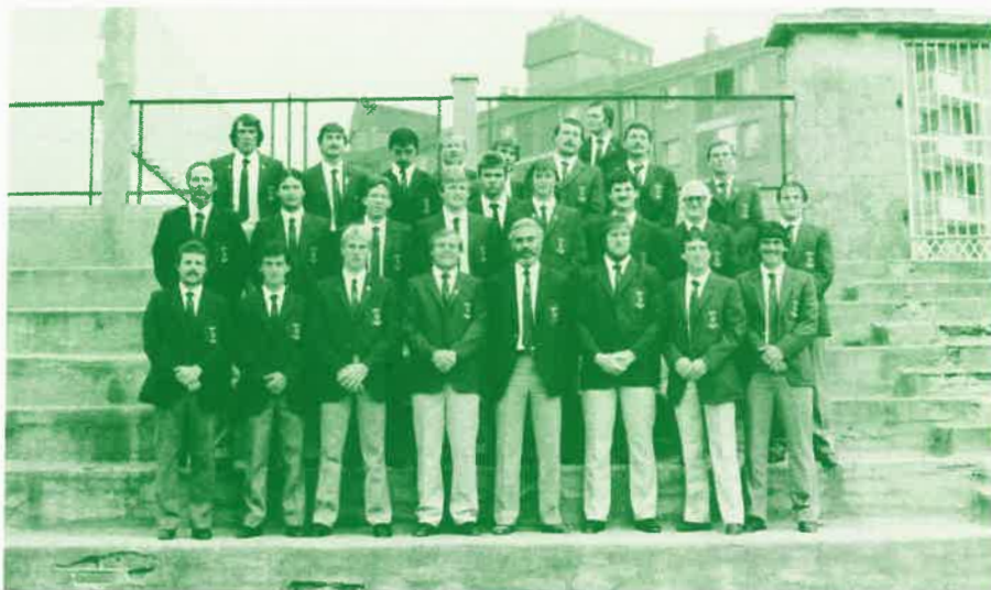
Selección de Zimbabwe. Gira por España. Septiembre 1985.