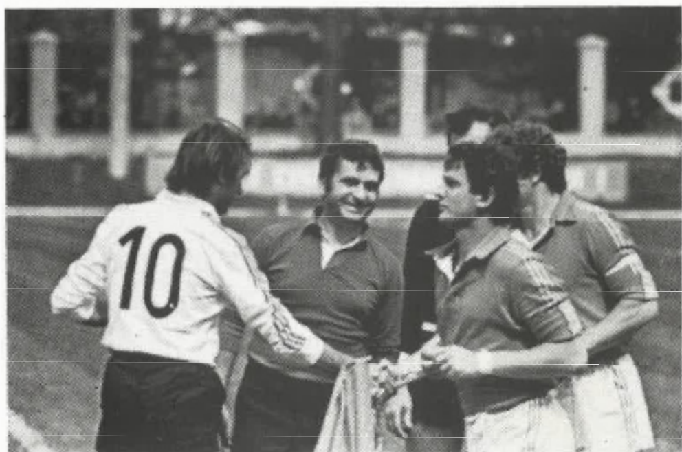
U.R.S.S. - España, 10 de mayo de 1981 en Kiev.