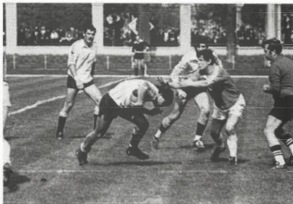
U.R.S.S. - España, 10 de mayo de 1981 en Kiev.