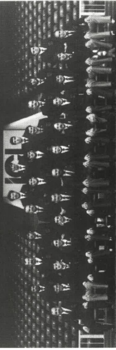
Selección española. Gira a Gales, abril de 1985.