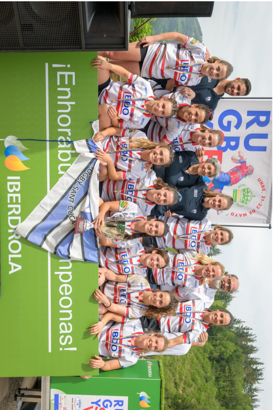
El equipo sénior femenino del Club de Rugby Sant Cugat, campeón de la Copa de .S.M. la Reina 7s 2021-22, celebra la victoria global en las tres series de la competición, tras obtener el 2º puesto en el último torneo, disputado en Eibar (Guipúzcoa), del 21 al 22 de mayo de 2022.