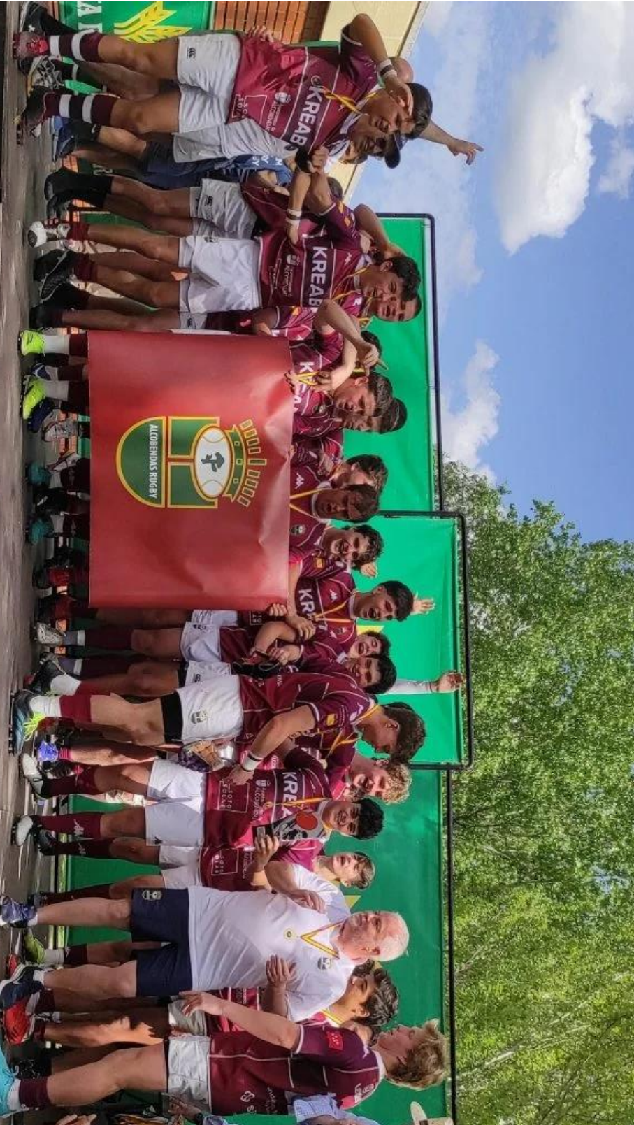
El equipo M18 masculino del Club Alcobendas Rugby recibe el trofeo de campeones del Campeonato de España M18 2022, disputado en Valladolid, del 30 de abril al 1 de mayo de 2022.