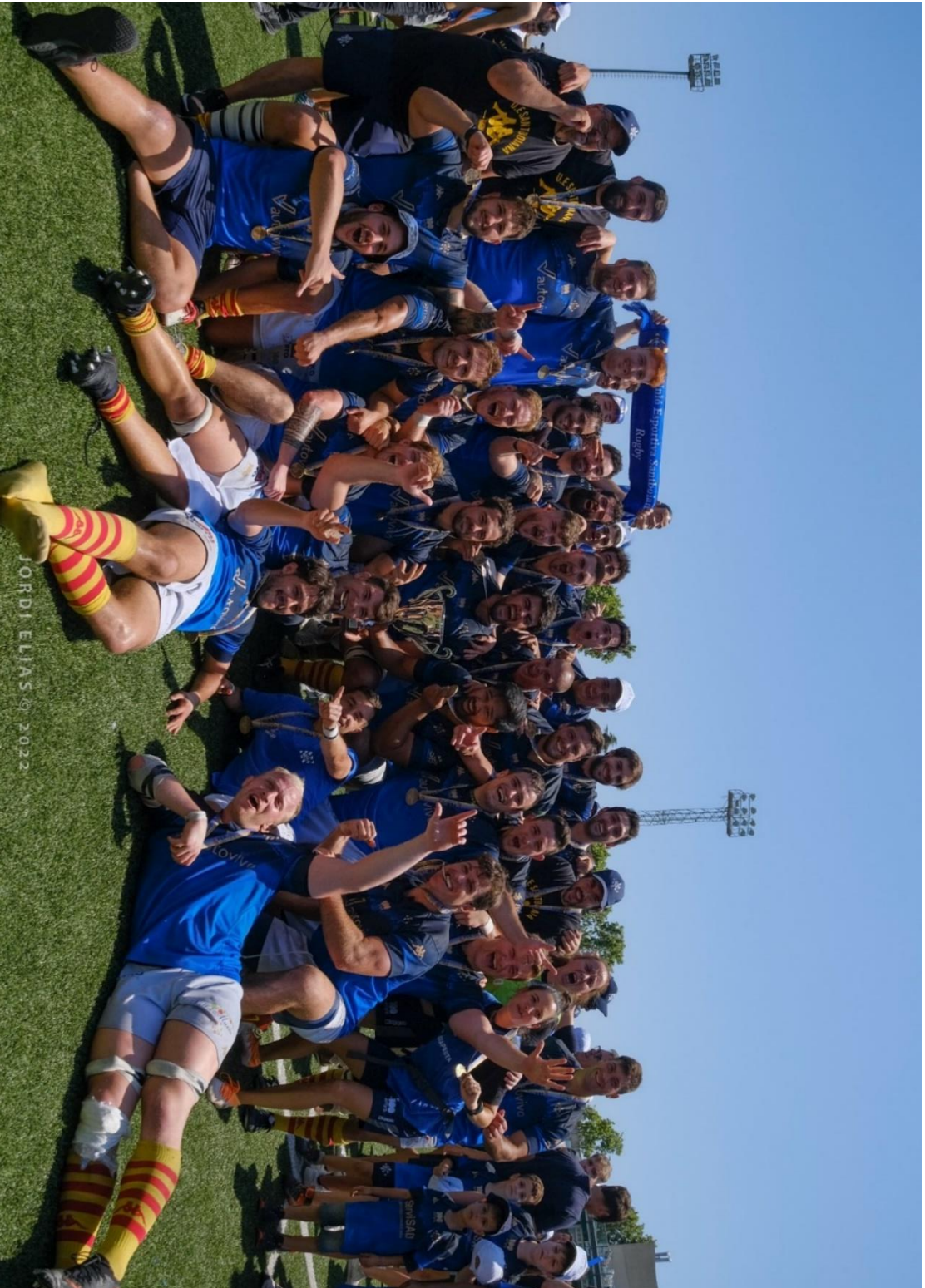
El equipo sénior masculino de la Unió Esportiva Santboiana, campeón de la Liga de División de Honor 2021-22, celebra la victoria por 23-17 en la final ante el Ordizia R.E., disputada en el Estadi Baldiri Aleu (Sant Boi de Llobregat, Barcelona), el 5 de junio de 2022. || Fotografía: Jordi Elias