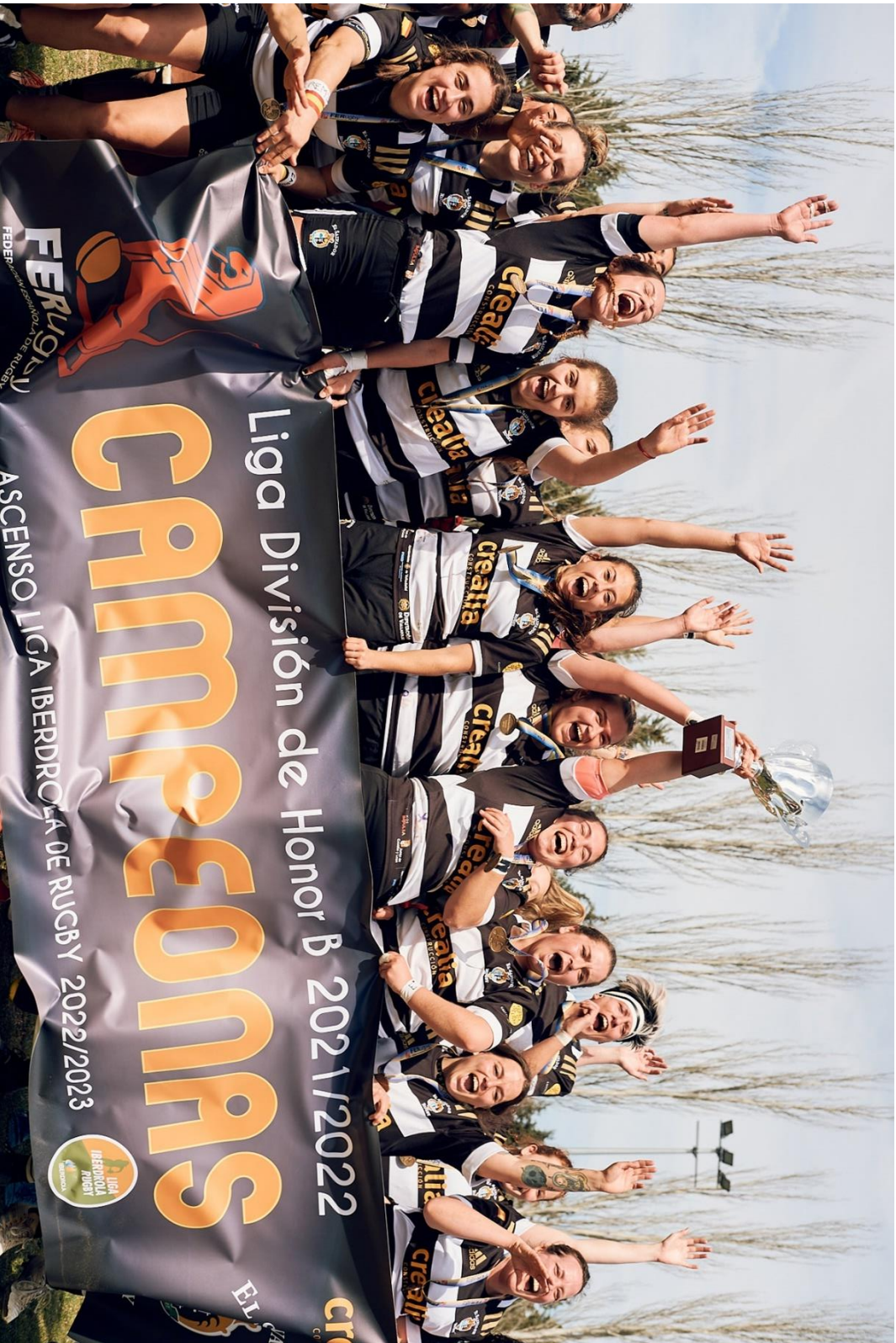
El equipo sénior femenino del Club de Rugby El Salvador, campeón de la Liga de División de Honor B 2021-22, recibe el trofeo y celebra el ascenso directo a División de Honor.