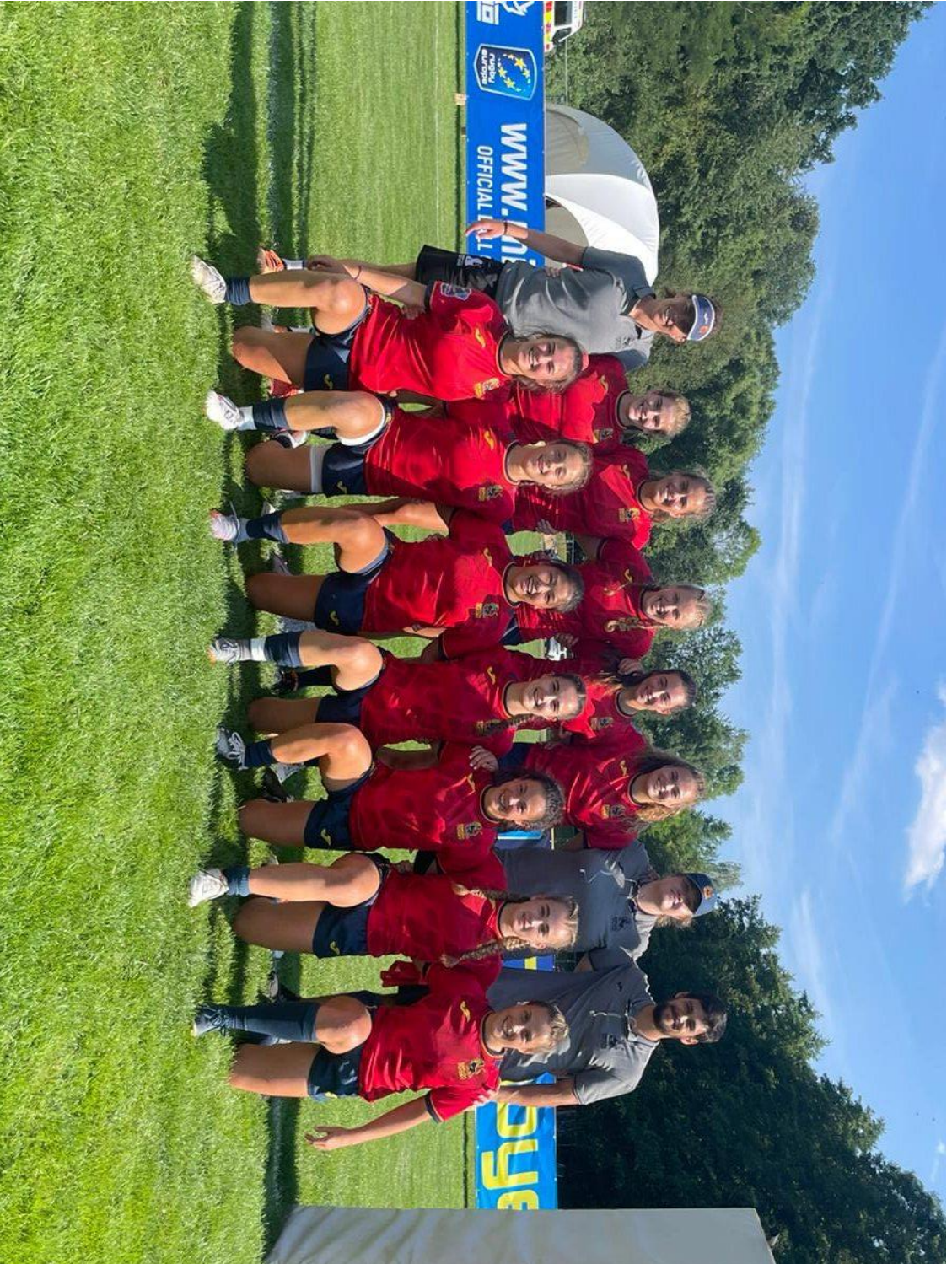
Selección española M18 femenina de rugby a 7, durante el Rugby Europe U18 Girls 7s Championship, celebrado en Praga (República Checa) del 23 al 24 de julio de 2022, donde se proclamaron subcampeonas de Europa.