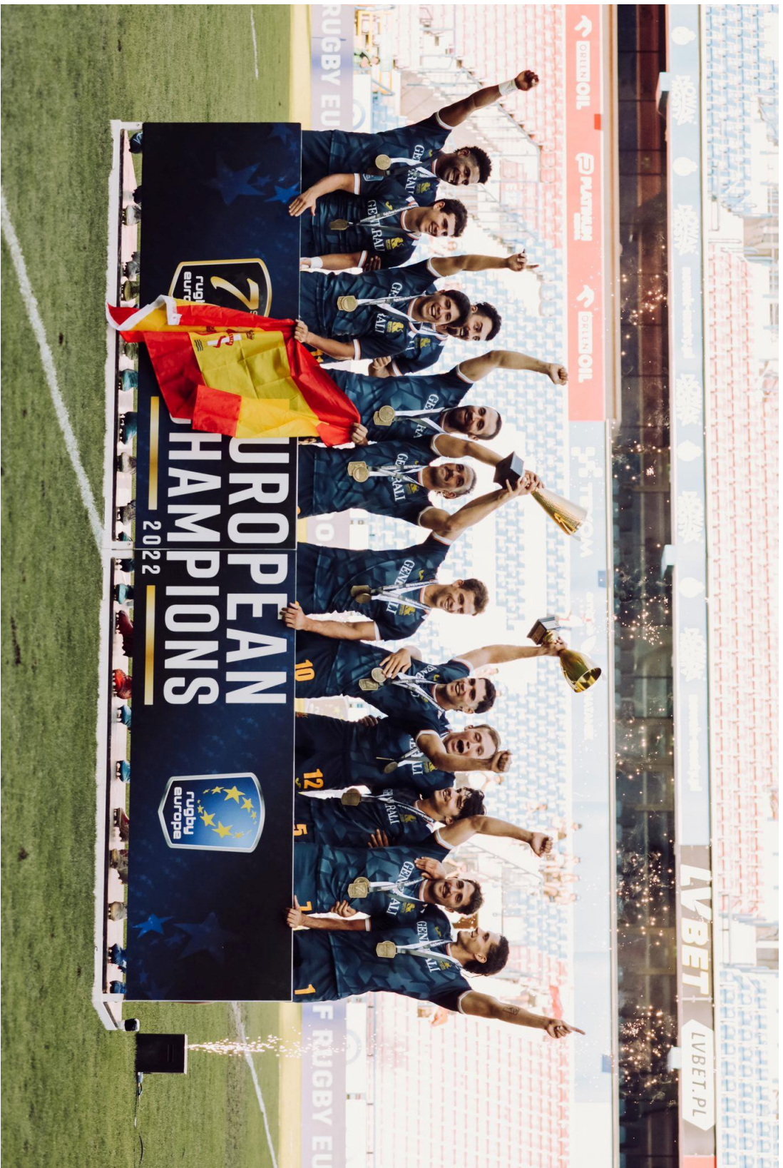
Selección española masculina de rugby a 7, recién proclamada campeona de Europa, tras la victoria por 29-7 ante Francia en la final del segundo y último torneo de las Rugby Europe 7s Championship Series, celebrado en Cracovia (Polonia) del 1 al 3 de julio de 2022, y tras obtener el 2º puesto en el primer torneo, celebrado en Lisboa (Portugal) del 25 al 26 de junio.