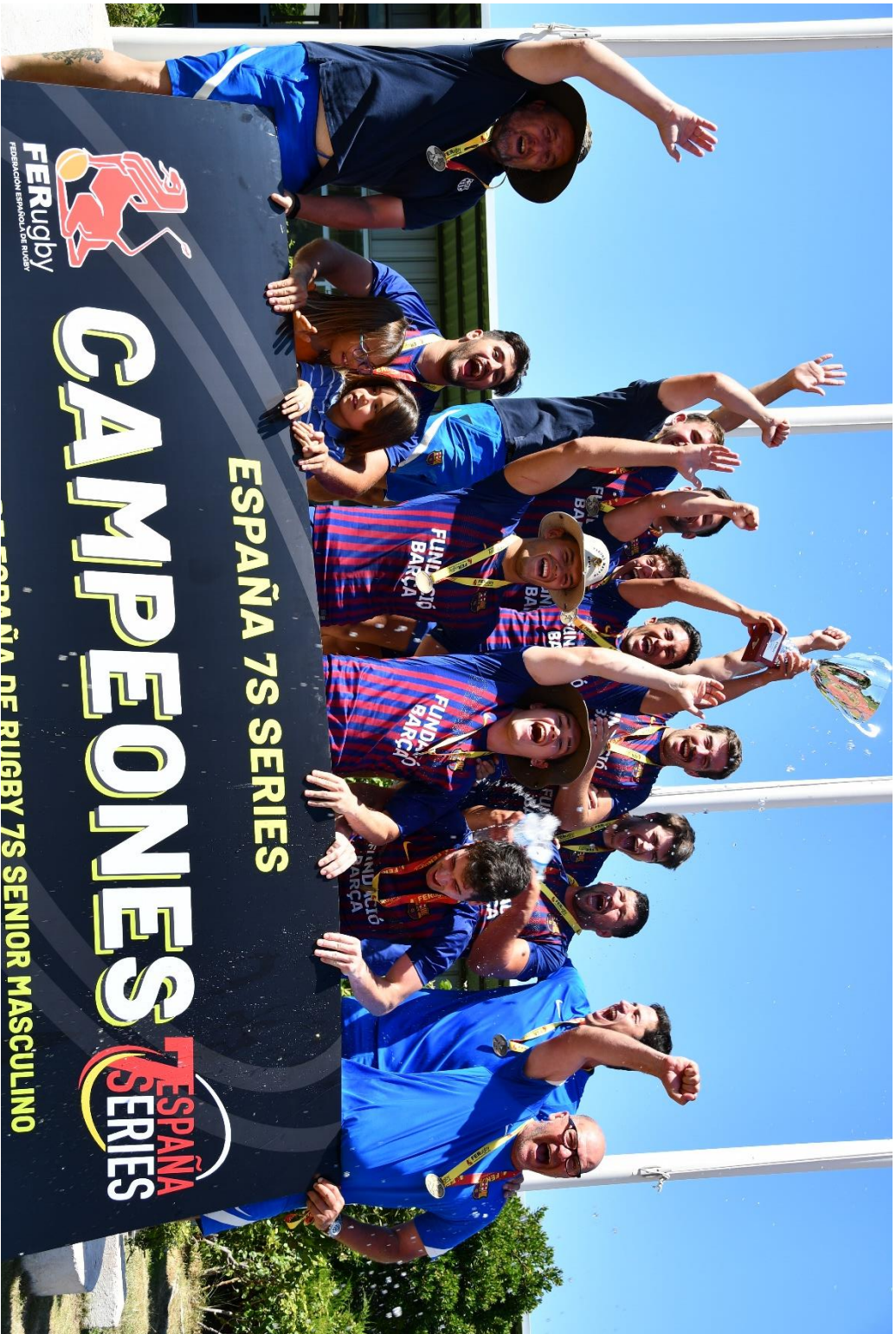
El equipo sénior masculino del Barça Rugby, campeón de las España 7s Series 2021-22 (Campeonato de España de Rugby a 7 en categoría masculina), recibe el trofeo tras la victoria por 12-26 ante el C.R. El Salvador en la final de la única serie disputada (tras la cancelación de la otra), en el Valle del Arcipreste, en Majadahonda (Comunidad de Madrid), del 25 al 26 de junio de 2022.