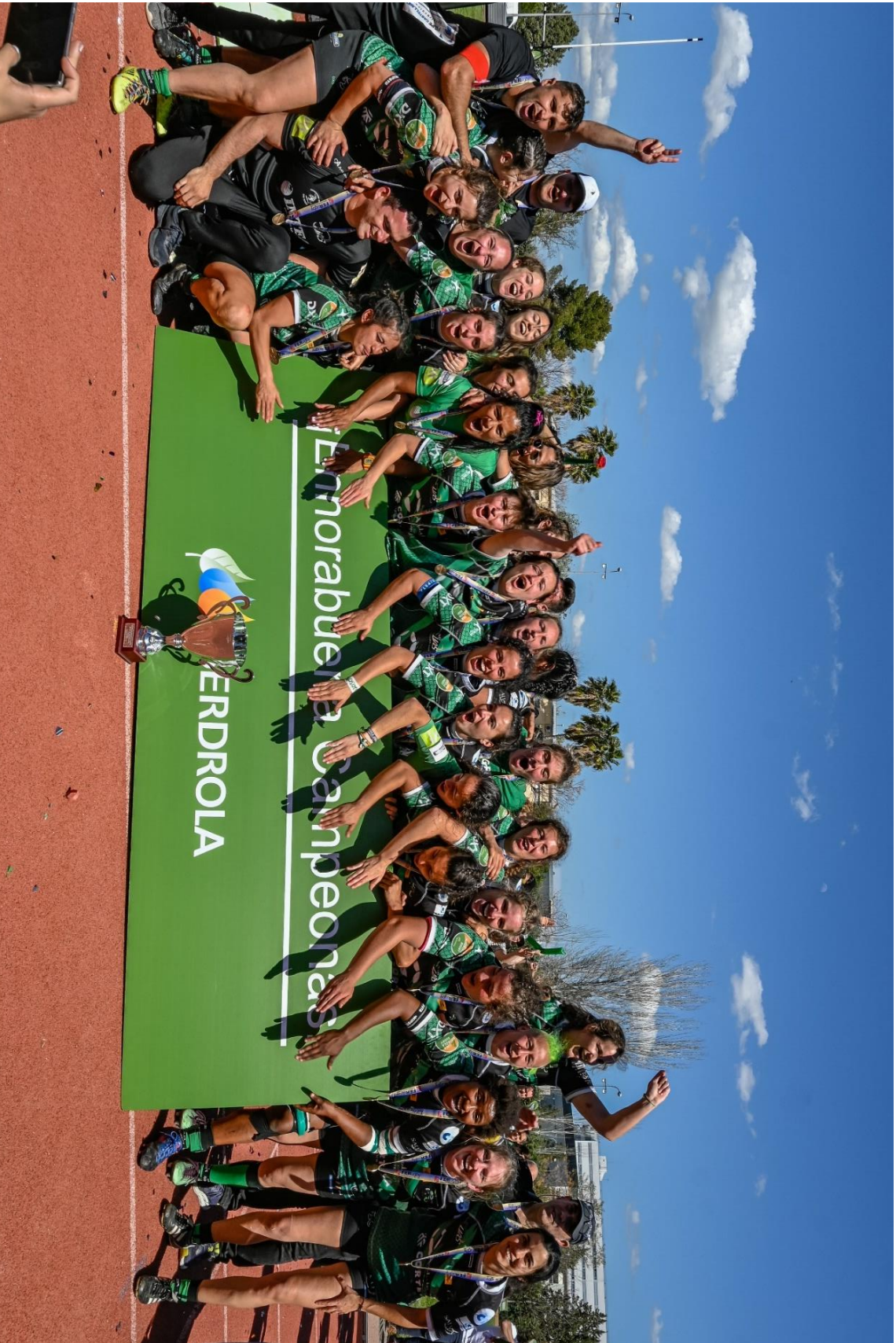
El equipo sénior femenino del U.A.S. Universitario de Sevilla Club de Rugby, campeón de la Liga de División de Honor 2021-22, celebra la victoria por 36-29 en la final ante el C.R. Majadahonda, disputada en el Complejo Deportivo El Cuartillo (Cáceres), el 10 de abril de 2022.