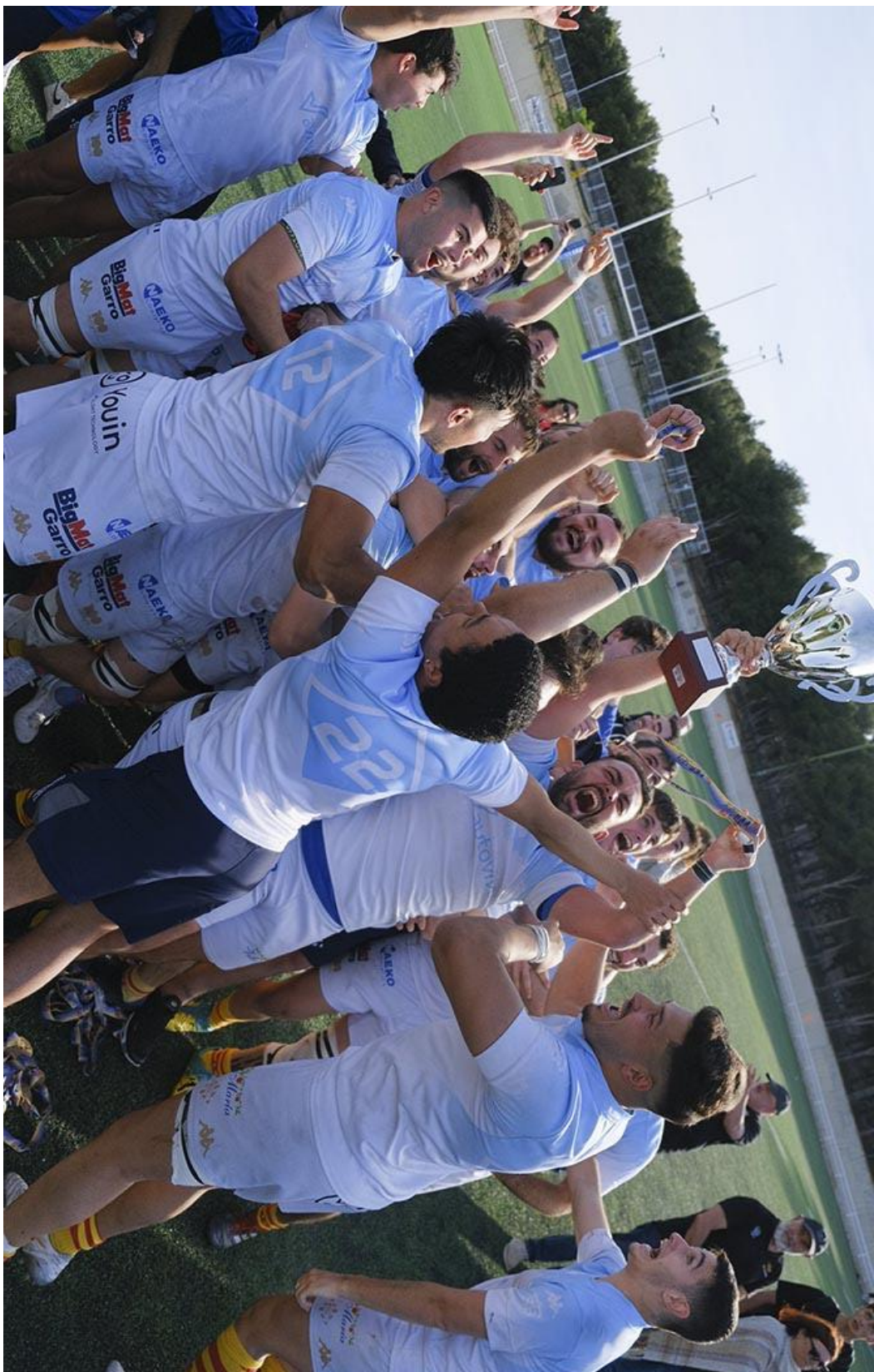
El equipo M23 masculino de la Unió Esportiva Santboiana, campeón de la Competición Nacional M23 2021-22, celebra la victoria por 8-20 en la final ante el C.P. Les Abelles, disputada en el C.D.M. David Cañada (Zaragoza), el 30 de abril de 2022.