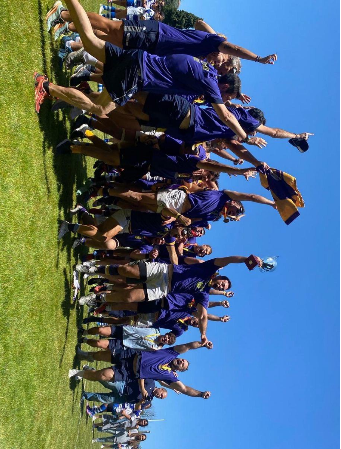
El equipo sénior masculino del Pozuelo Rugby Union, campeón de la Liga de División de Honor B 2021-22, celebra la victoria global en la final a doble partido de la Fase de Ascenso a División de Honor, tras perder el partido de vuelta por 34-19 (y ganar dos semanas antes el partido de ida por 40-13) ante el Belenos R.C., disputado el 29 de mayo de 2022.