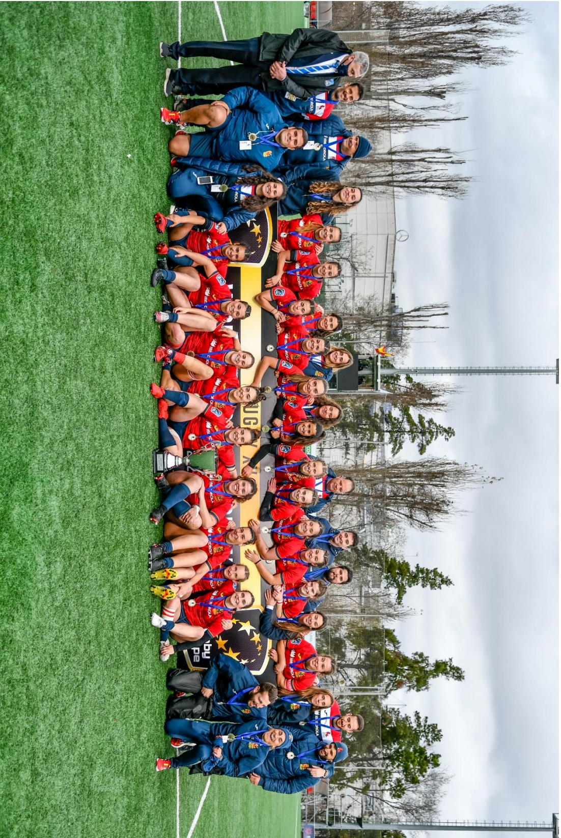
Selección española femenina de rugby XV, recién proclamada campeona de Europa, tras la victoria por 27-0 ante Rusia en el Campo de Rugby Las Terrazas (Alcobendas, Comunidad de Madrid), el 26 de febrero de 2022.