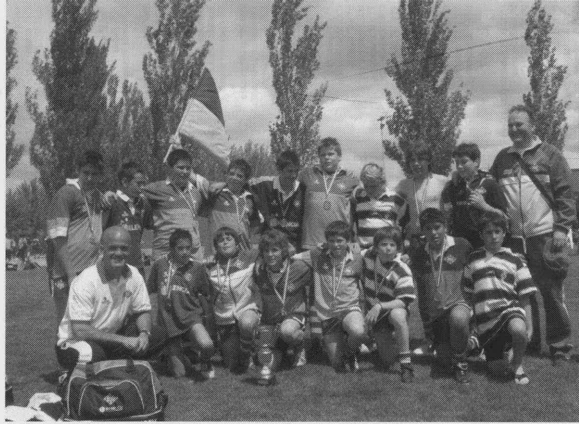
U.E Santboiana alevin Campeón de España alevin 2005