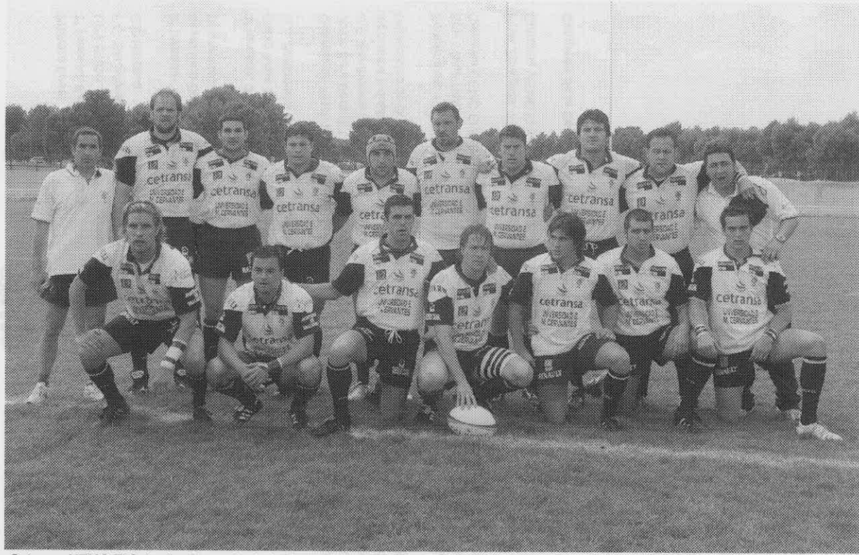
Cetransa UEMC El Salvador Campeón de la Copa de S.M. El Rey Zaragoza, 29 de mayo de 2005