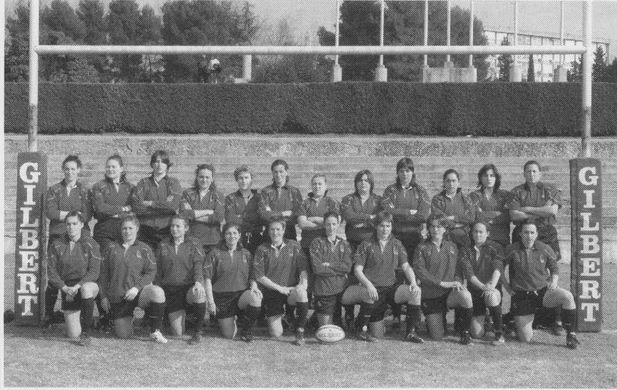
Selección española femenina ante Irlanda. Seis Naciones 2005 Madrid. 5 de febrero de 2005.