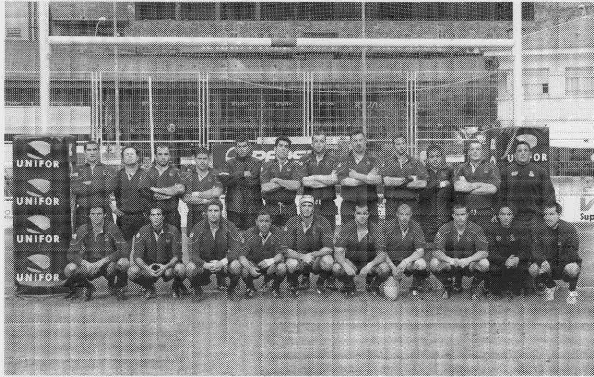
Selección española ante Andorra. Clasificación Copa del Mundo 2007 Andorra la Vella. 12 de febrero de 2005