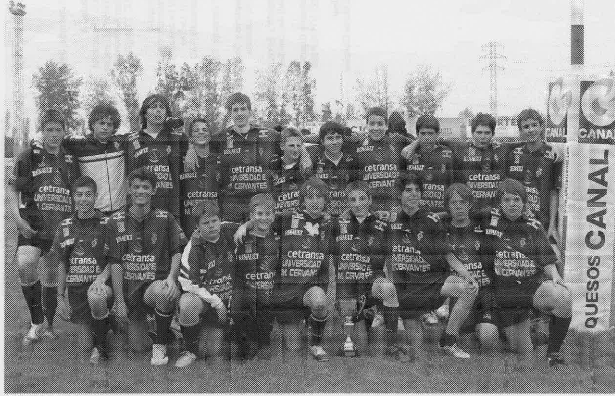
C.D. El Salvador Campeón del Torneo Nacional Infantil 2005