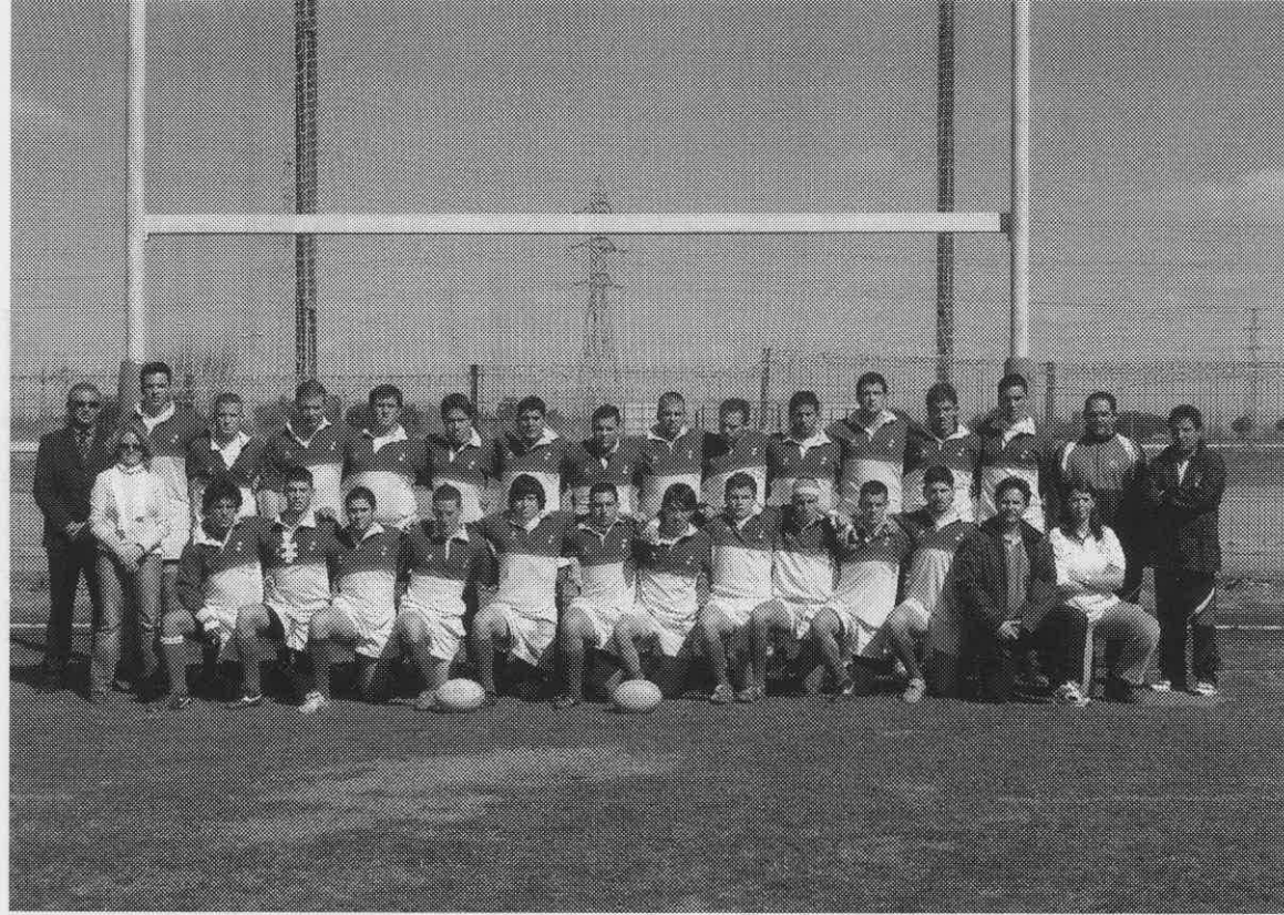
Selección andaluza juvenil Campeón de España de selecciones autonómicas juvenil 2005