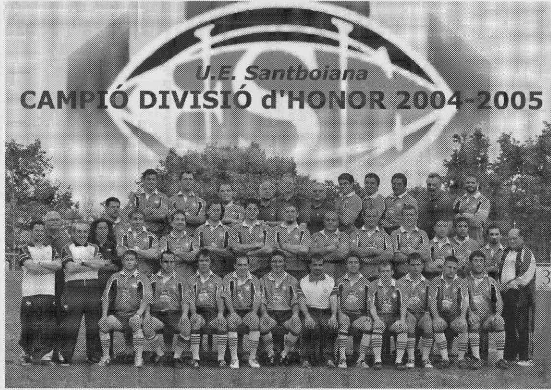
U.E. Santboiana Campeón de Liga de División de Honor 2004-2005