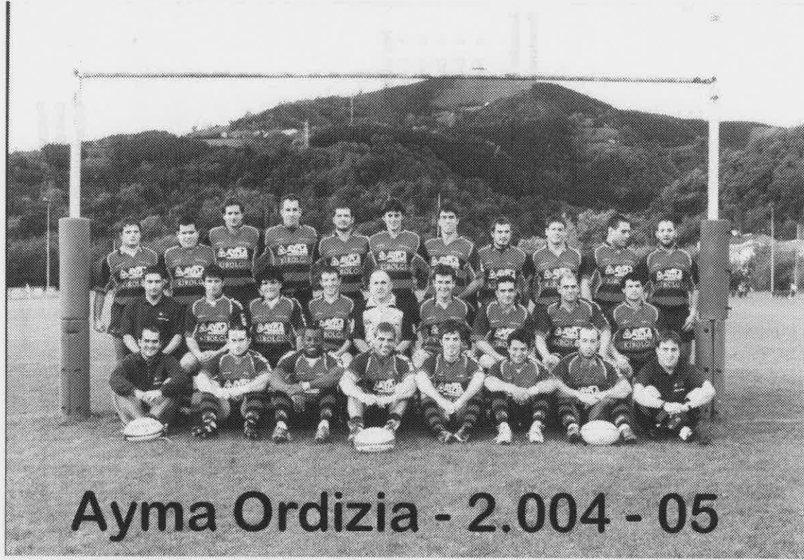
Ayma Ordizia R.E. Campeón de División de Honor B 2004-2005