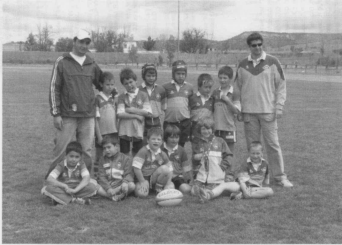
U.E. Santboiana benjamín Campeón de España benjamín 2005