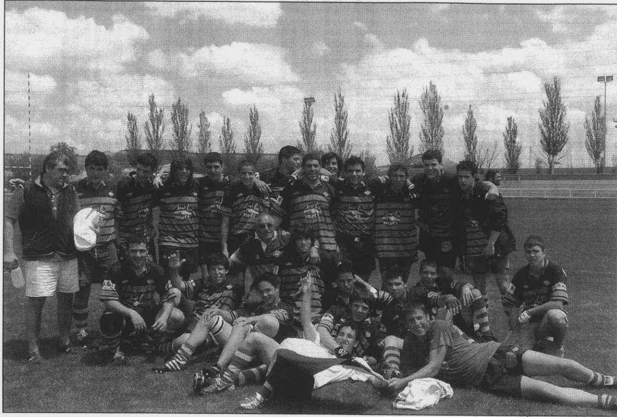
U.E. Santboiana Cadete Campeón de España Cadete