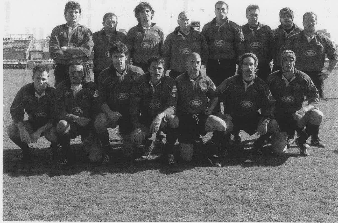
Selección Española contra Georgia. Copa de Europa de Naciones. Reus (Tarragona), 22 de febrero de 2004.