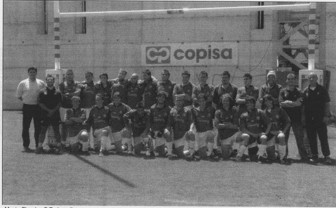
Monte Ciencias C.R. Juvenil Campeón de España Juvenil