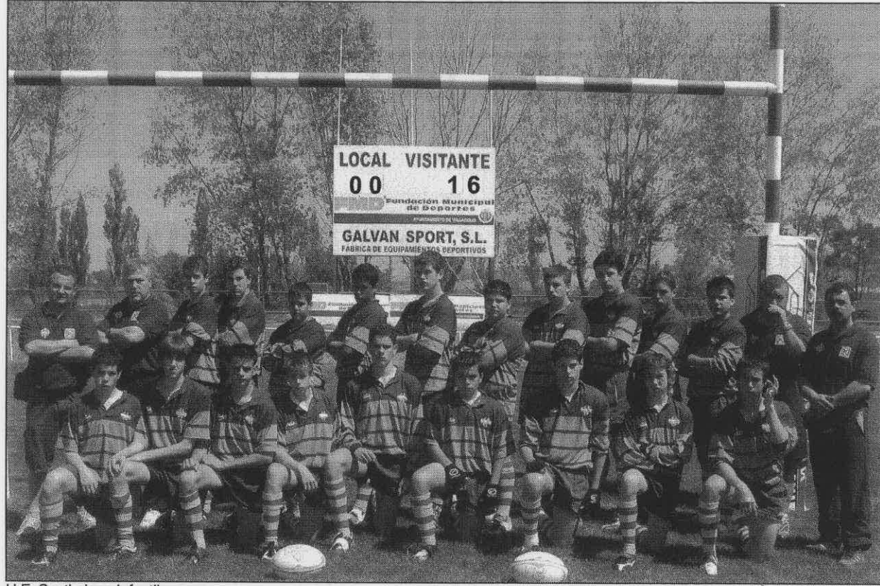
U.E. Santboiana Infantil Campeón de España Infantil