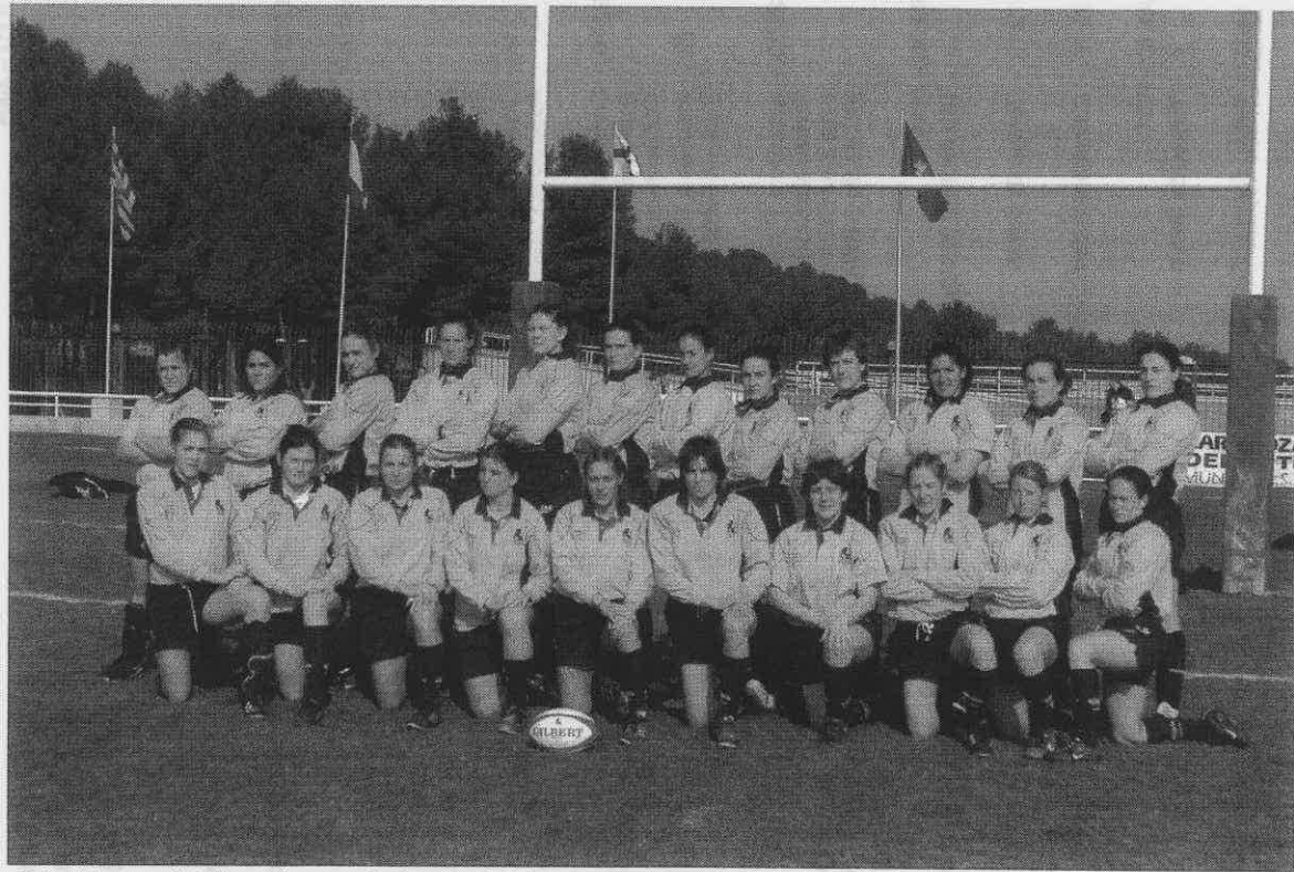
Selección española femenina ante Inglaterra. Seis Naciones 2004 Zaragoza. 14 de febrero de 2004.