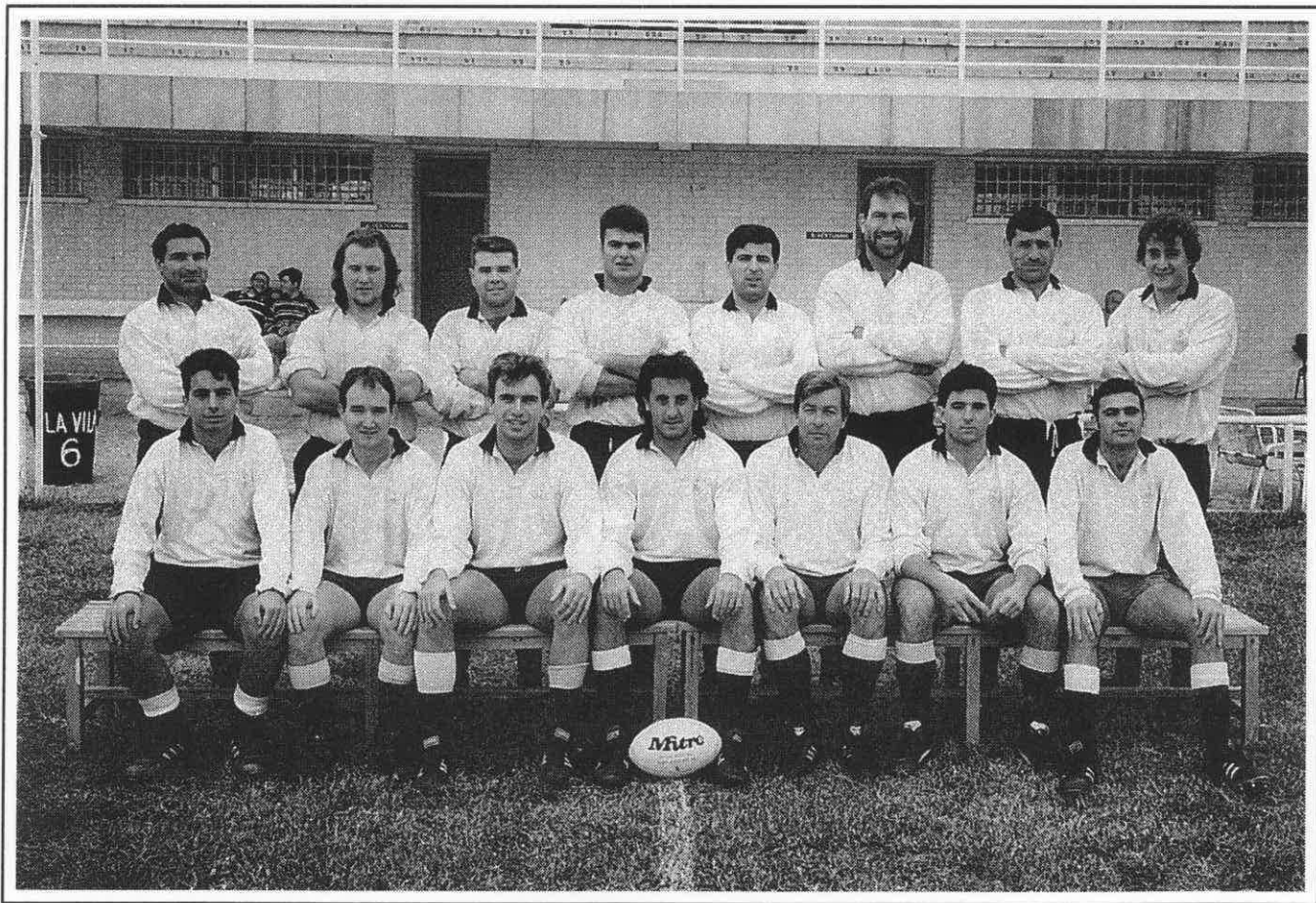
C.R. La Vila.