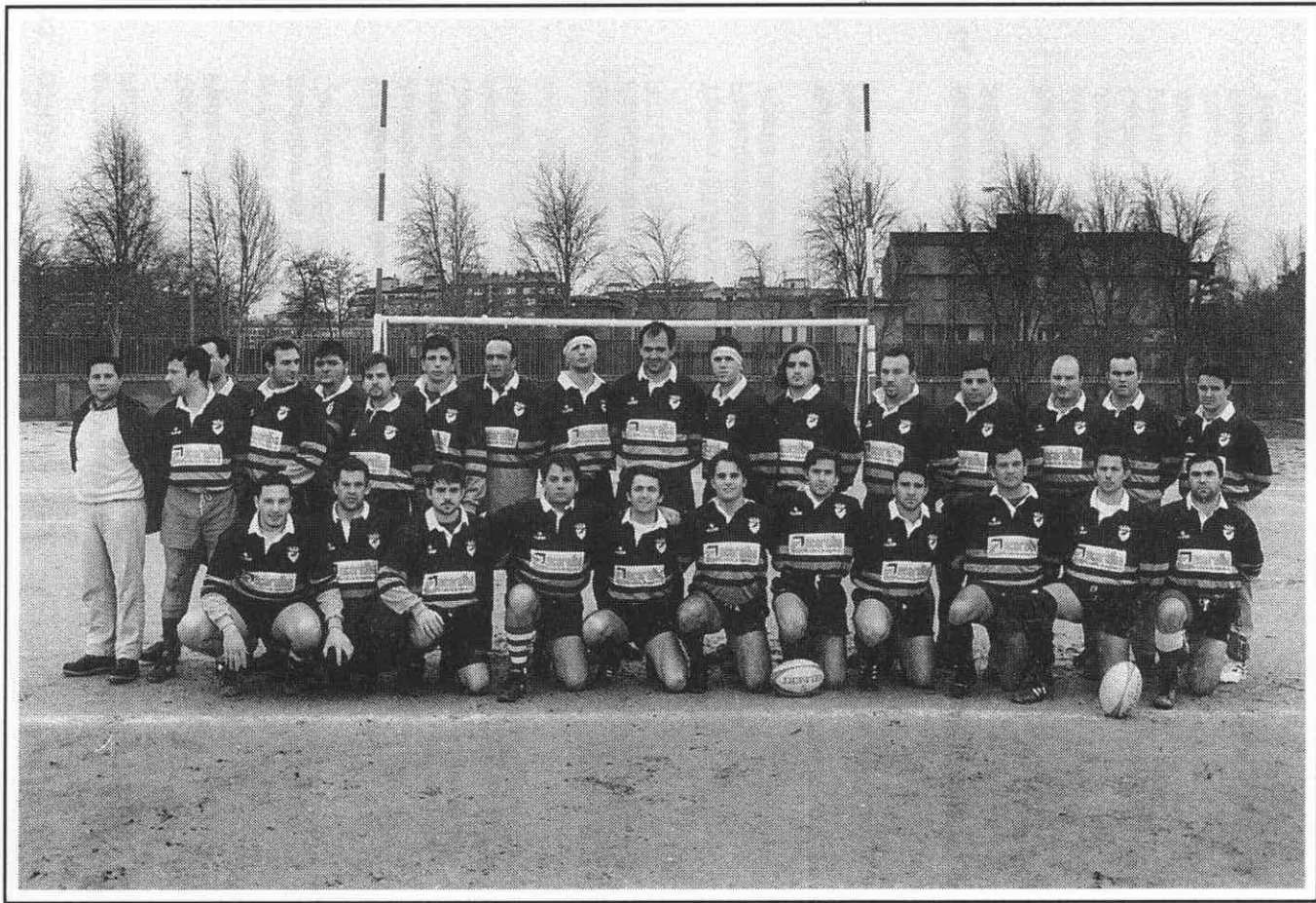
Club de Rugby Albacete.