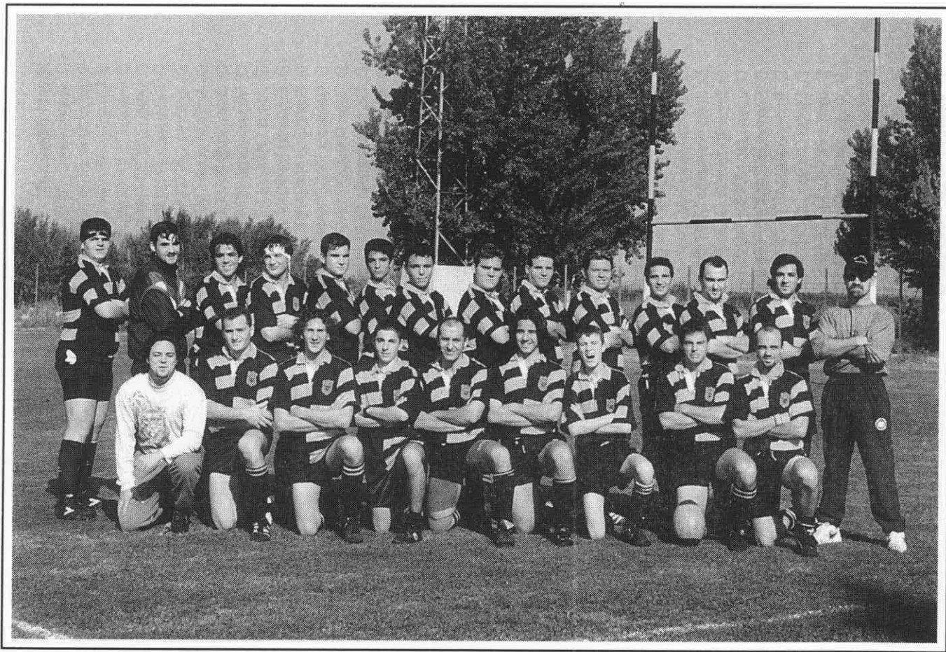
Rugby Club Alzira.