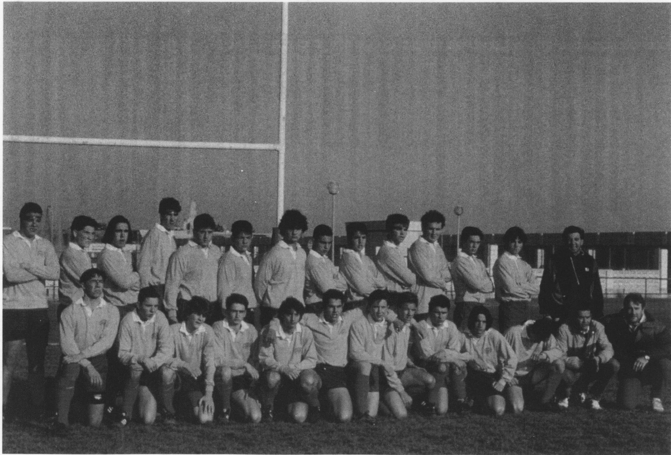
Selección Cadete de Valencia.