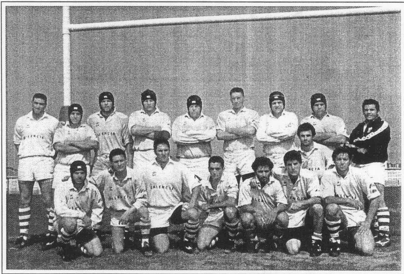
Valencia Tecnidex. División de Honor