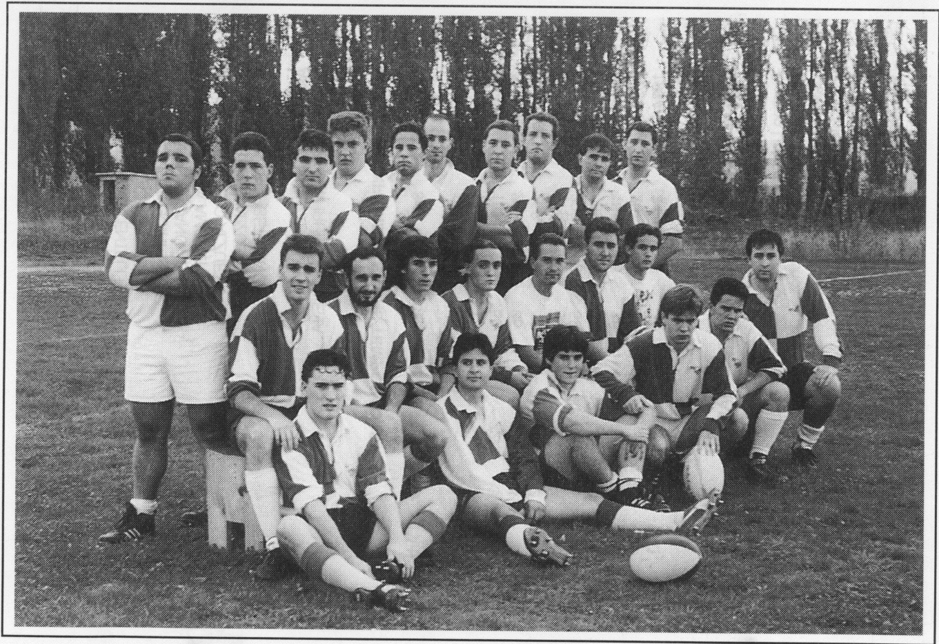
Los de Bronce Rugby Taldea.