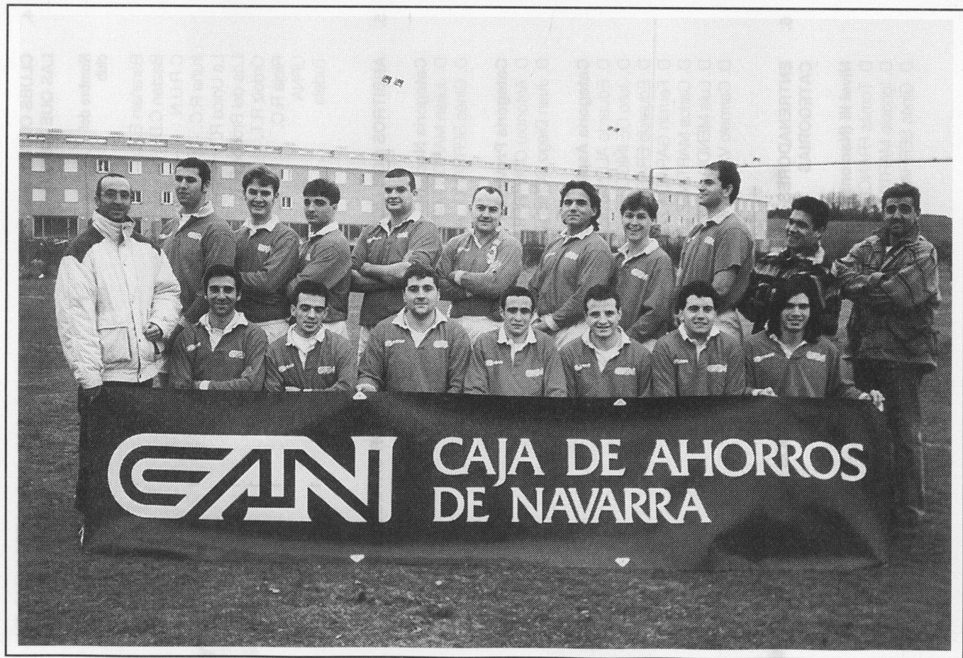
Iruña, R. C.