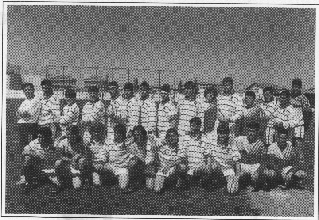
Selección Juvenil Navarra.