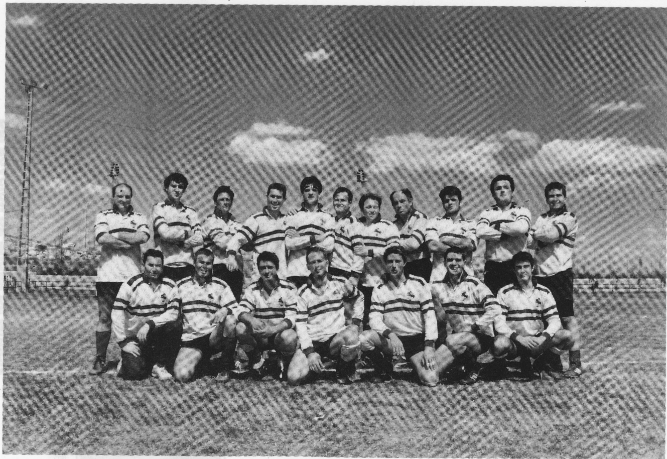
C.R. Veterinaria de Murcia