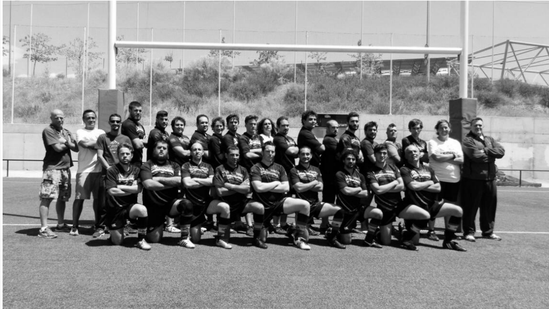
XV Hortaleza Senior 2014-15