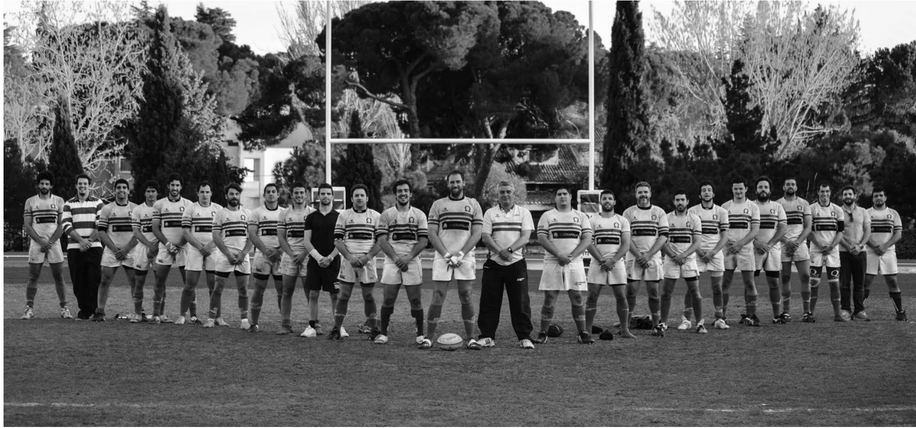
Olimpico Pozuelo R.C. Senior 2014-15