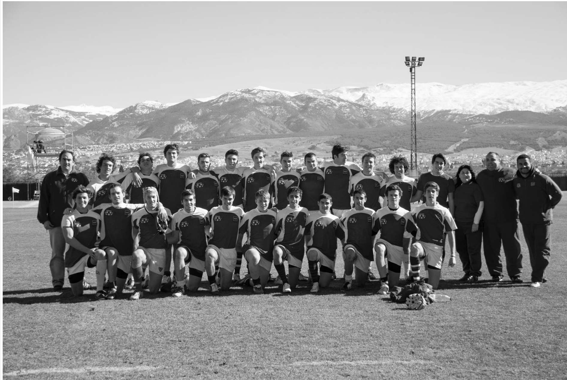
Selección Madrid Sub 18 2014-15