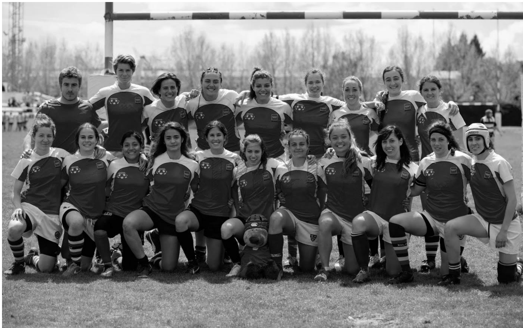
Selección Madrid Femenina Sub 23 2014-15