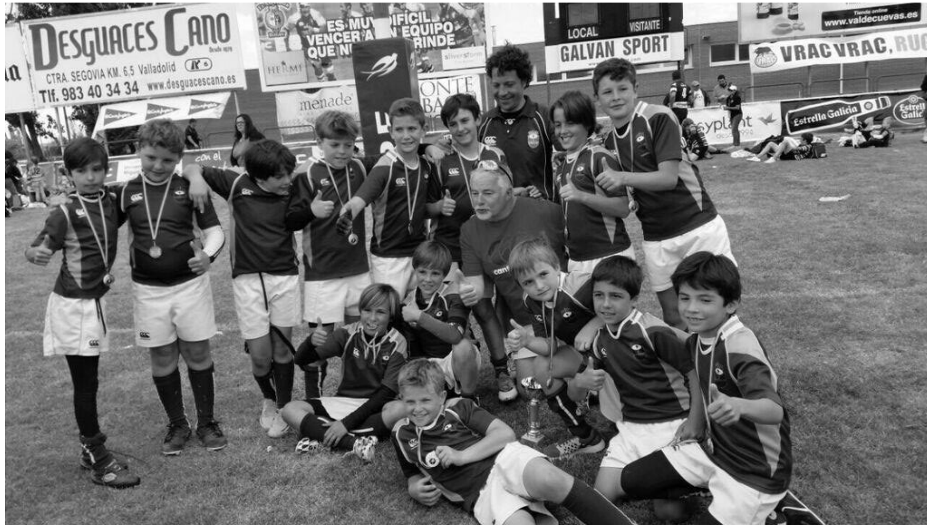
Club Alcobendas Rugby Sub 10 2014-15