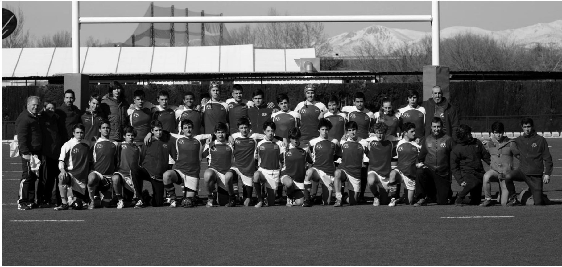
Selección Madrid Sub 16 2014-15