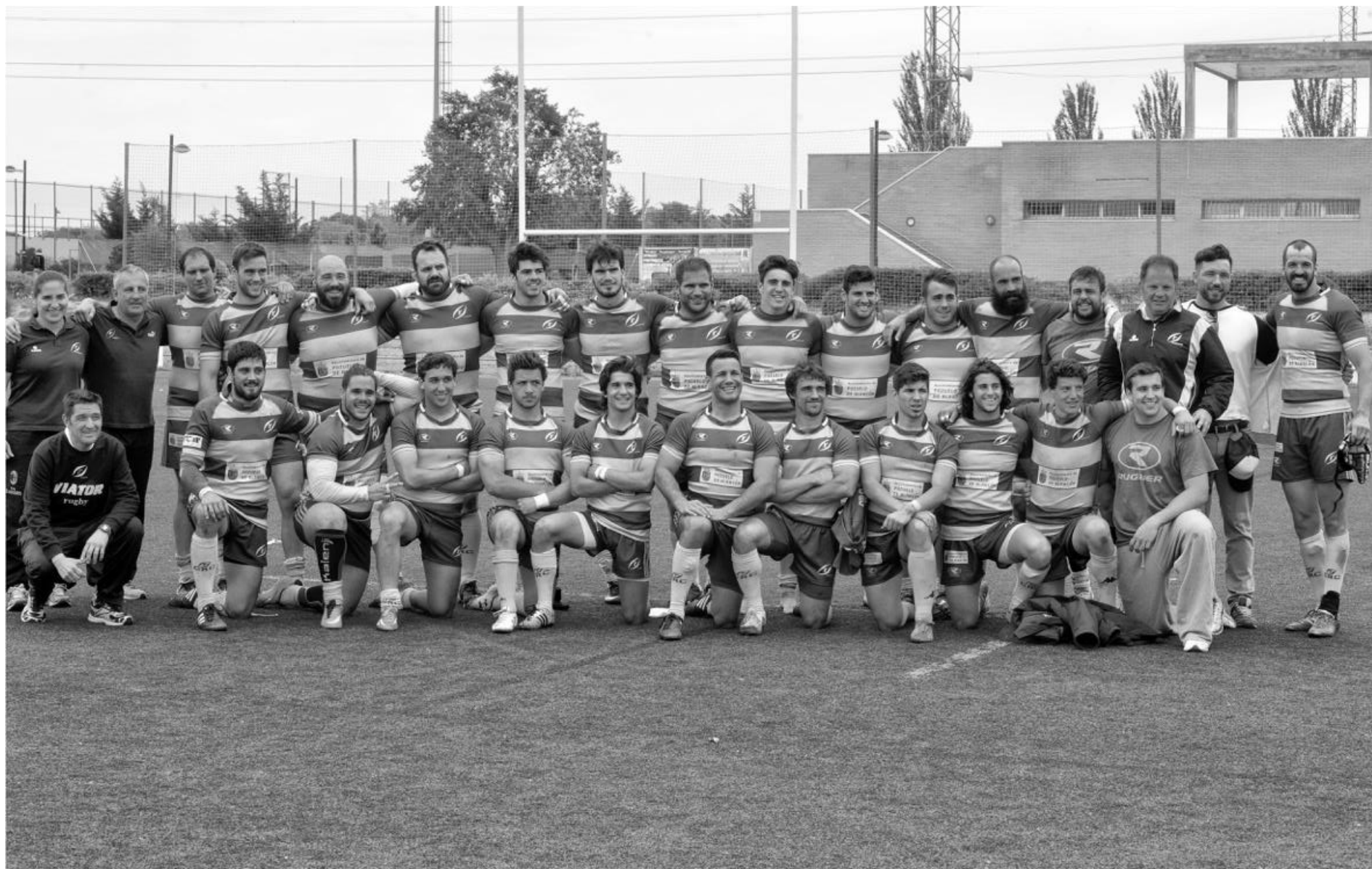
CRC Pozuelo Senior 2014-15