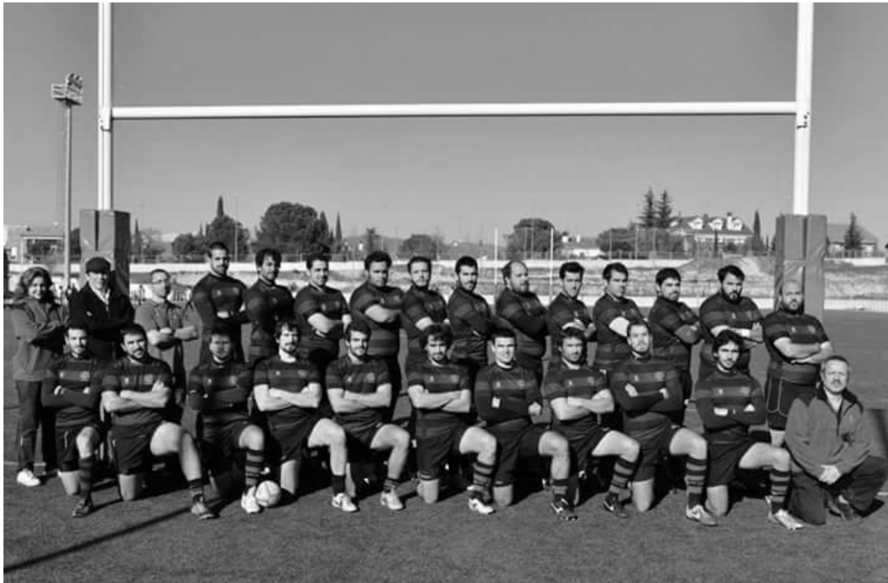
A.D. Ing. Industriales Senior 2014-15