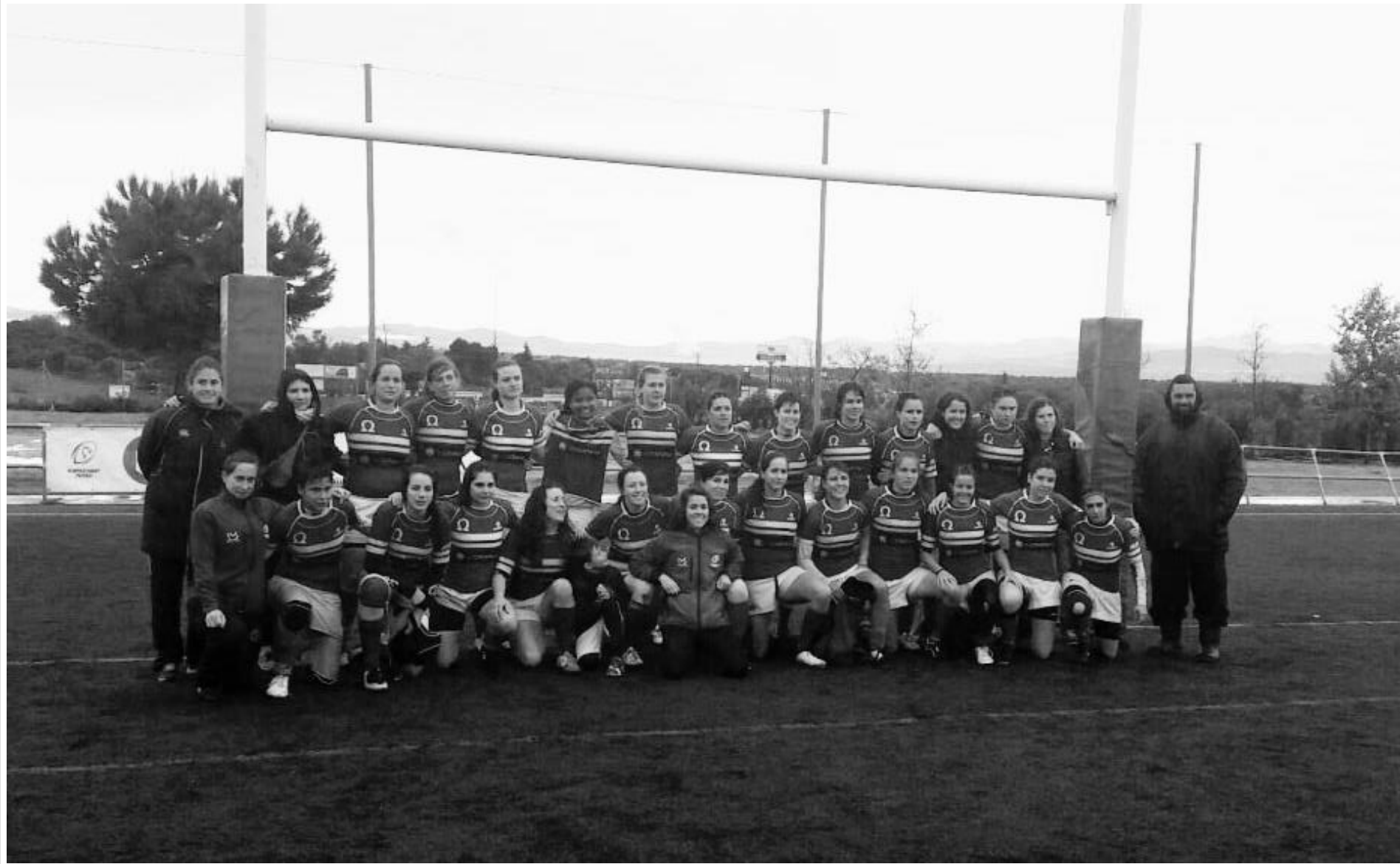
Olimpico Pozuelo R.C. Femenino 2014-15