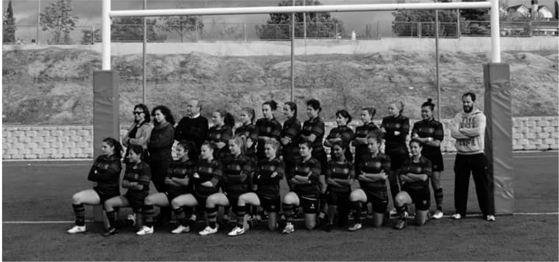
A.D. Ing. Industriales Femenino 2014-15