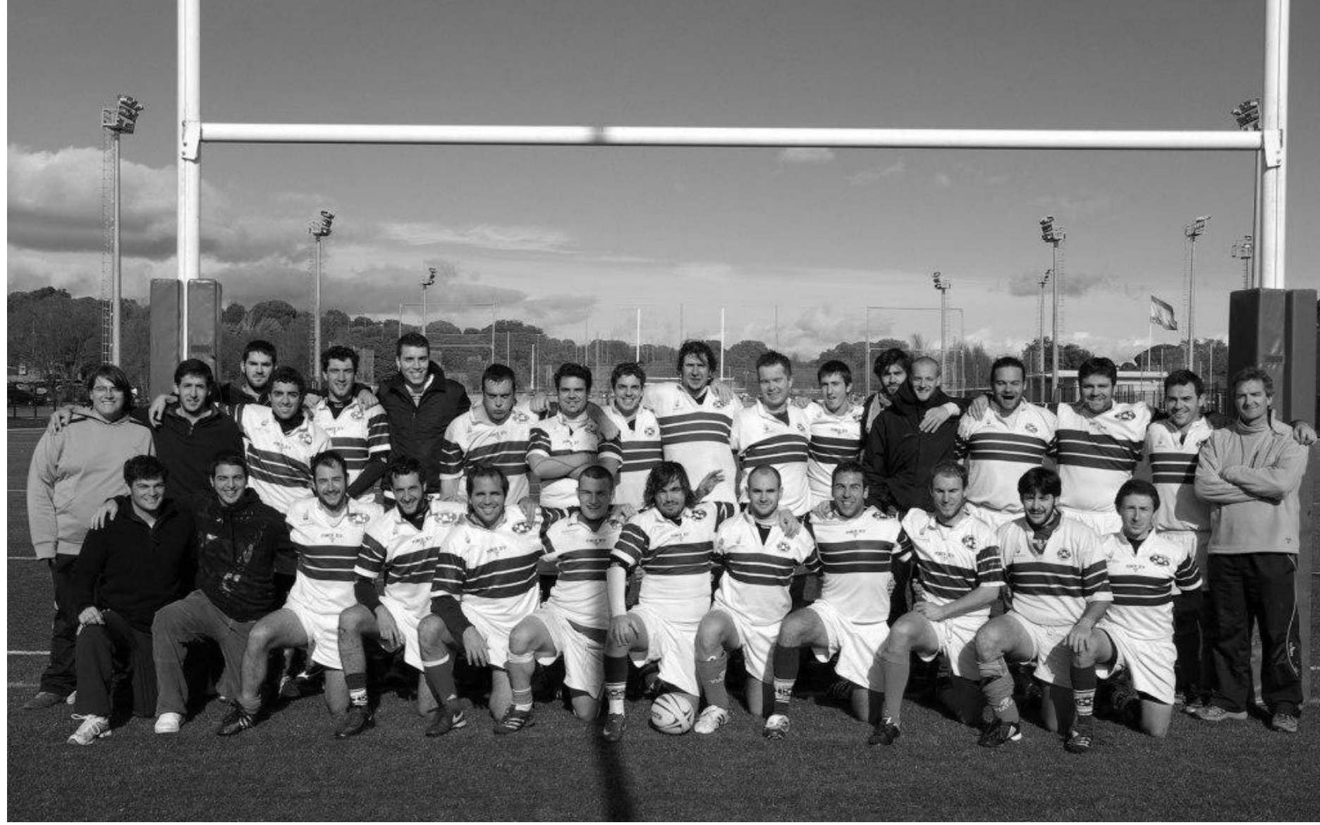
Boadilla Tasman R.C.