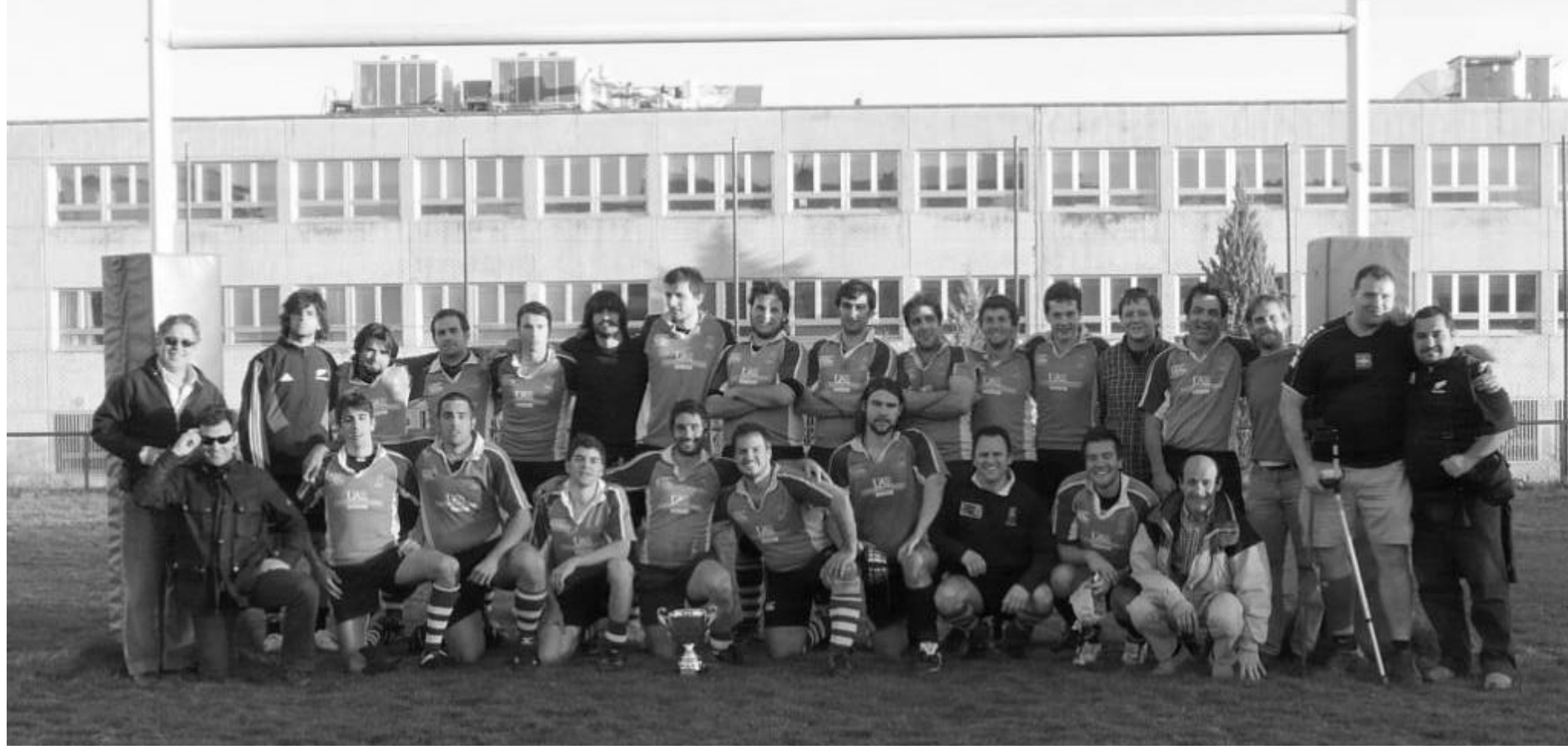
C.R. Tres Cantos