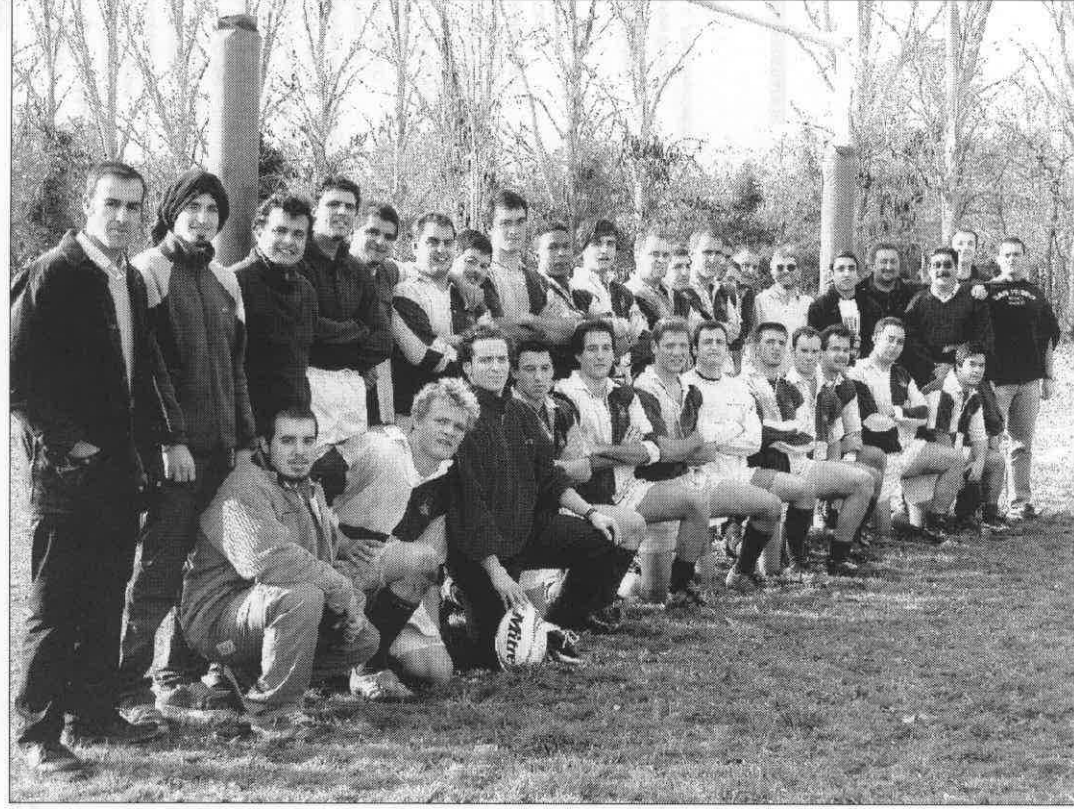
San Isidro R.C.