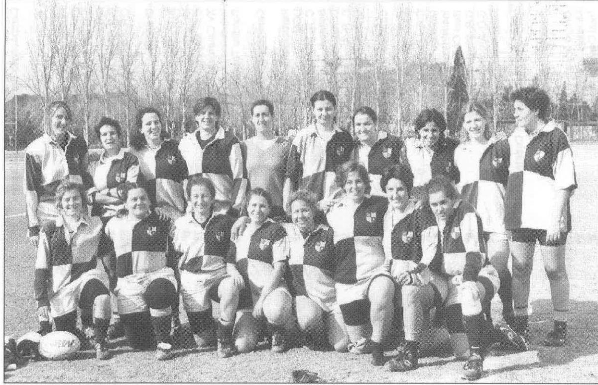
Scrum R.C. Femenino