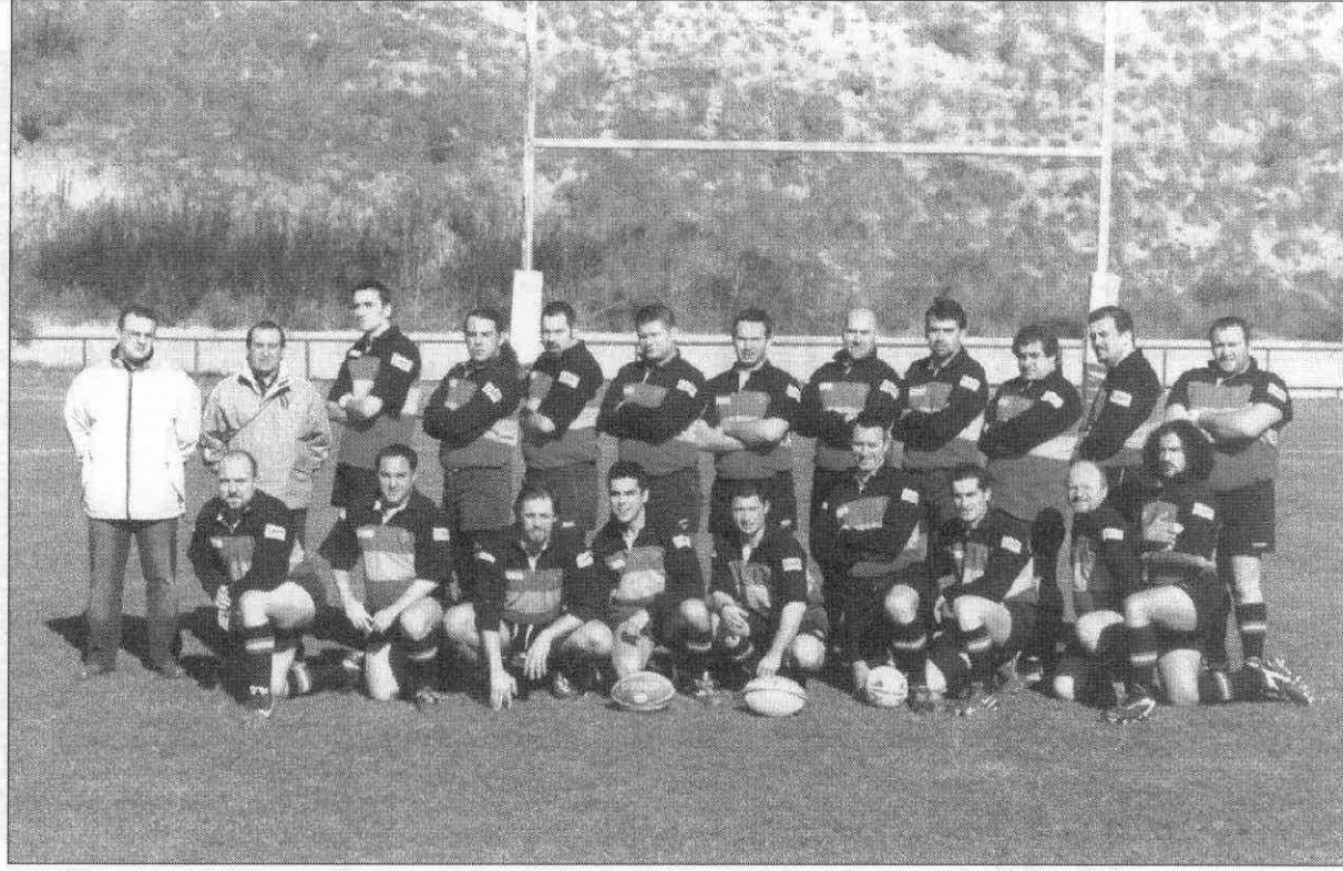
XV Hortaleza R.C.