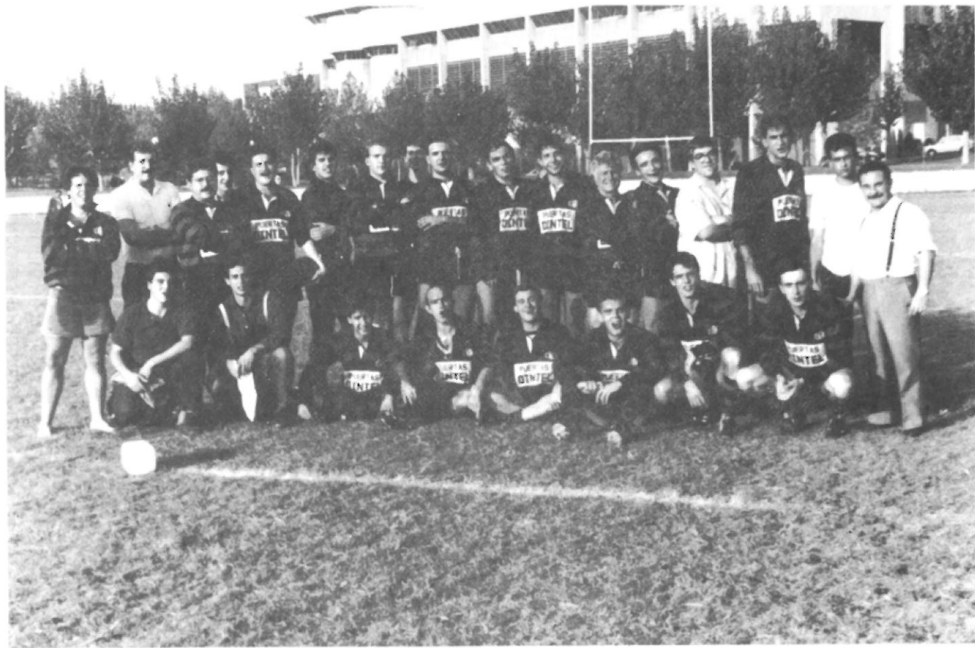
I. Industriales de Madrid.