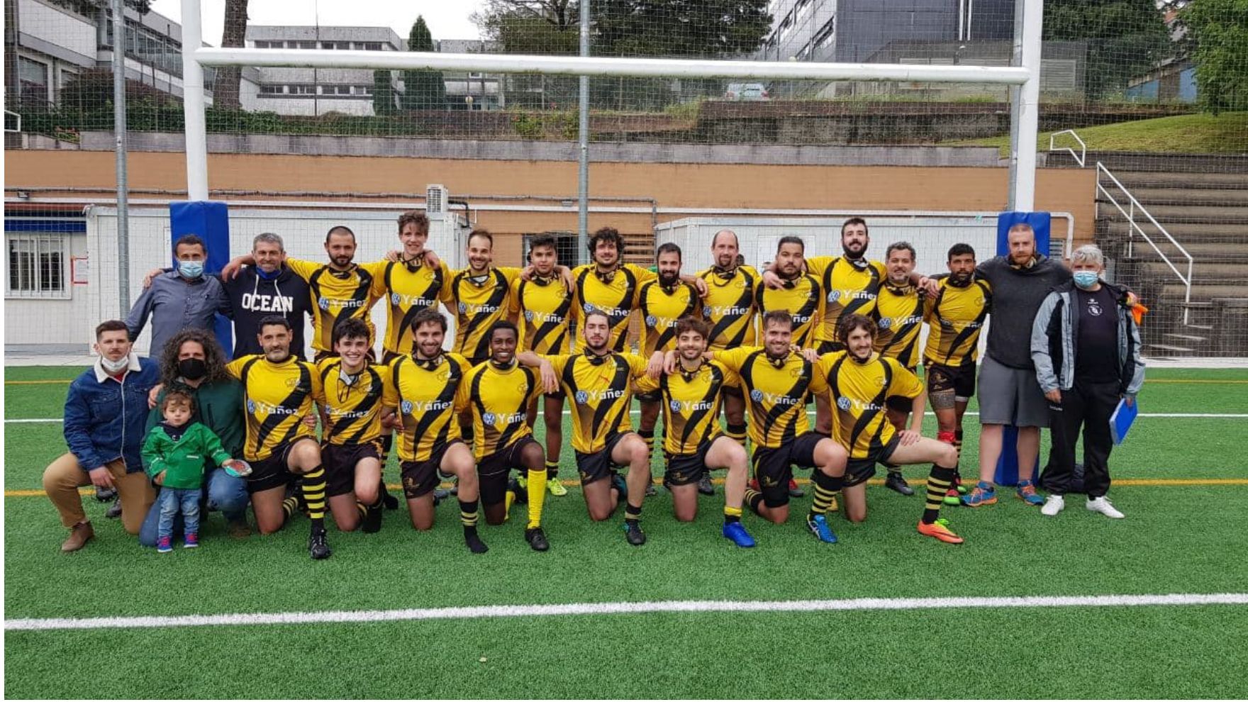
Santiago Rugby Club masculino senior 2020-21