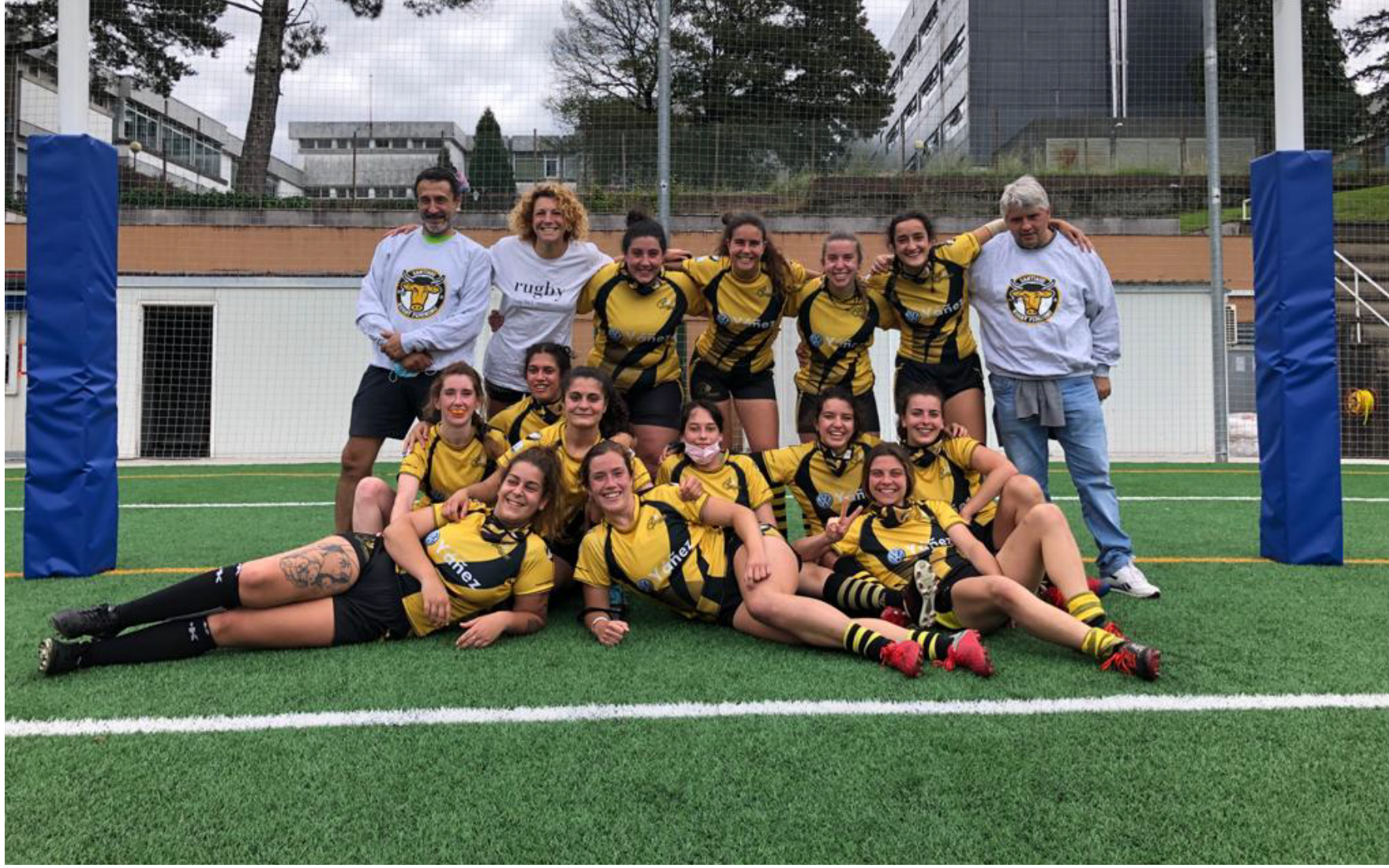
Santiago Rugby Club Femenino 2020-21