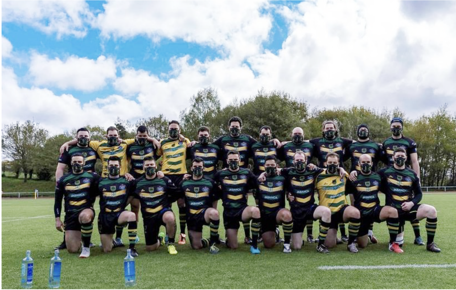
Muralla R.C. senior masculino. 2020-21