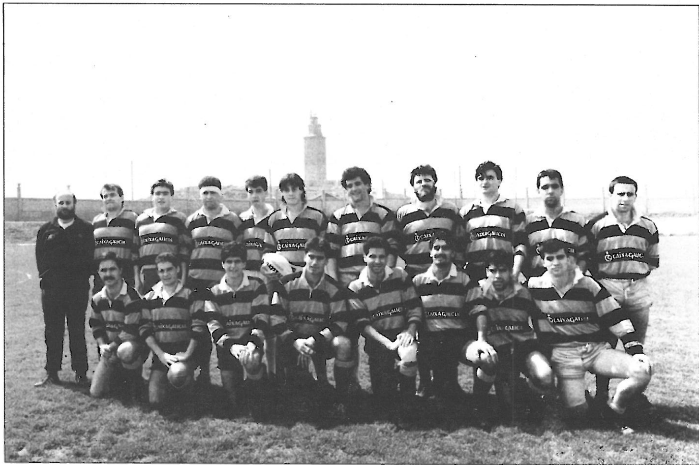
C.R. Arquitectura Técnica de La Coruña