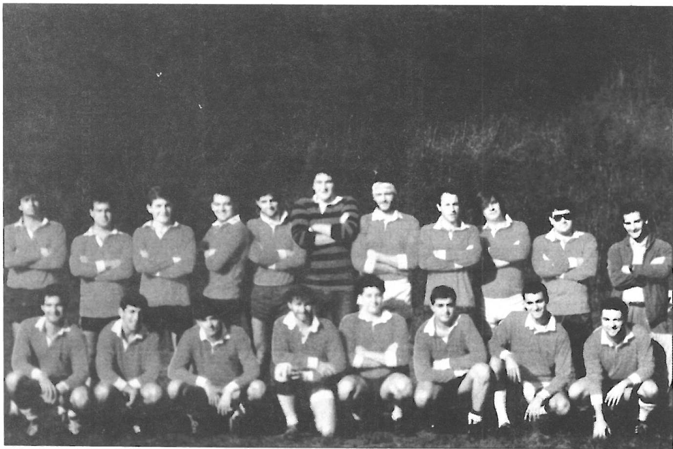
Económicas La Coruña