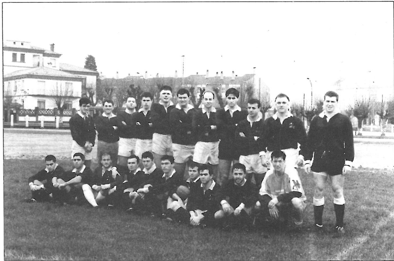
Marina de Ferrol