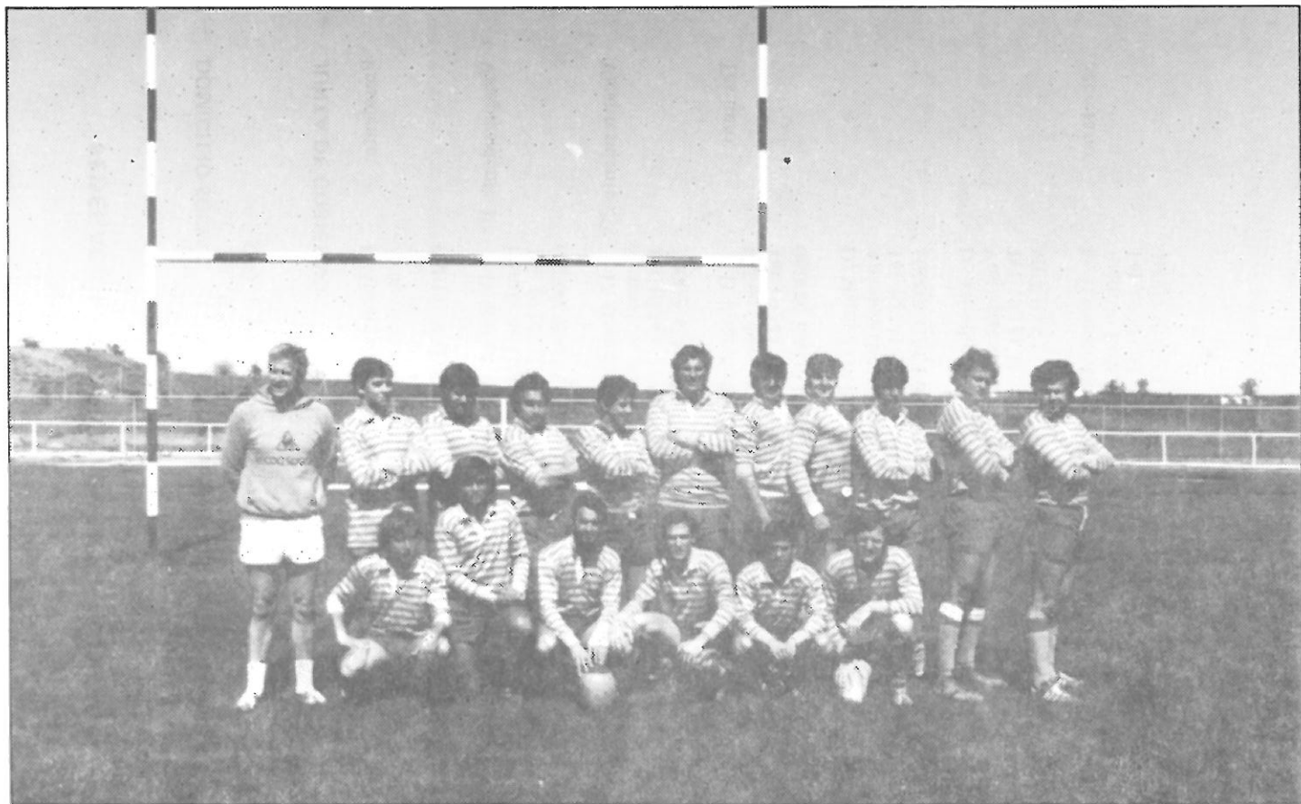
Selección Extremeña Senior