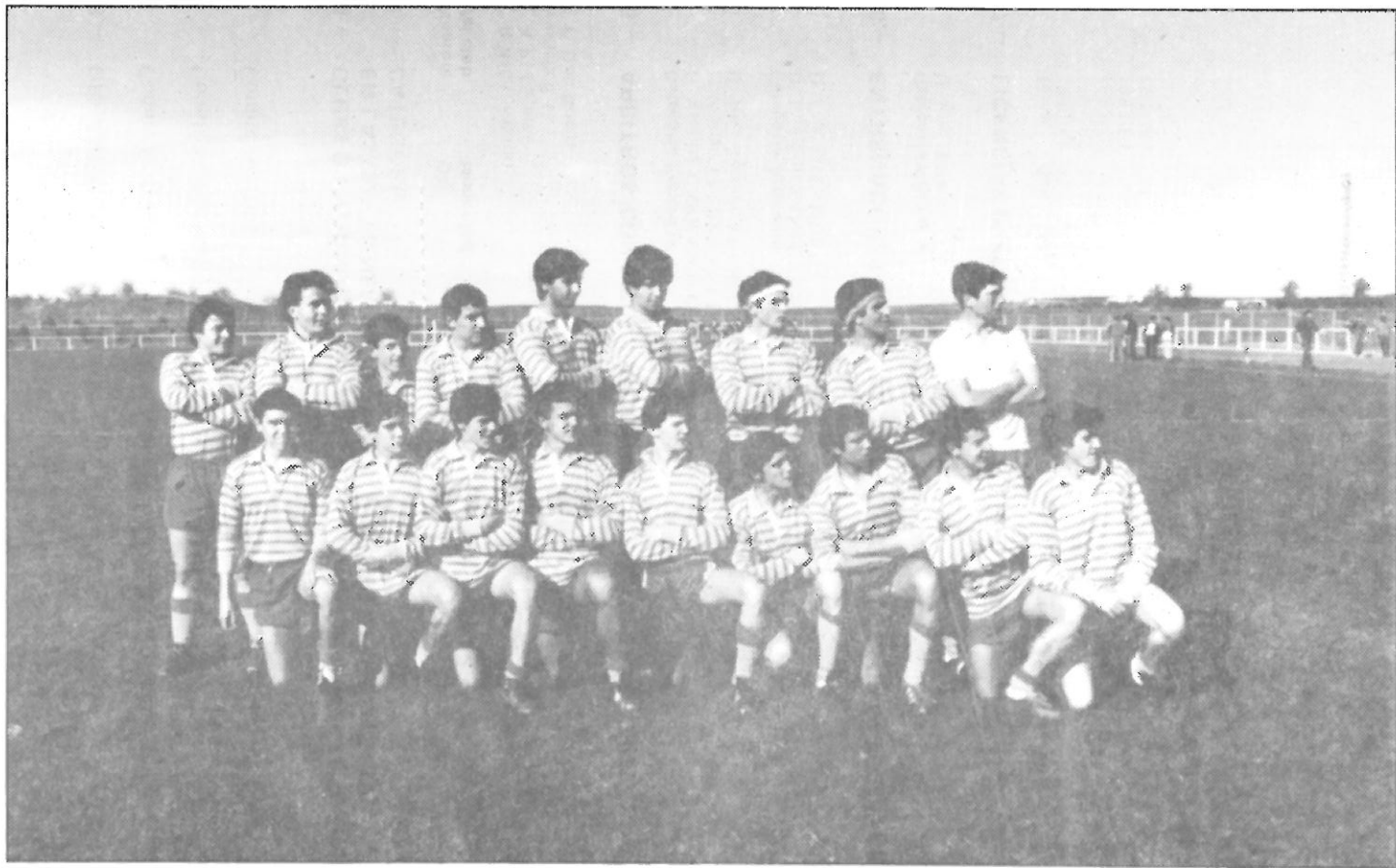
Selección Extremeña Juvenil