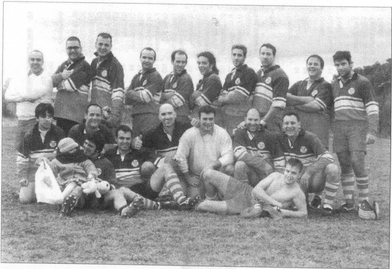
At. Vic Crancs