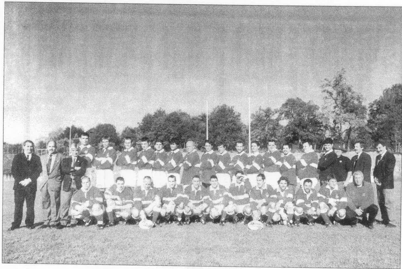
G.E. i E.G.