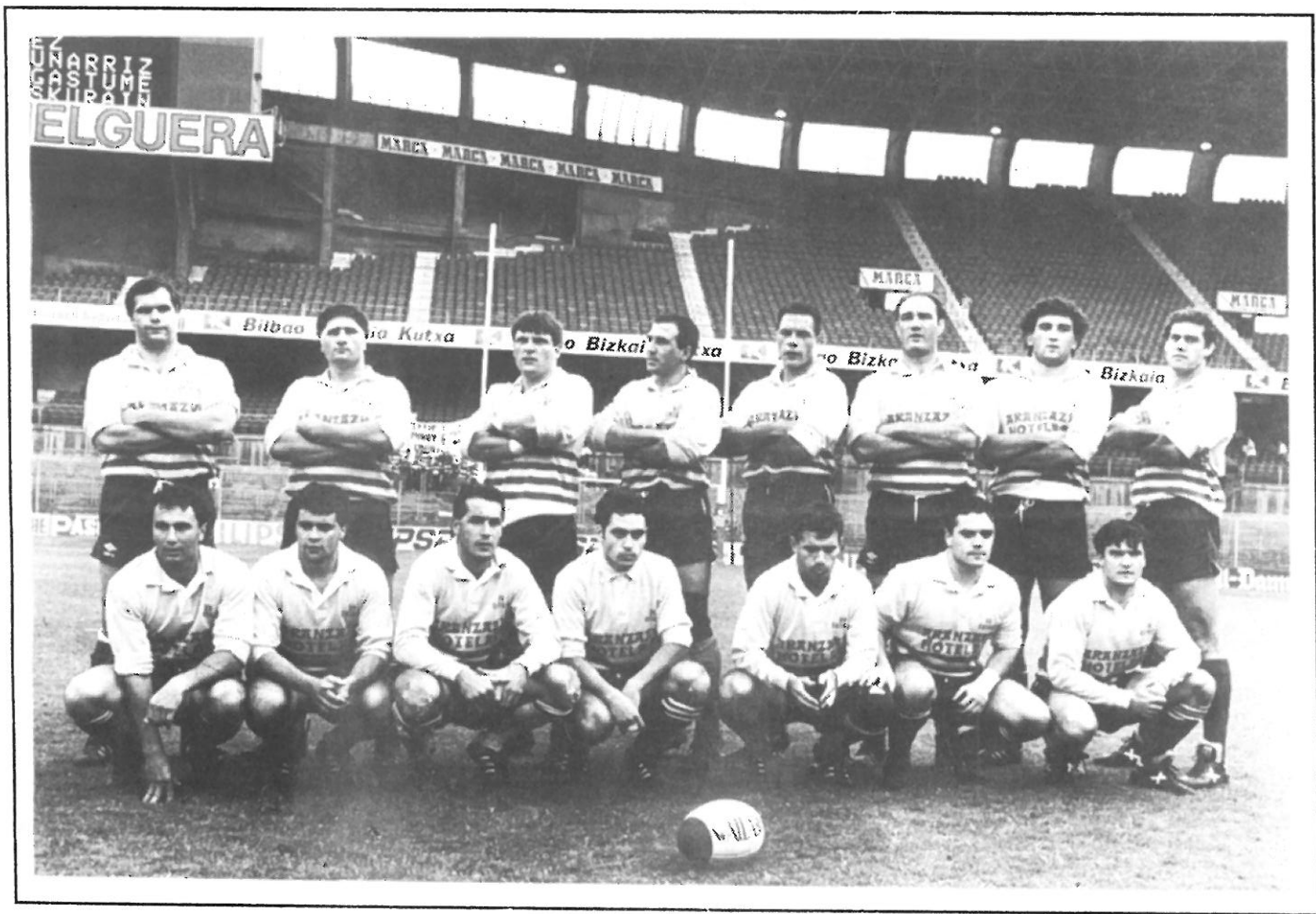
Combinado Catalán (Norte/Sur). Bilbao. 10-5-1990.