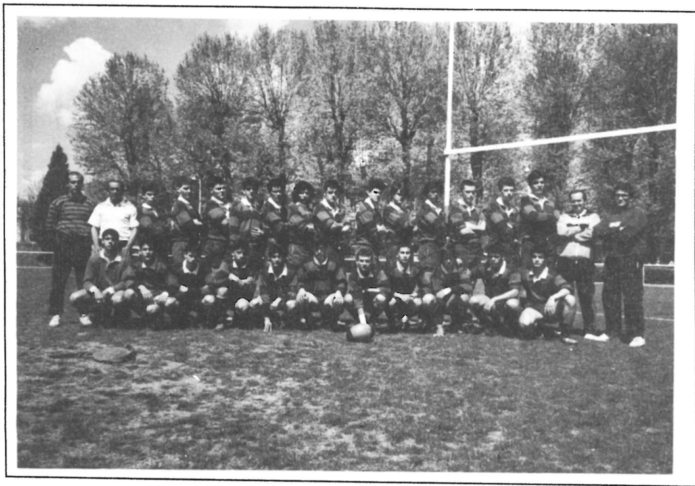
Selección Catalana Cadete.