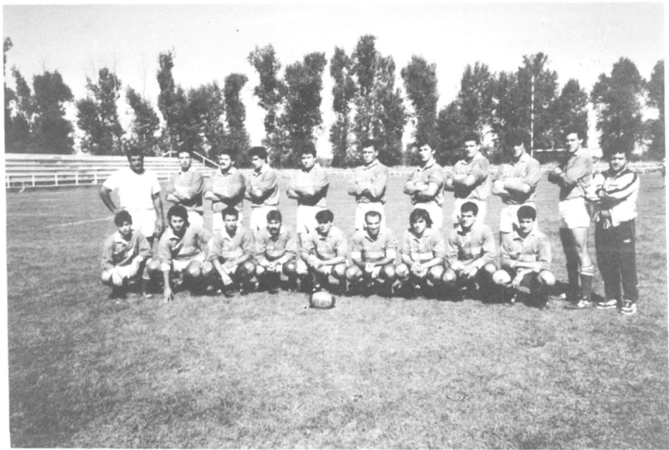
U.E. Santboiana Once.