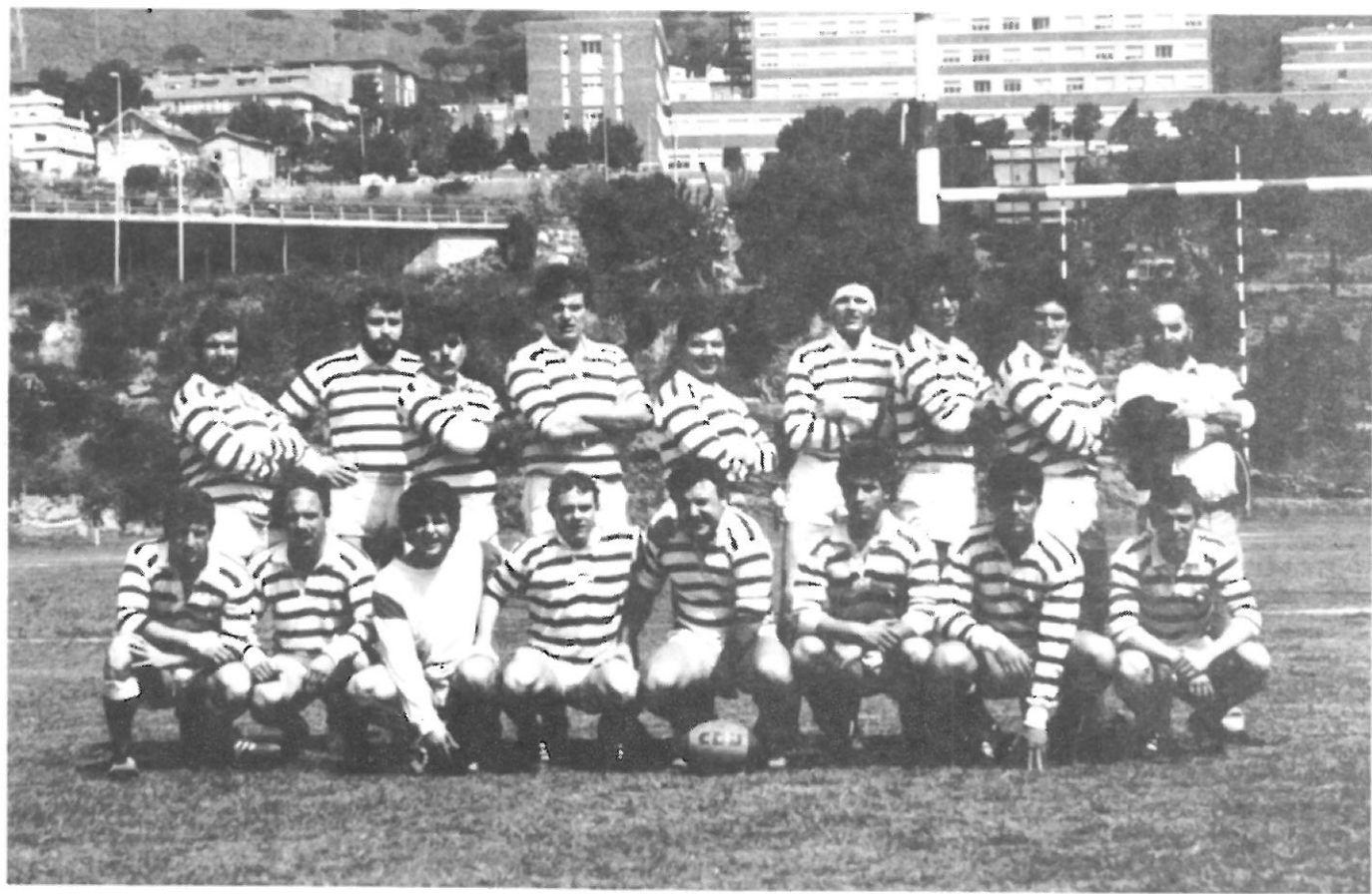
C.R. Universitario Barcelona