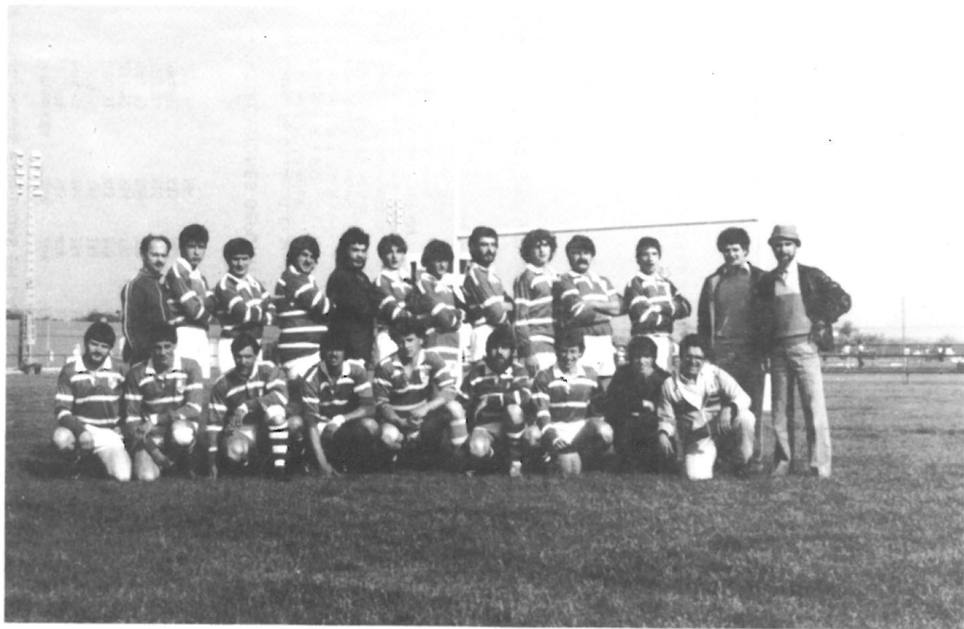
C.R. Atlético Cassá