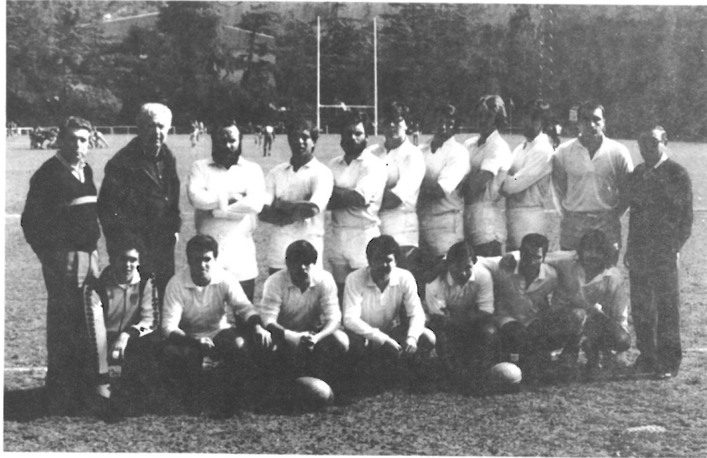
C. Natación Barcelona