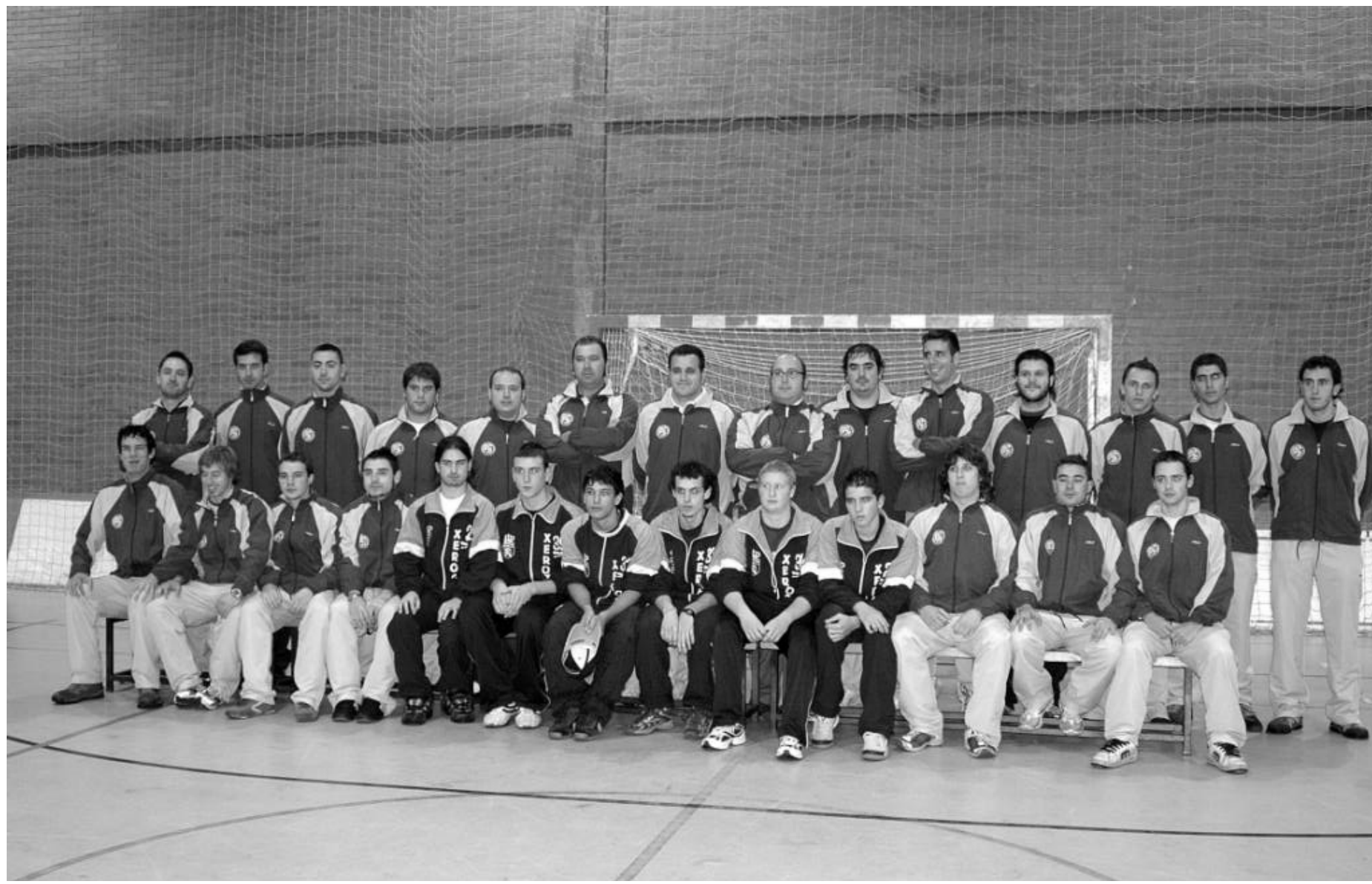
Universidad de León