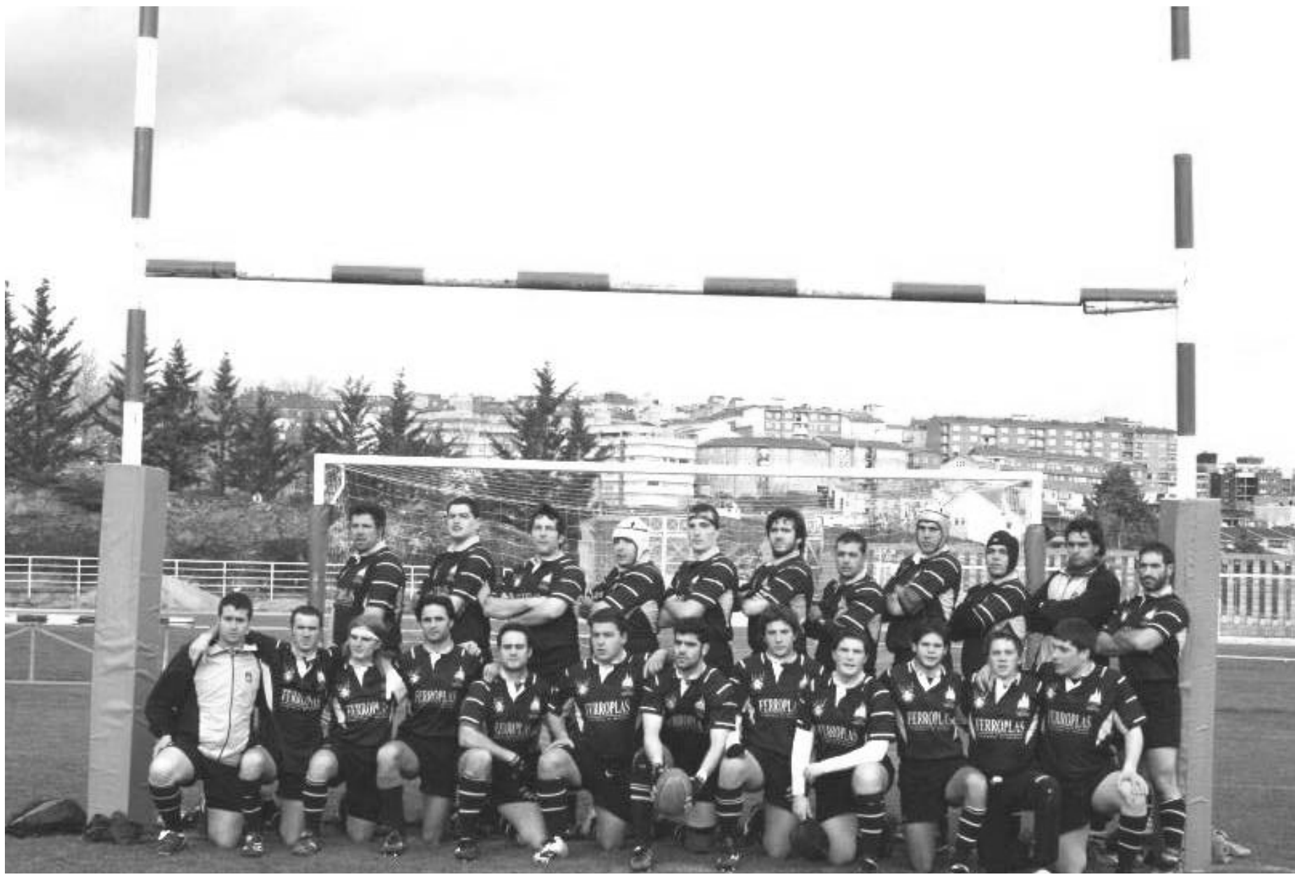
Universidad de Burgos – Aparejadores R.C.