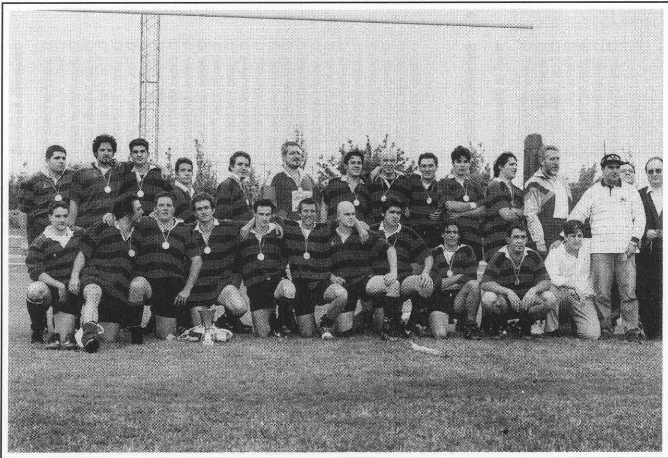
ADUS Salamanca R.C.