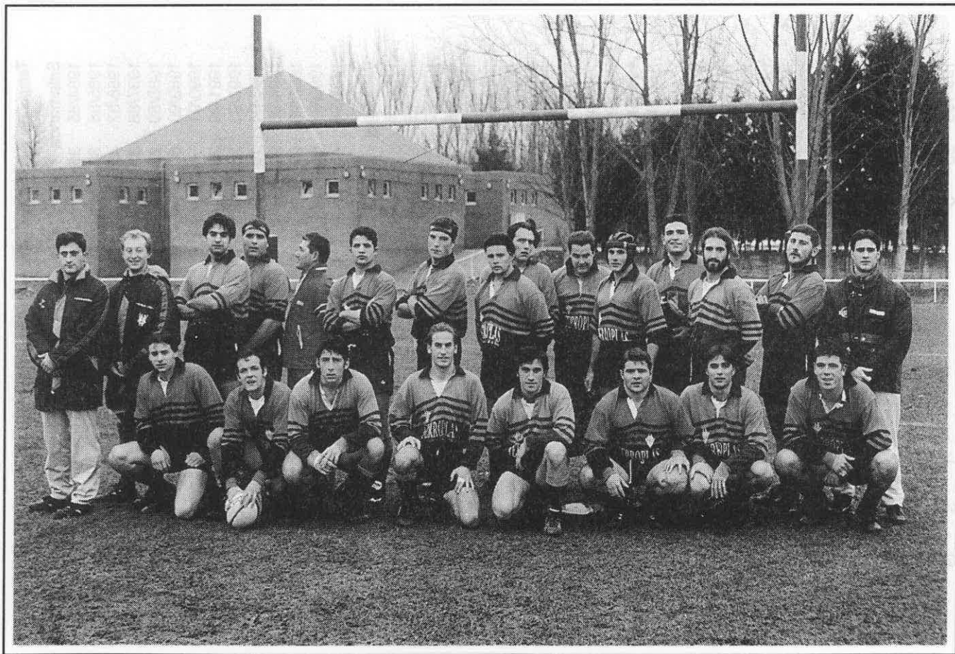
Ferropías Burgos R.C.