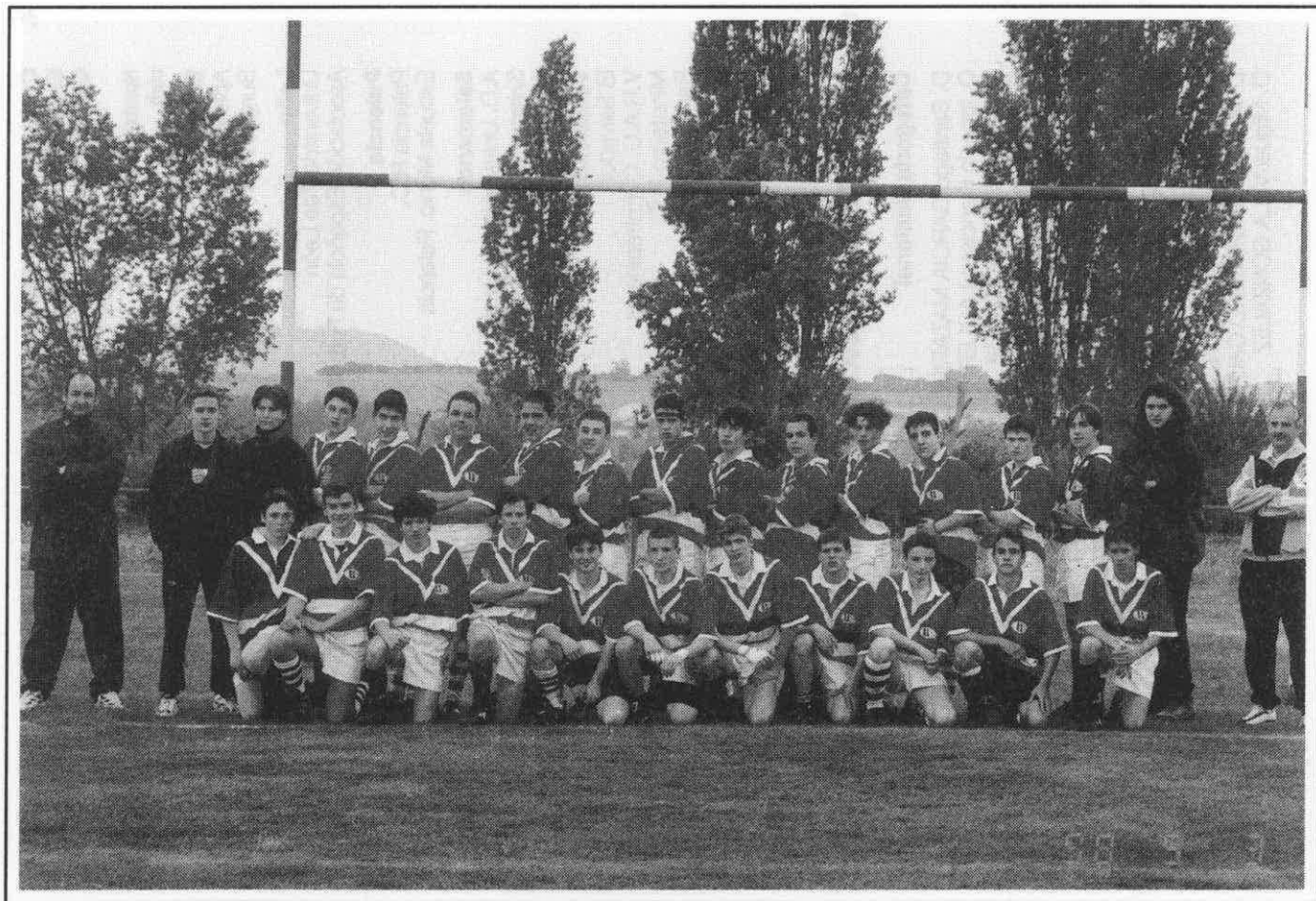
Selección Cadete de Castilla y León.