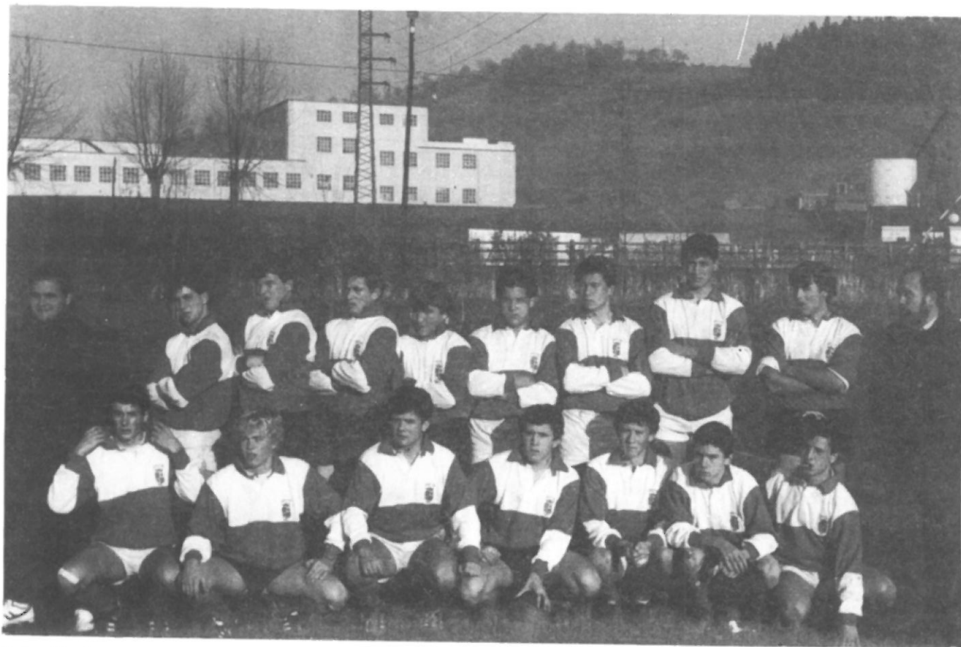
Selección Cadete. Castilla/León