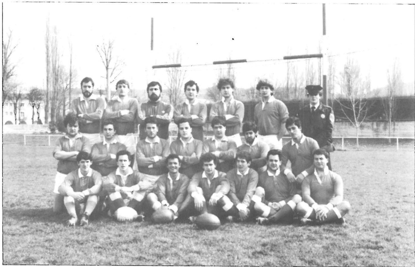
C.D. Diego Porcelos