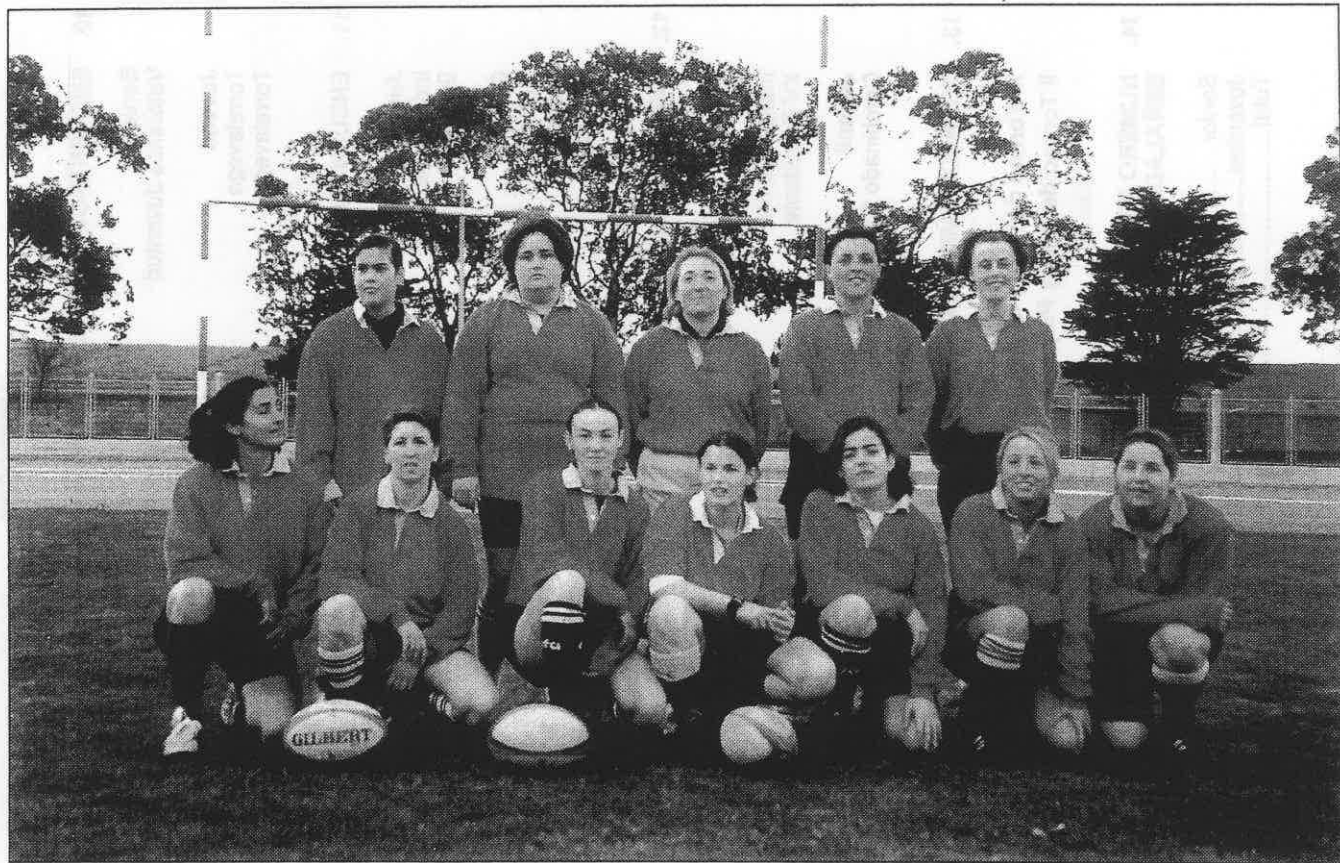
Universidad de Cantabria. Categoría Femenina.