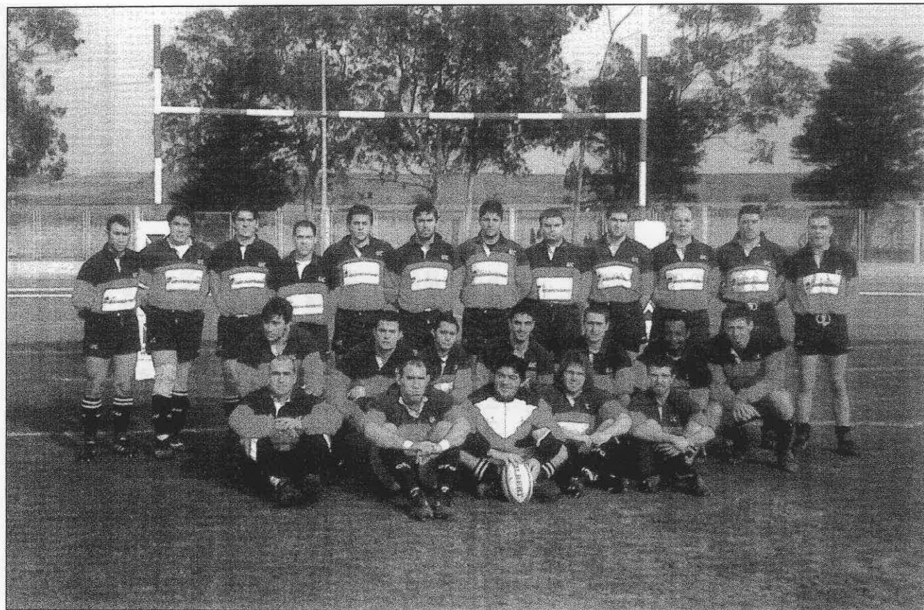
Universidad de Cantabria.