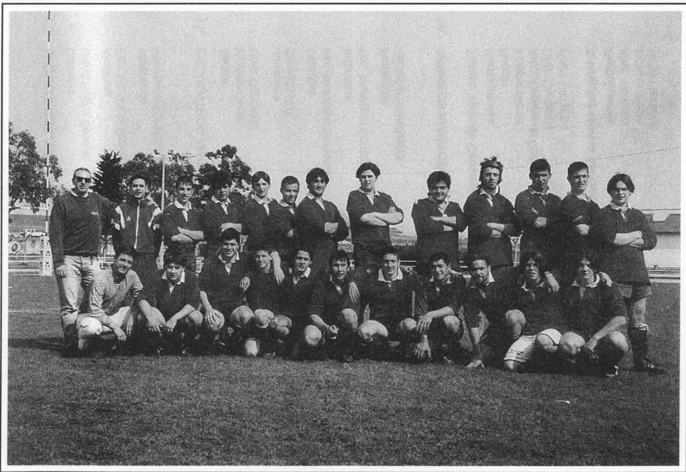
Equipo Junior Universidad de Cantabria R.C.