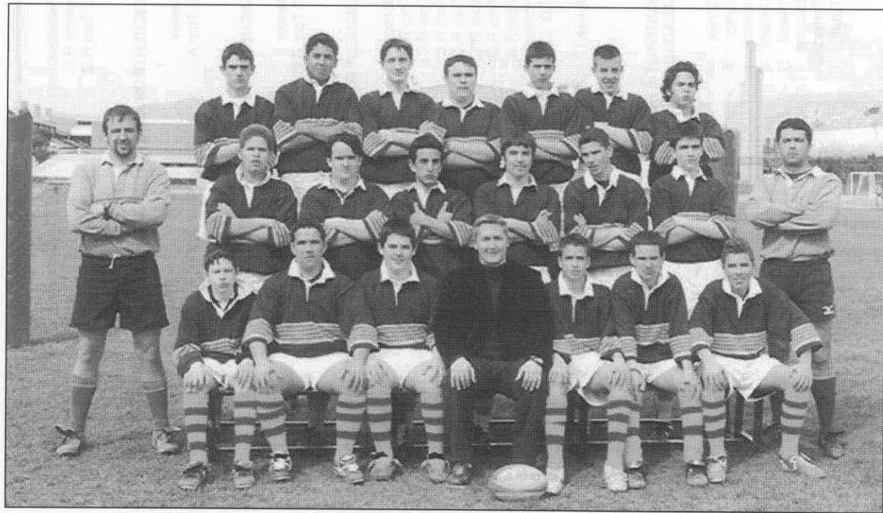
Selección Balear Cadete