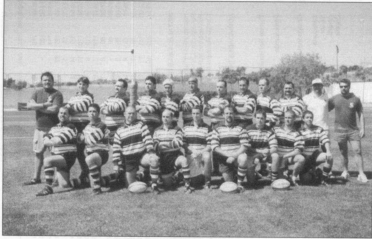
El Toro R.C.