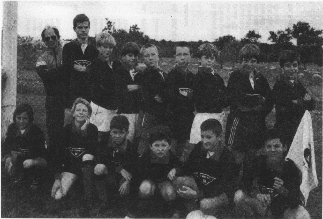
Escuela Municipal Calvia de Infantiles