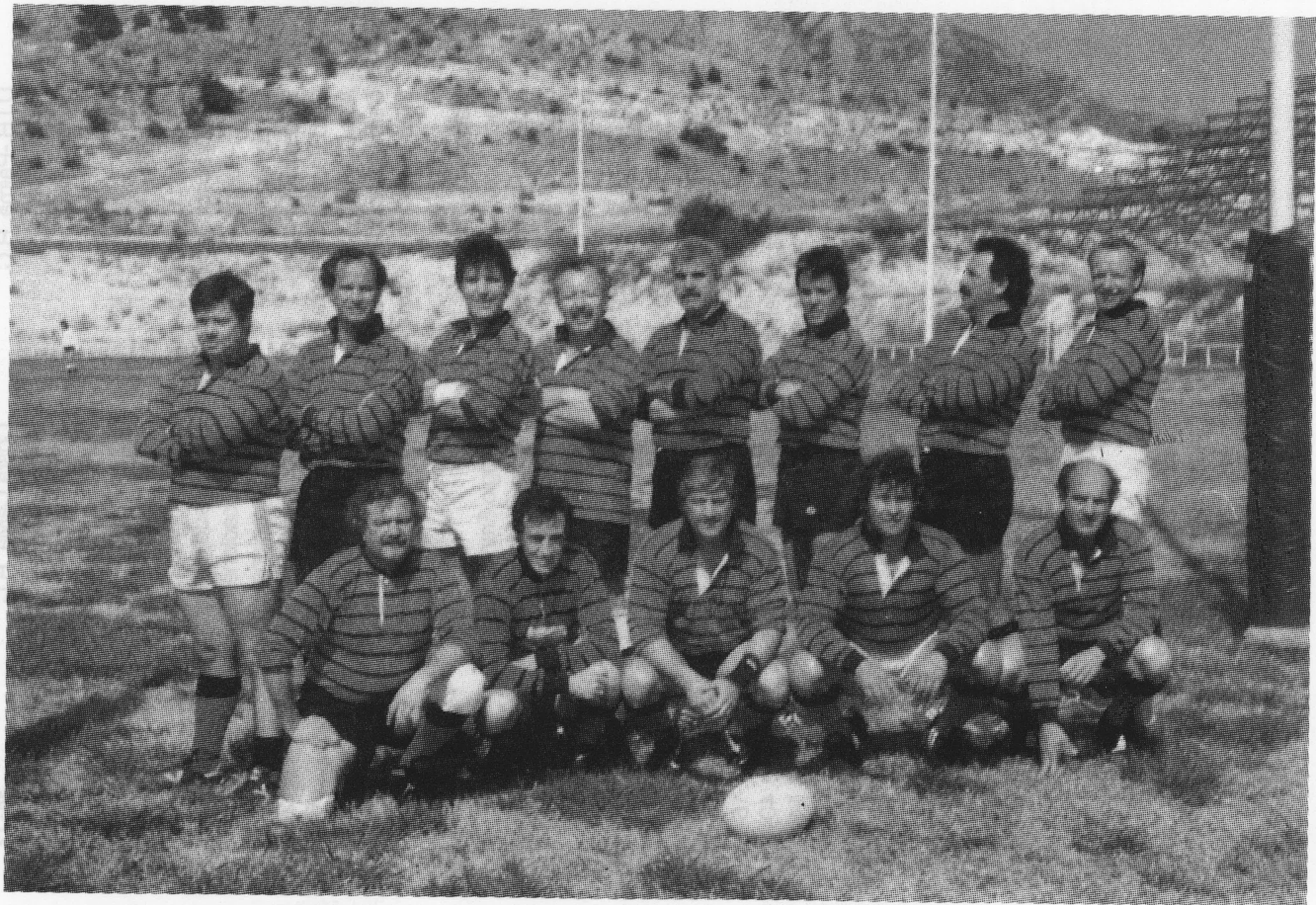
Veteranos Mallorca R.C.