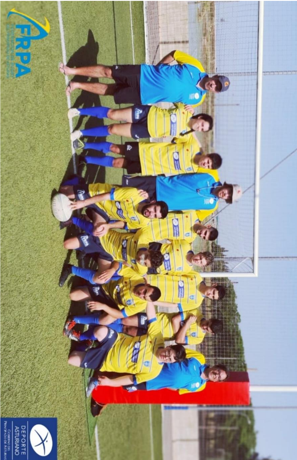
2a Selección Asturiana Inclusiva 2021-22