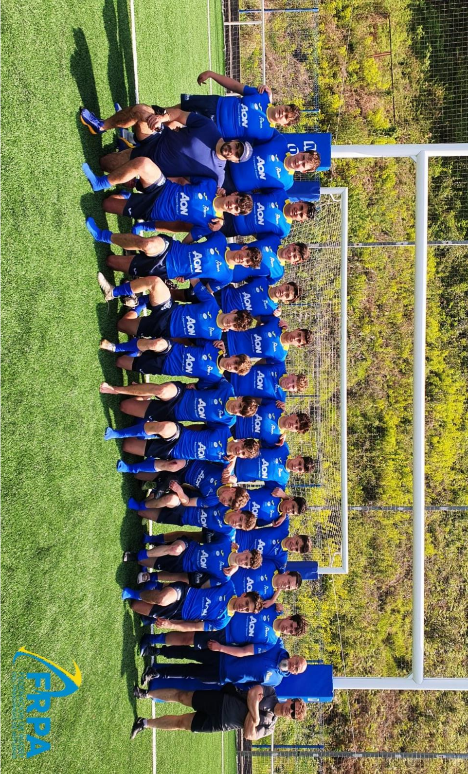
Selección Asturiana XV (cat. M16 masculina 2021-22)