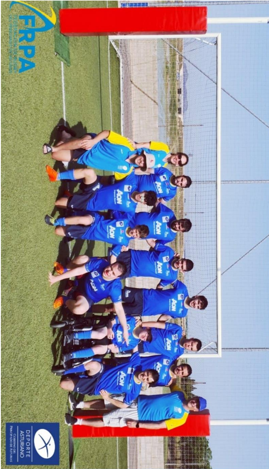
Selección asturiana inclusiva 2021-22