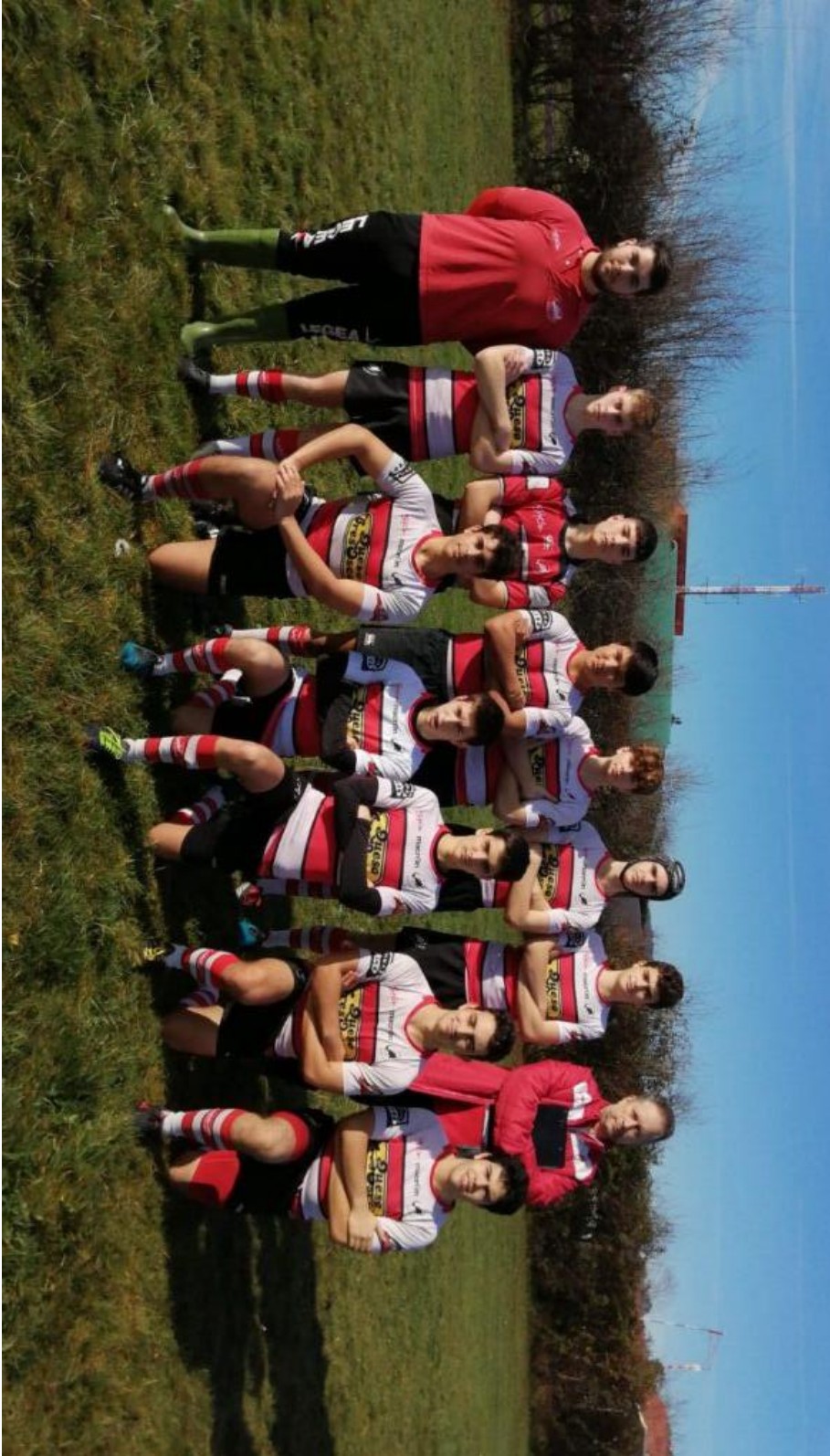
Gijón R.C. – Universidad de Oviedo Sevens (cat. M18 masculina 2021-22)