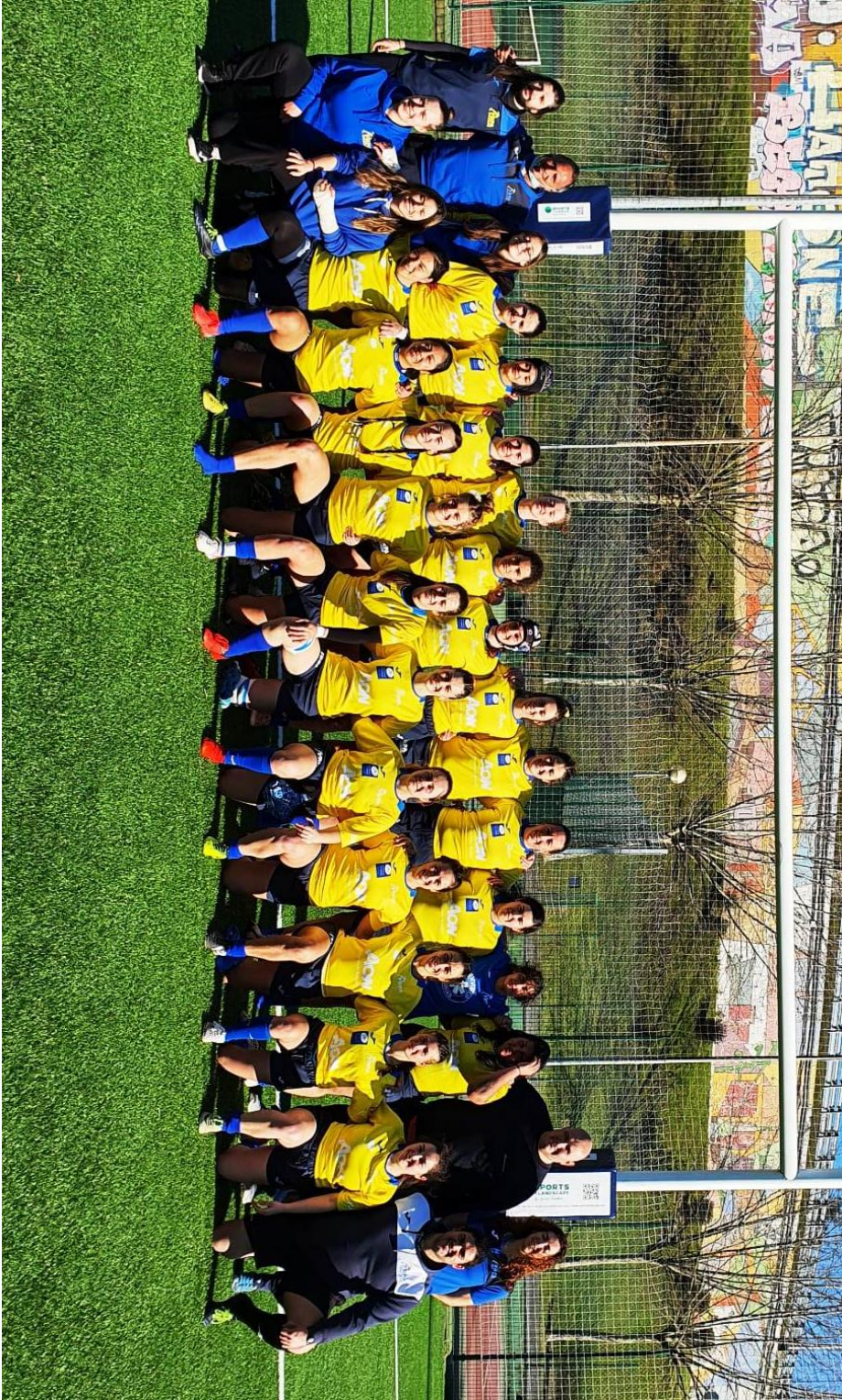
Selección asturiana XV (cat. Sénior femenina 2021-22)