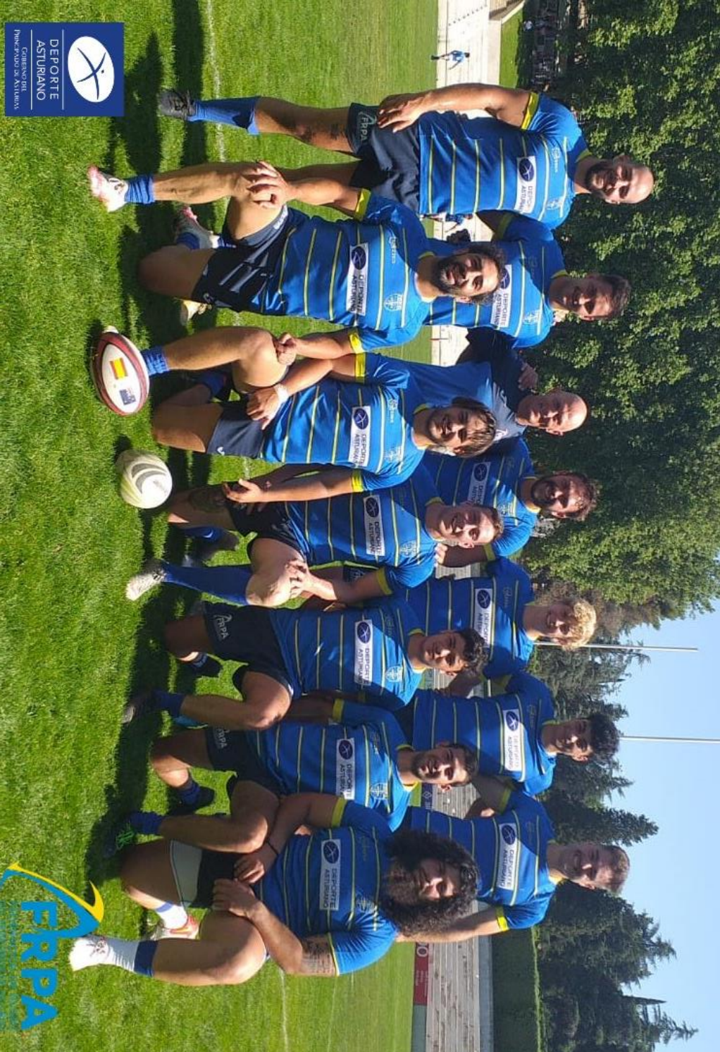
Selección Asturiana Sevens (cat. Sénior masculina 2021-22)