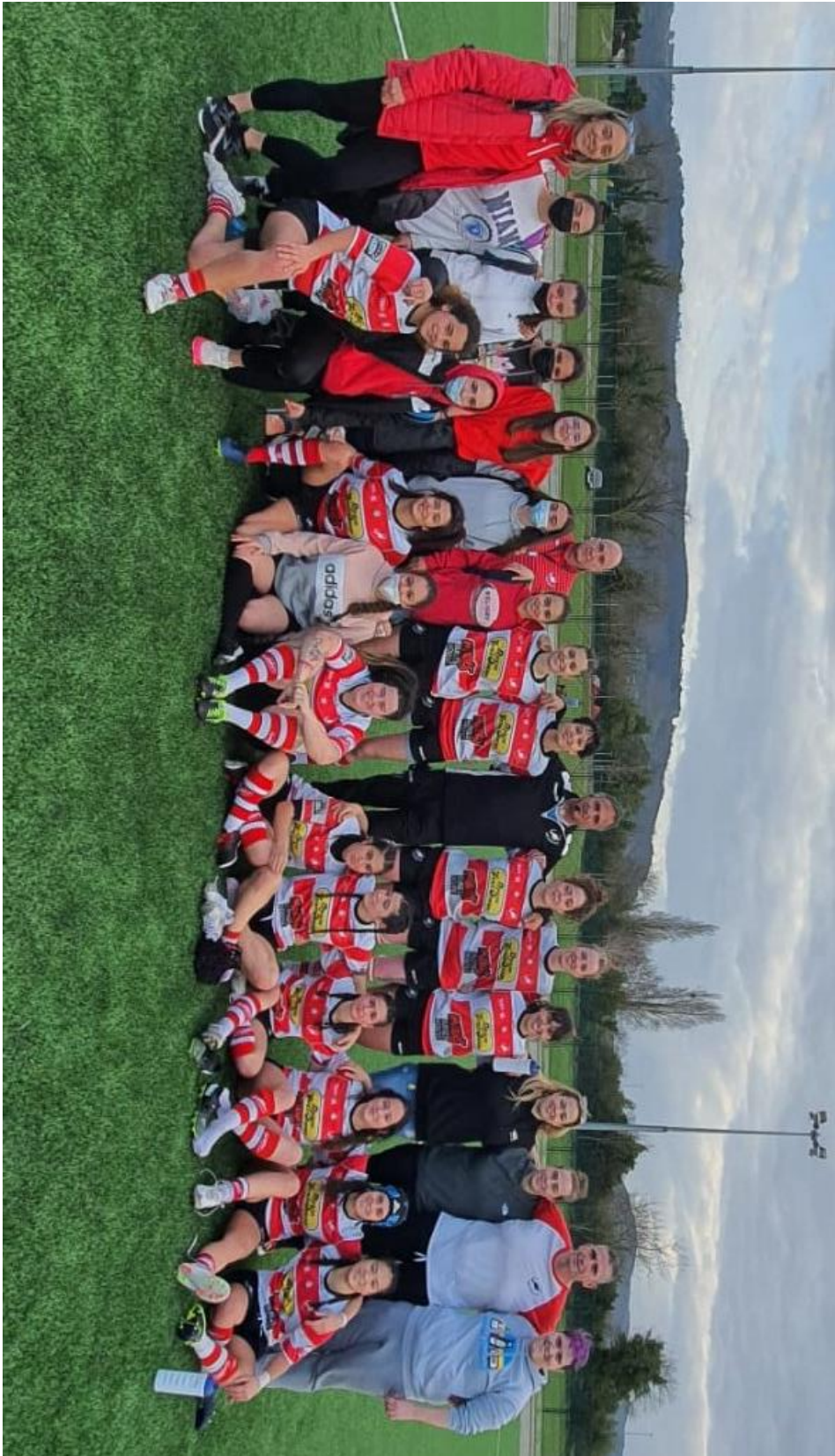
Gijón R.C. – Universidad de Oviedo (cat. Sénior femenina 2021-22)