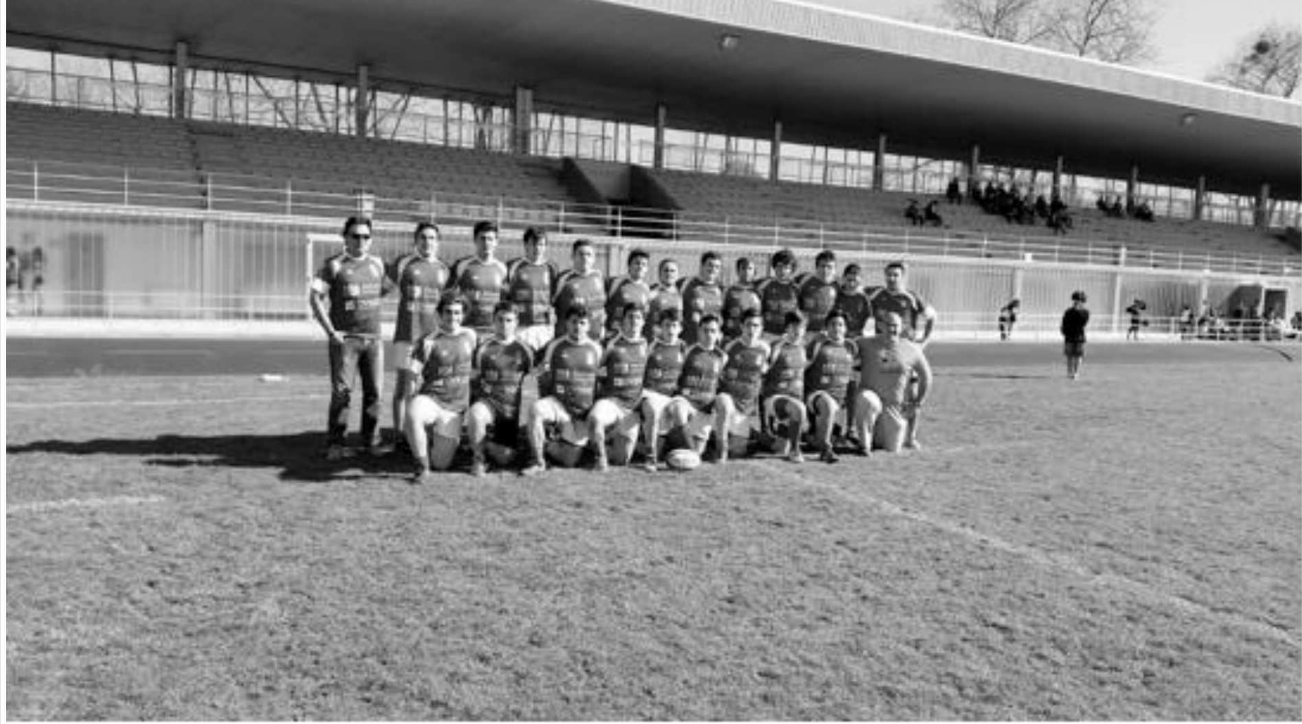
Oviedo R.C. Sub 18 2014-15