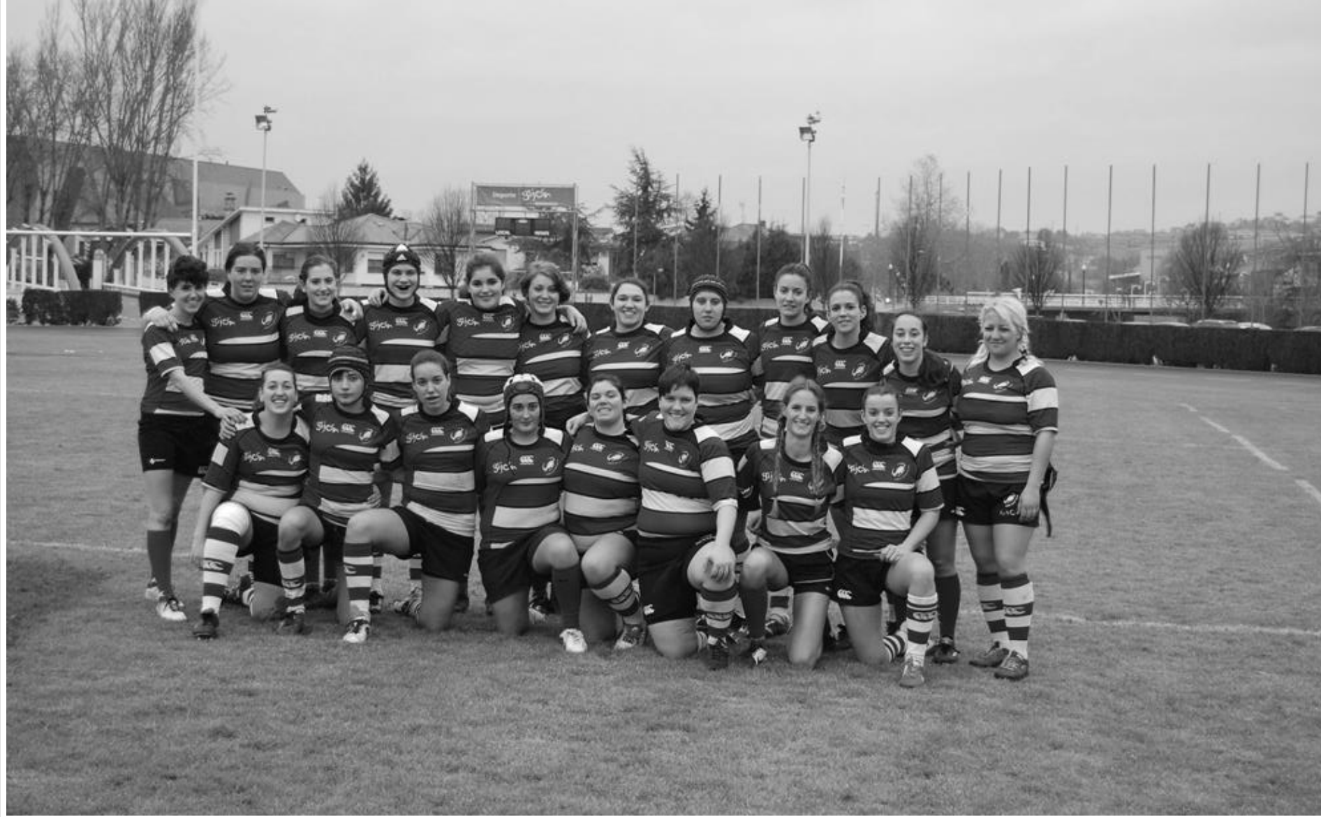
Gijón Rugby club senior femenino 2014-15