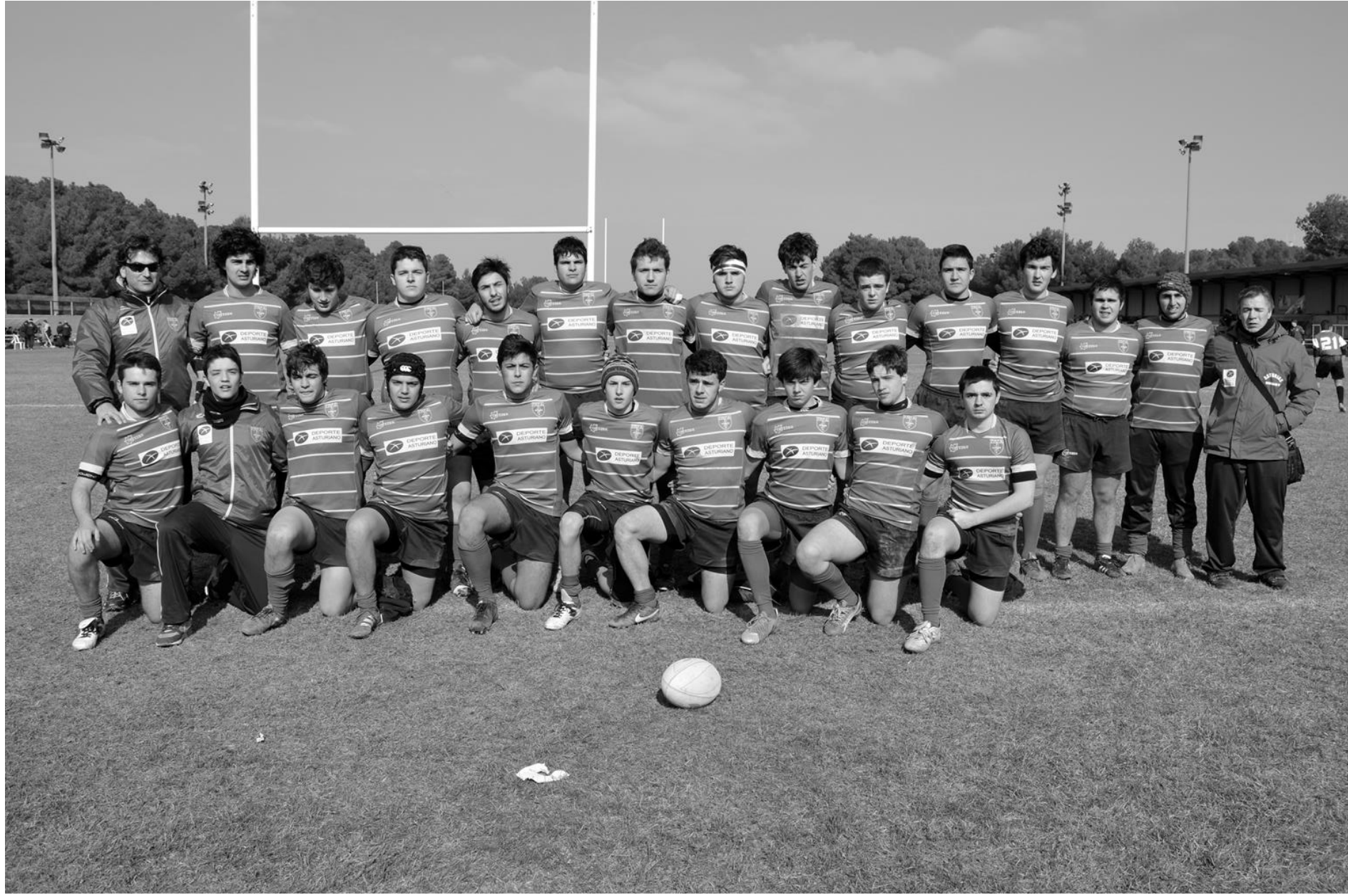
Selección Asturias Sub 18 2014-15