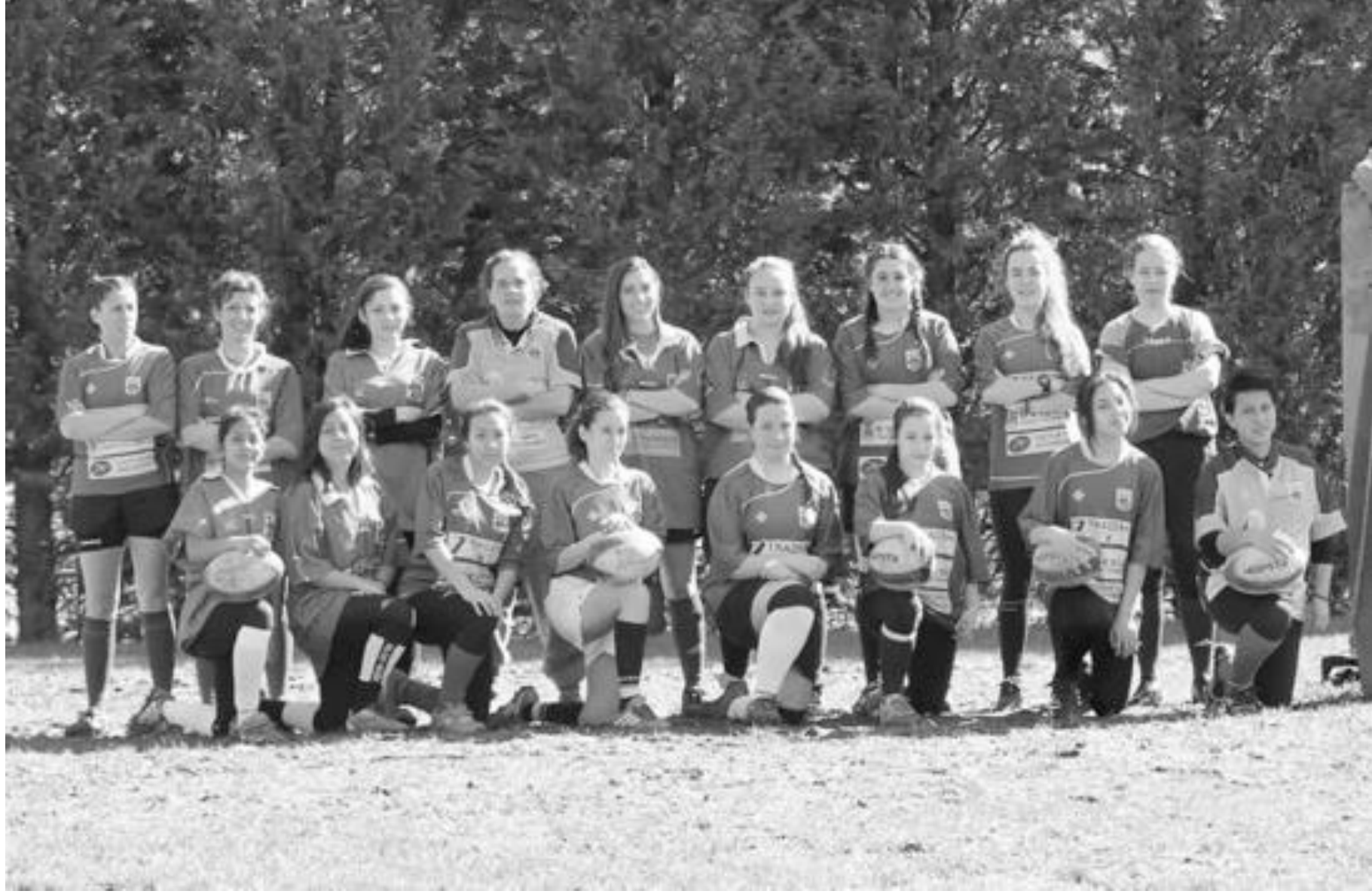
Oviedo R.C. Femenino 2014-15