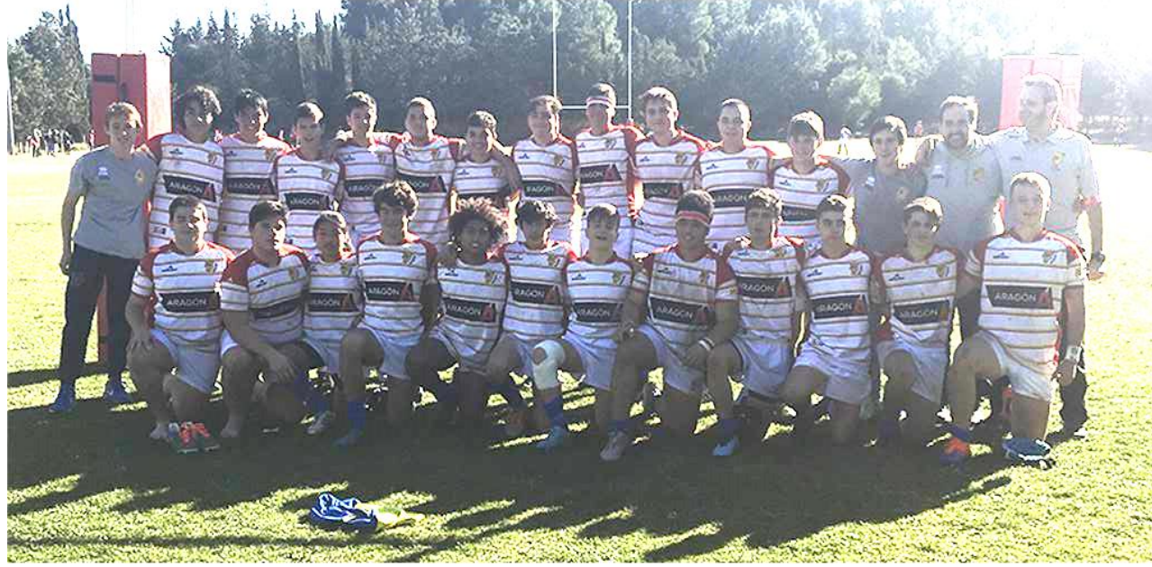
Selección Aragón Sub 16 2019-20