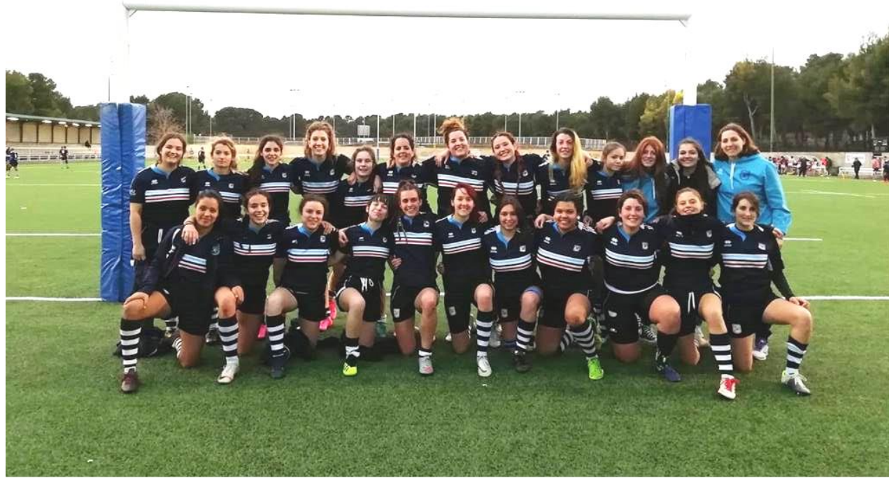
Fenix C.R. Femenino 2019-20