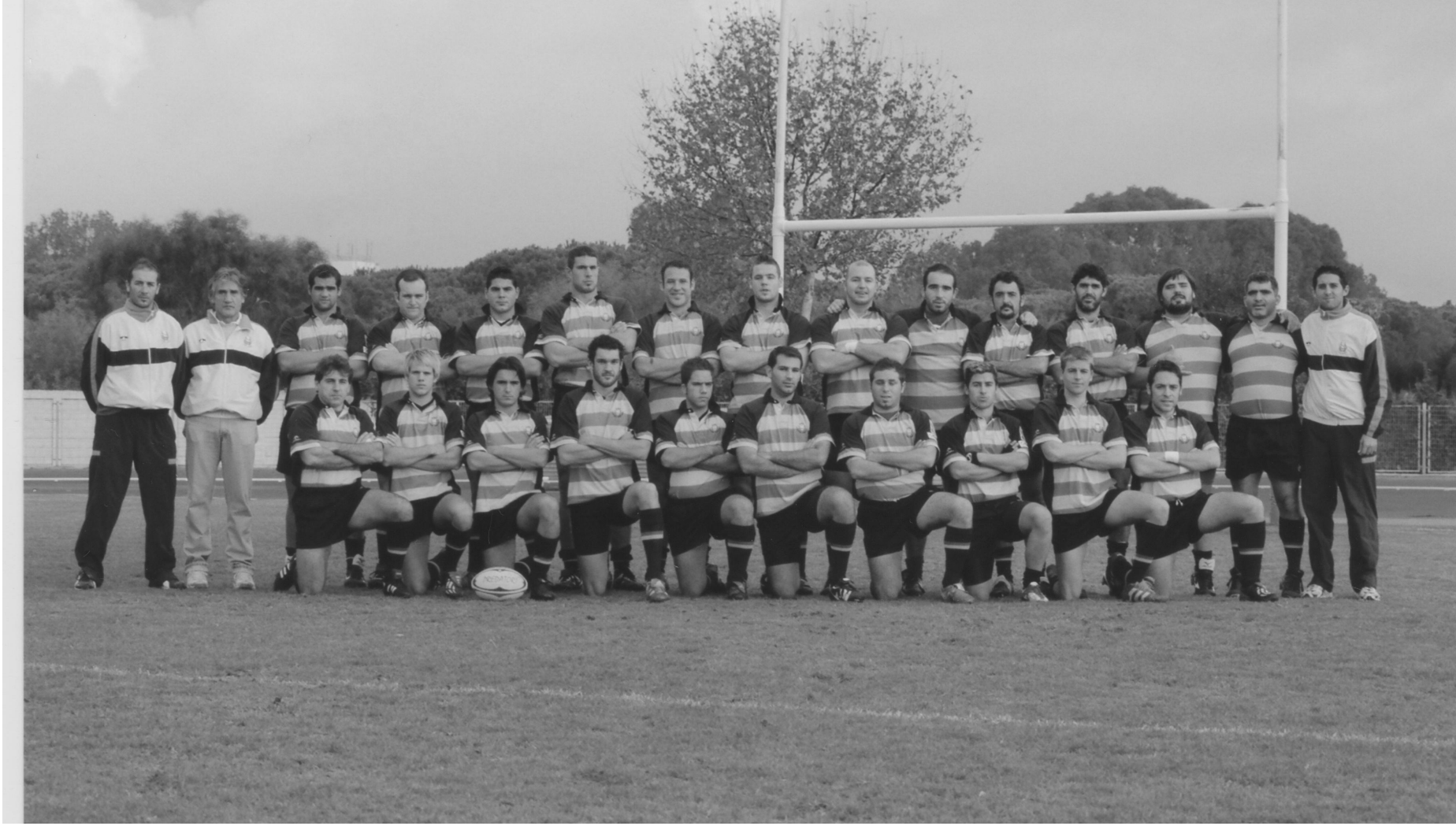
CR Atlético Portuense