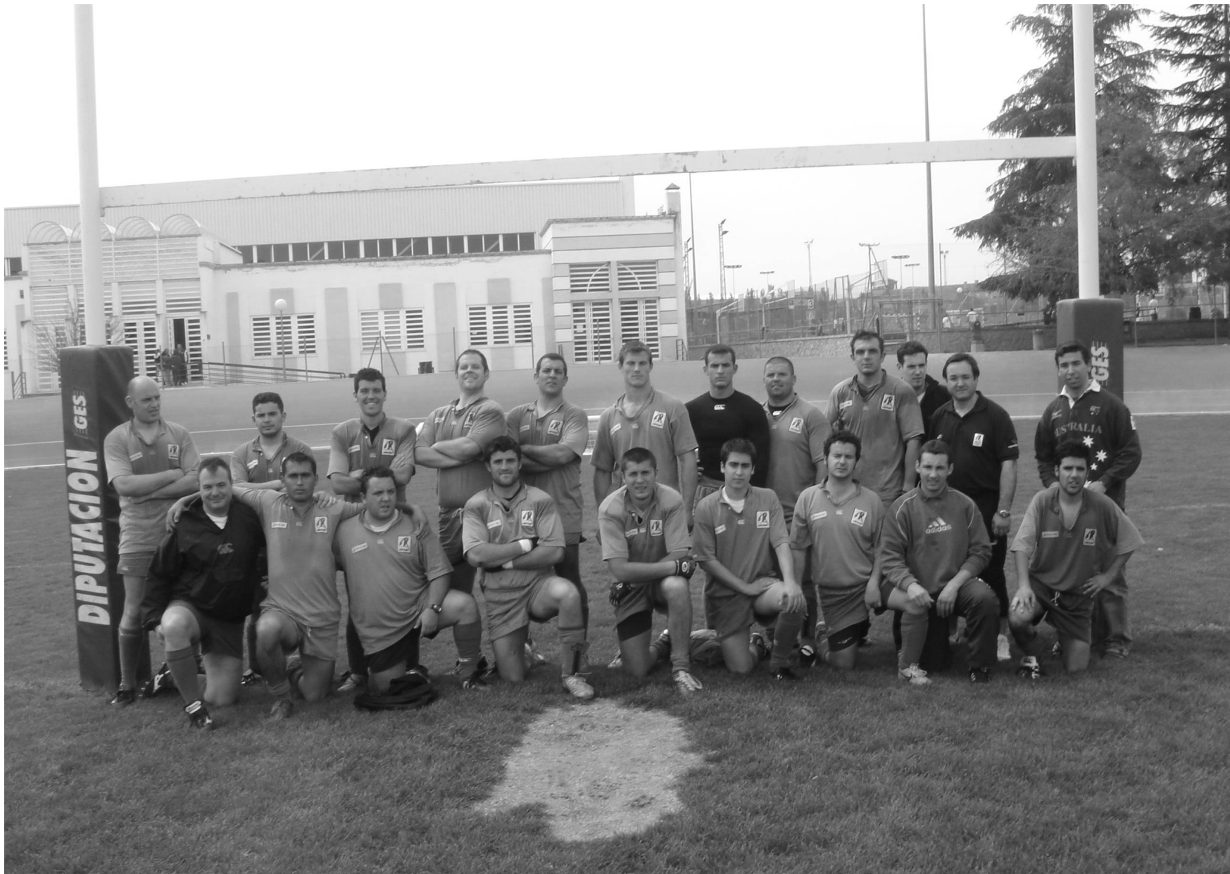
Jaén RC Campeón I División de Regional andaluza