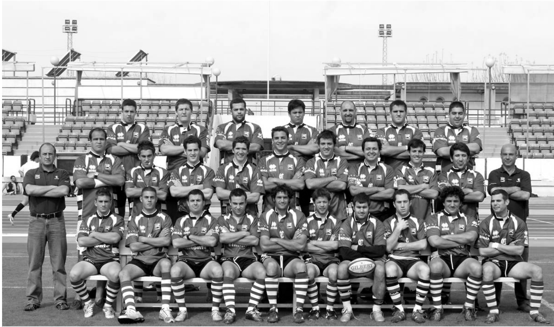
Ciencias de Sevilla RC Campeón Copa FAR 2006