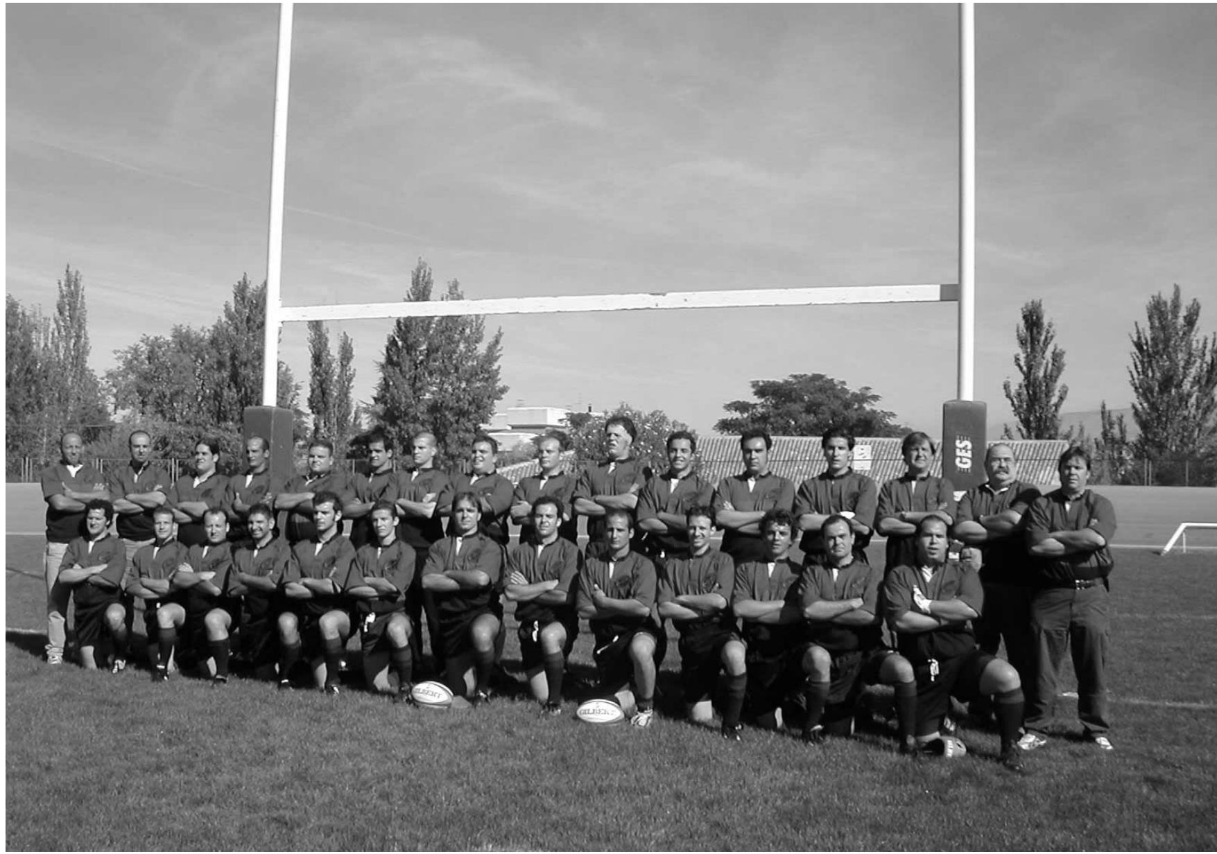
CD Granada 2004