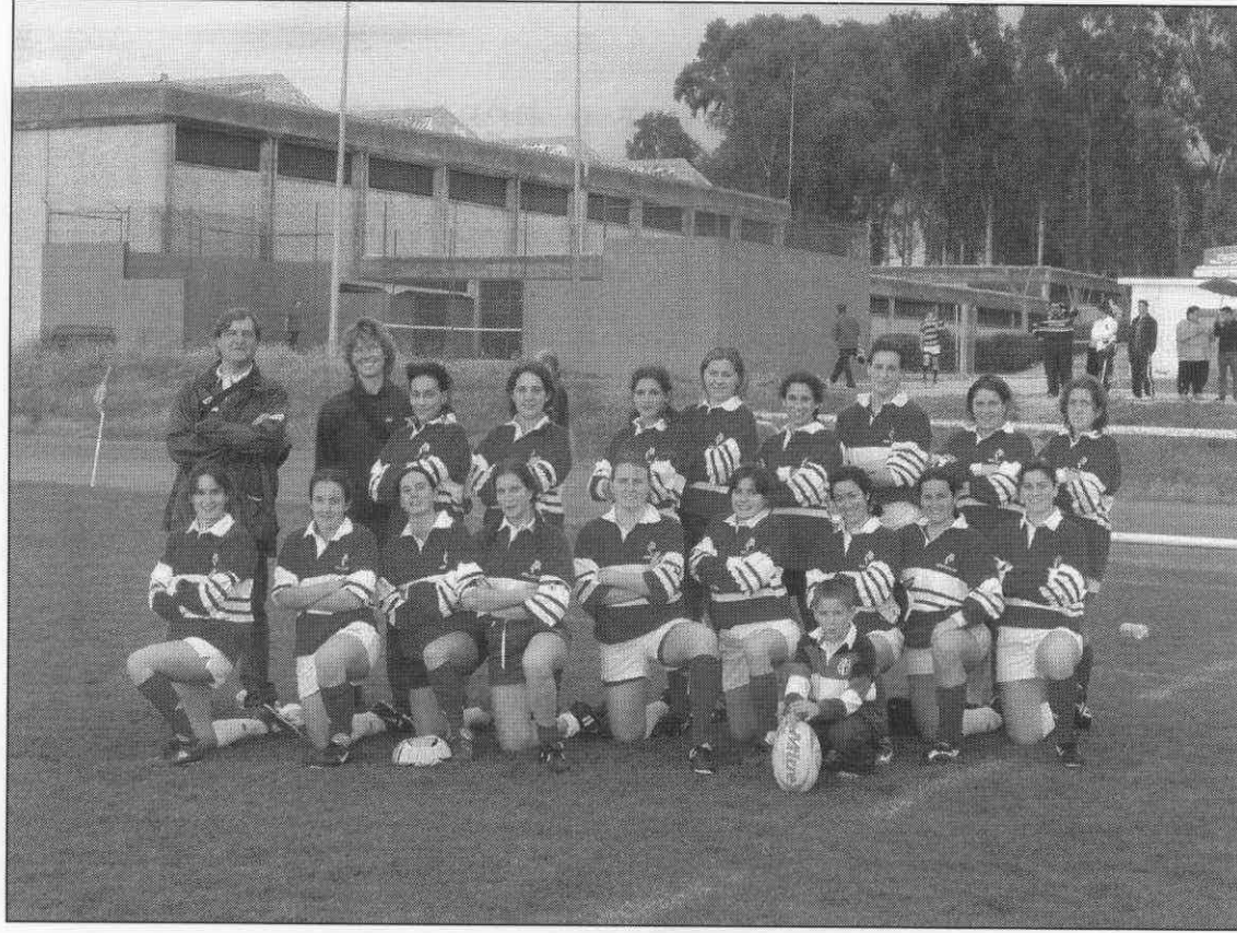
C.R. Motril Femenino

01 02 03 04 05 06 07 08 09 10 11 12 13 14 15 16 17 18 19 20 21 22 23 24 25 26 27 28 29 30 31 32 33 34 35 36 37 38 39 40 41 42 43 44 45 46 47 48 49 50 51 52 53 54 55 56 57 58 59 60 61 62 63 64 65 66 67 68 69 70 71 72 73 74 75 76 77 78 79 80 81 82 83 84 85 86 87 88 89 90 91 92 93 94 95 96 97 98 99 100