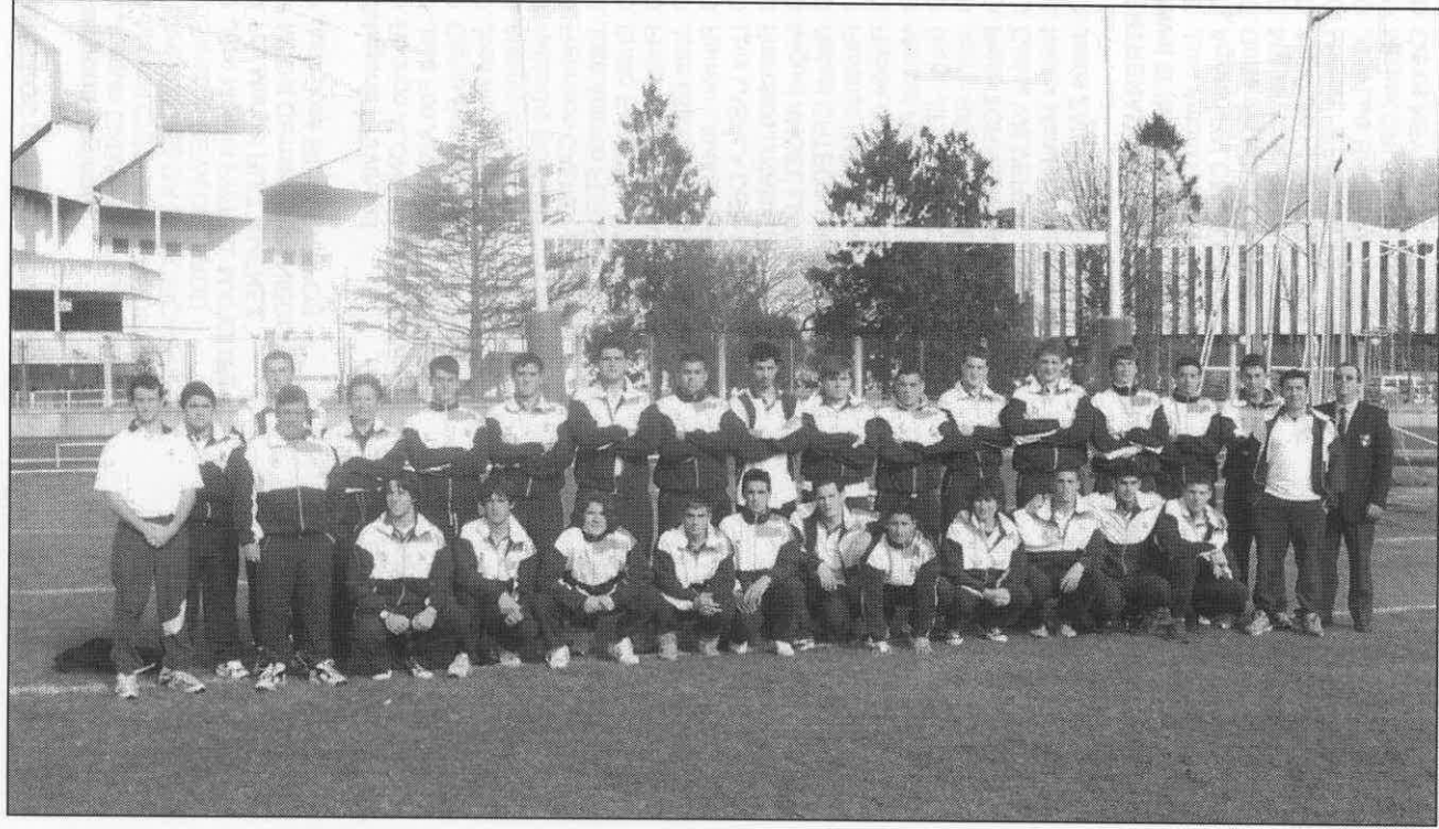
Selección Andaluza Juvenil