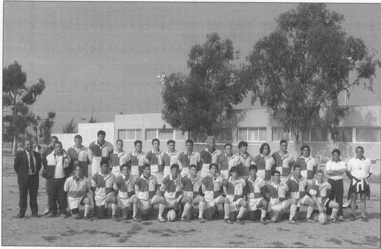
Selección Andaluza Cadete