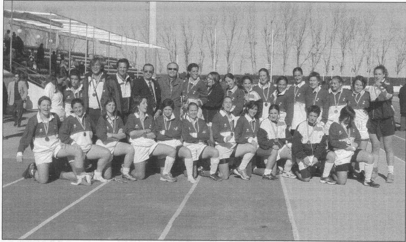
Selección Andaluza Femenina