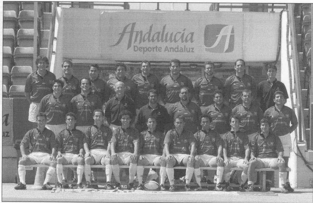
El Monte Ciencias C.R.