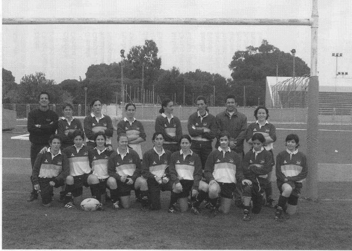
Unión Aljarafe Sevilla femenino