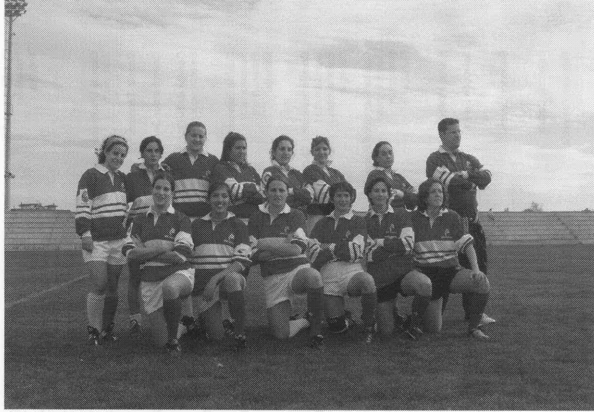
Club de Rugby Motril femenino.