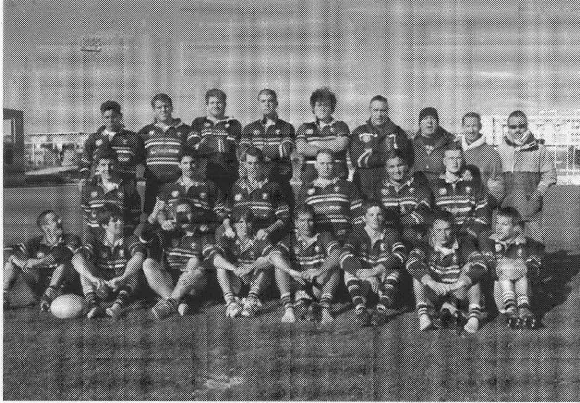
Universidad de Málaga juvenil.