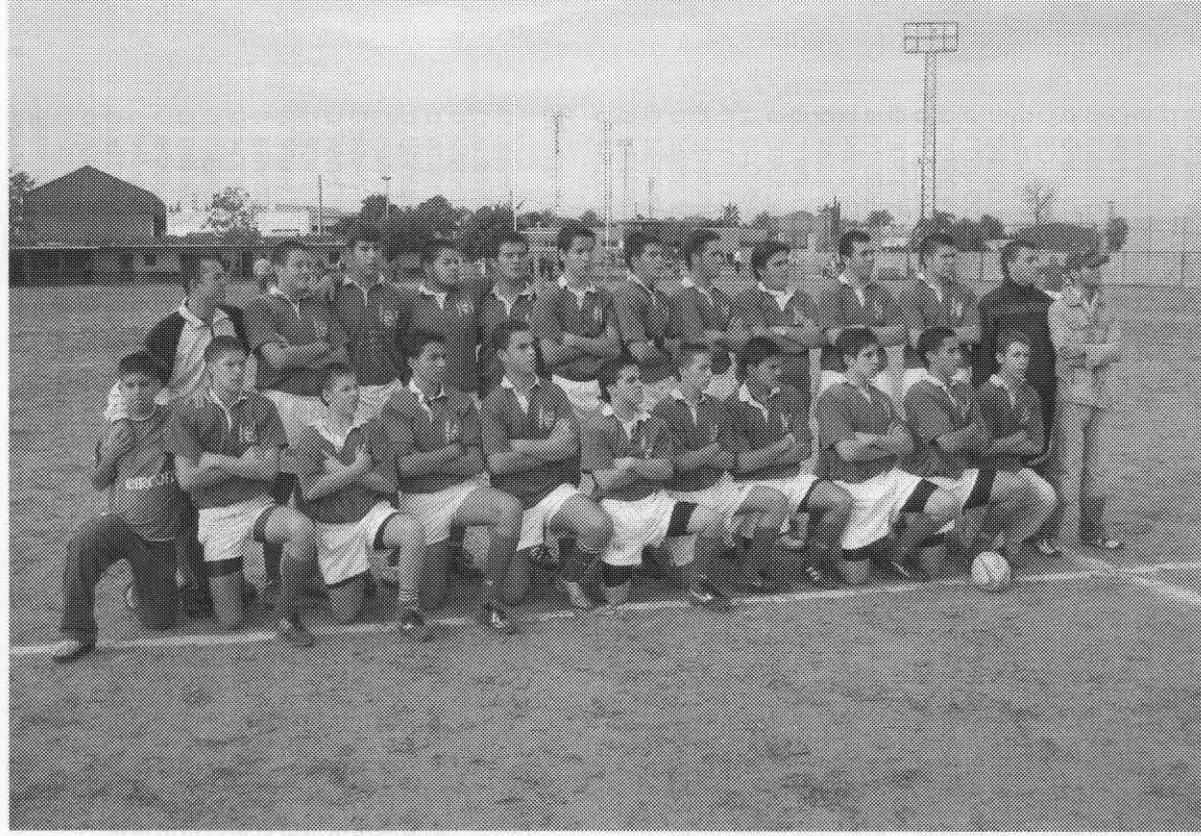
Distrito Macarena – Escuela de Rugby San Jerónimo cadete.