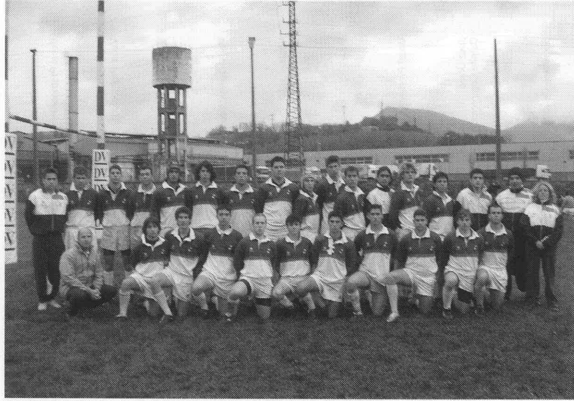
Selección andaluza cadete.