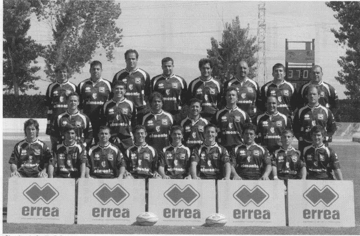
Ciencias de Sevilla R.C.