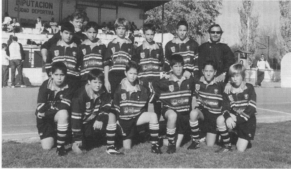
El Divino Pastor. Club de Rugby Málaga infantil